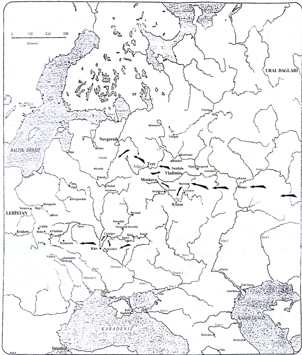
Harita II: Rusya'nın işgali sırasında Moğolların ana hareket yönleri.