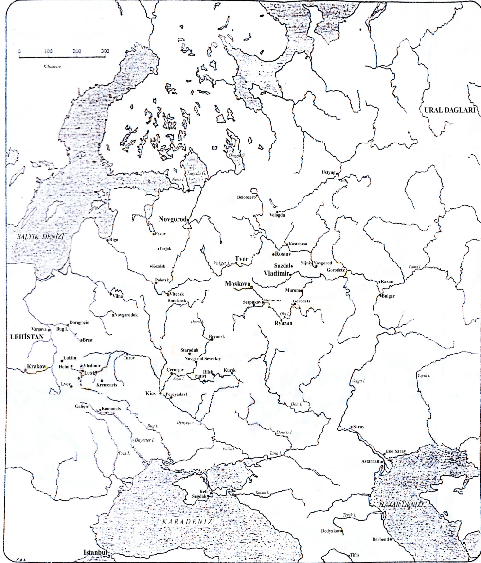
Harita I: XIII. yüzyılın Başında Rusya