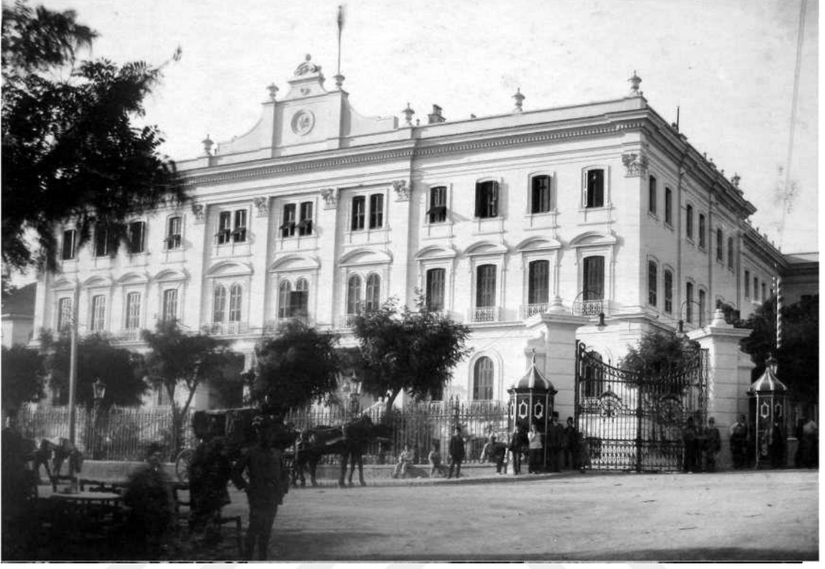
Ek 8:19. Yüzyılda Mimar Vitaliano Poselli tarafından inşa edilen Selanik Hükümet Konađı

http://www.eskiturkiye.net/arama/selanik-h%C3%BCk%C3%BCmet-kona%C4%9F%C4%B1