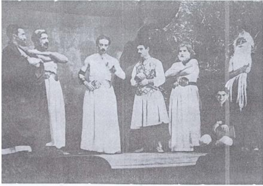
6 — Halkevlerinde Temsil : Bir Halkevi Sahnesinden görünüş