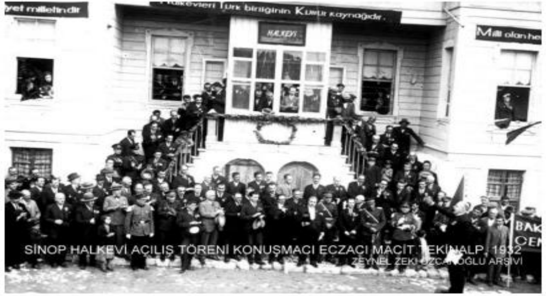
Ek 1: Sinop Halkevinin Açılış Töreninden Bir Fotoğraf (24 Haziran 1932)