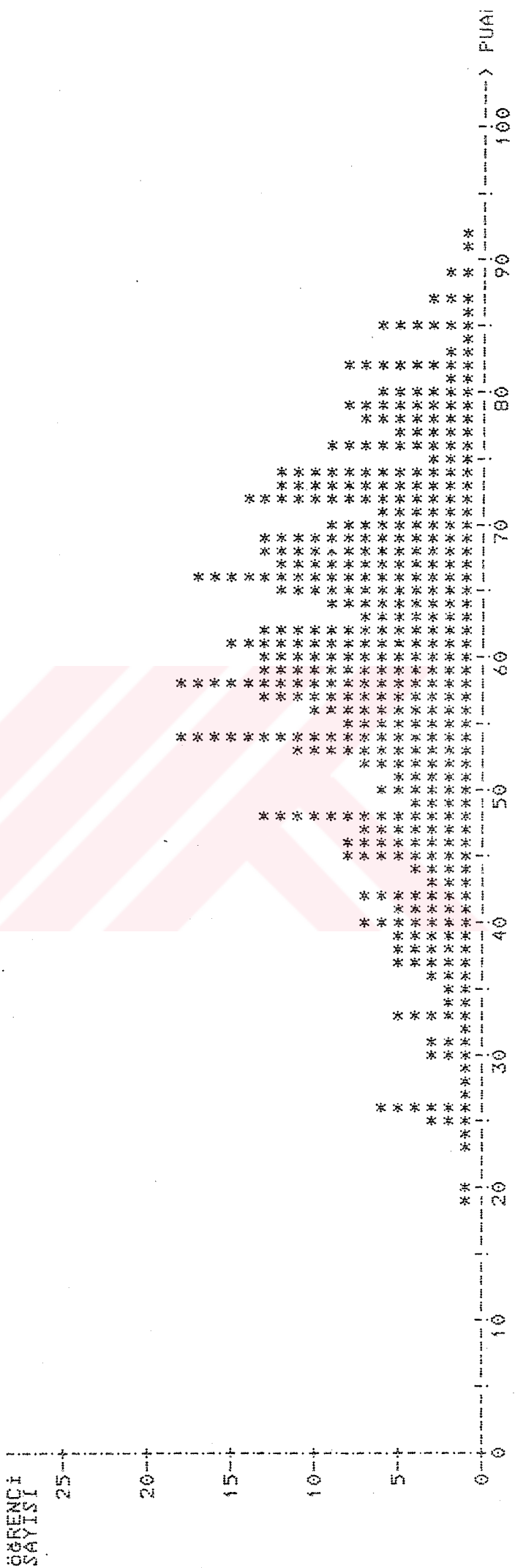
Şekil 2: Öğrencilerin Başarı Testinden Aldıkları Puan Dağılımlarının Grafiği

ÖĞRENCİ SAYISI -----> 467 ORTALAMA -----> 59.21799 EN DÜŞÜK PUAN -----> 18.60 EN YÜKSEK PUAN -----> 91.80 ORTALAMA -----> 59.21799 STANDART SAPMA -----> 14.64556 VARYANS -----> 214.49238 BASIKLIK -----> 2.68581 ÇARPIMLIK -----> -0.35012