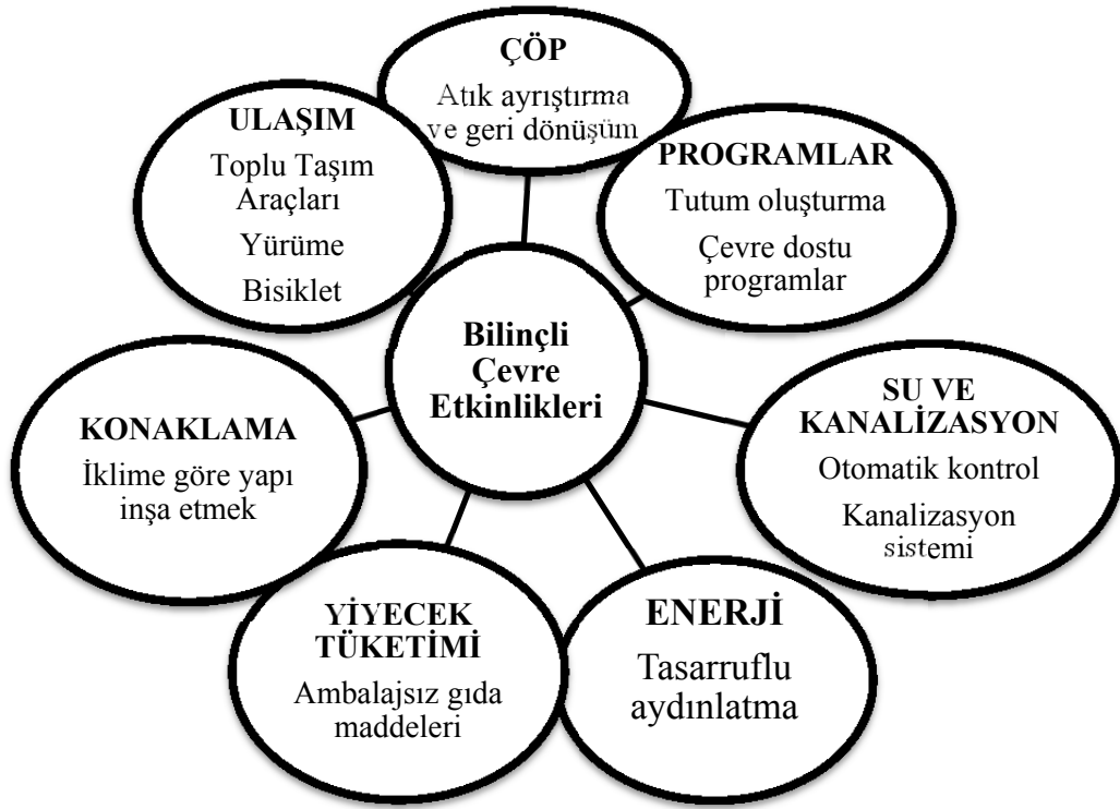
Şekil 1: Bilinçli Çevre Etkinlikleri