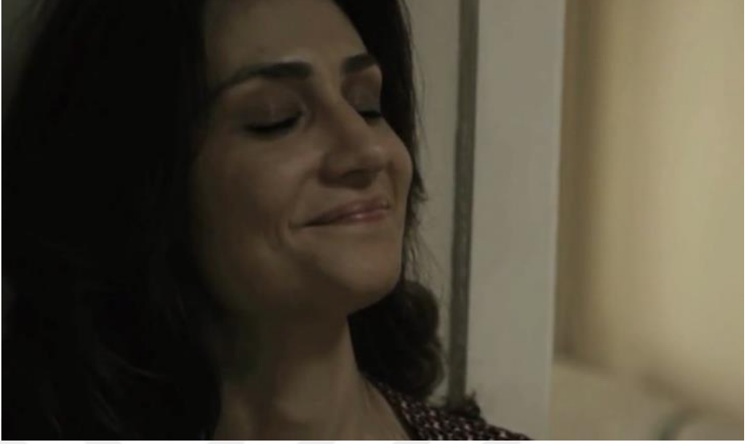
Görsel:5.21 (Zühal'in öpüşmekten duyduğu haz anı)

Zühal karakter olarak arzulu bir kadındır ve Cezmi ile yaşadığı ilişkiden tek beklentisi arzularını tatmin etmektir. Cezmi'nin Zühal'in evine ilk kez geldiğinde evin koridorunda öpüşürler ve Cezmi gider. Cezmi gittikten sonra bir süre daha Zühal'in o haz alma anında kaldığına şahit oluruz (Bkz. Görsel:5.21). Bu durumu daha iyi anlamak için Mccannel'in (2004) film noir'e dair açıklamaları faydalı olabilir. Bu tür filmlerde tasvir edilen karakterler kişinin sembolik düzende kurduğu karakteriyle bilinçaltındaki kuralsızlığı arasında kalan özneyi anlatmak için kullanılır. Lacancı açıdan buradaki (sembolik) düzenin kurduğu özne "arzuyla" bilinçaltı kuralsızlığı ise jouissance dürtüsü ile açıklanır (Flower, 2004:79).