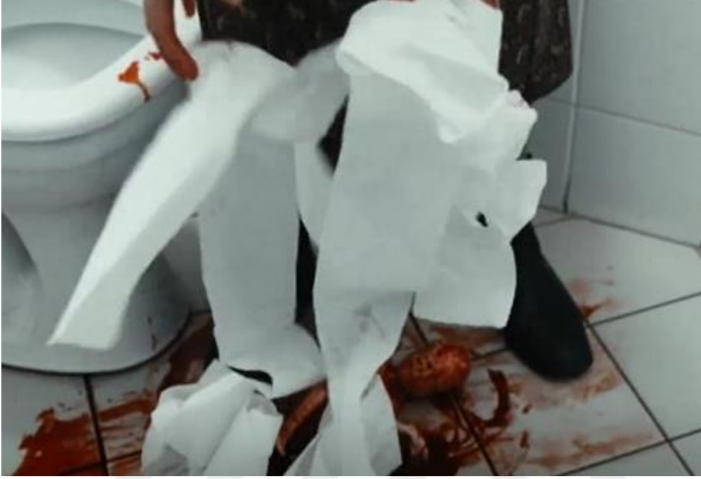
Görsel: 5.13 (Zehra gittiği hastanenin tuvaletinde düşük yapar.)

Görsel:5.13). Bu kadar sahici bir olay izledikten sonra Zehra'nın evde uyuduğunu görürüz. Sanki Zehra yaşadığı travmanın etkisiyle tuvaletten çıktıktan sonra her şeyi geride bırakmış ve hiçbir şey yaşanmamış gibi yatağına gidip uyumuştur.