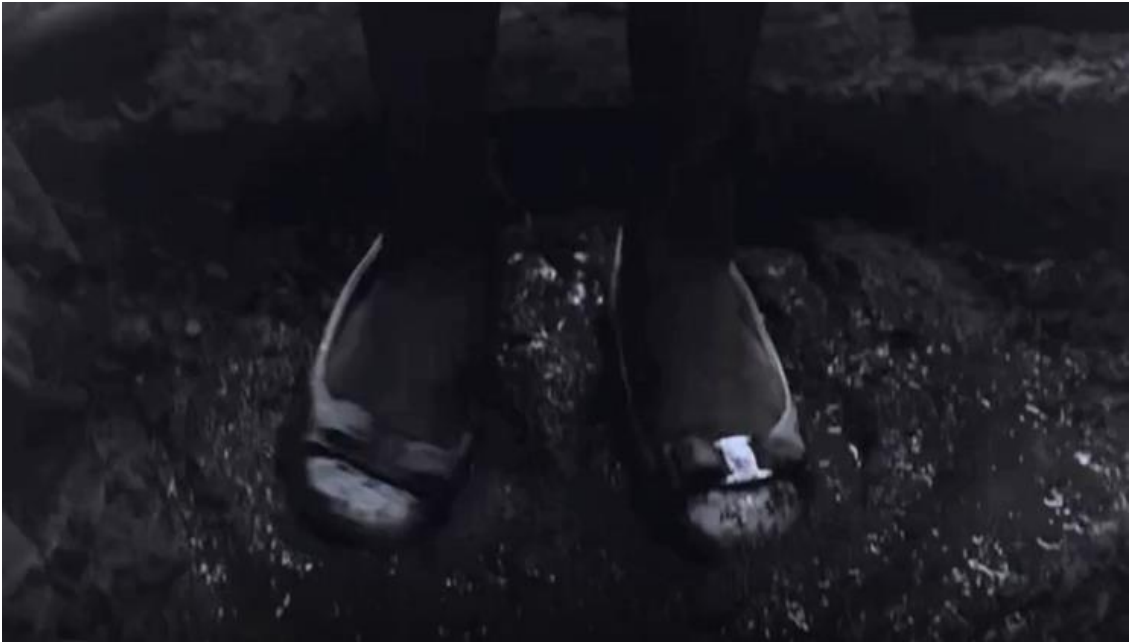
Görsel:5.32 (Zühal rüyasında çamura battığını görür.)

geçen ve sürekli yükselen bir gerilimin eşlik ettiği Sevda'nın ruh hali, burada bir şekilde düzlüğe çıkmış bir şekilde Sevda huzura kavuşmuştur. Ne var ki buradaki huzur sağlıklı bir bireyin sahip olduğu bir iyilik ve denge hali değildir. Gerçekliğin kırılmasıyla başlayan gelen psikozun kendi gerçeklik yanılgısını oluşturduğu ana işaret etmektedir. Öte yandan ardışık olarak doğa sahnesiyle karakterin yüzünün kameraya alındığı sahneler "doğadaki tekinsiz yeteneği" anlatmak için de kullanılır (Eisenstein, 2004:41). Başka bir deyişle sinemada kullanılan doğa sahneleri gerçeğin imge ve sembol düzenine karşı sürekli olarak gerçekleştirdiği meydan okumanın bir göstereni olarak da yorumlanabilir.