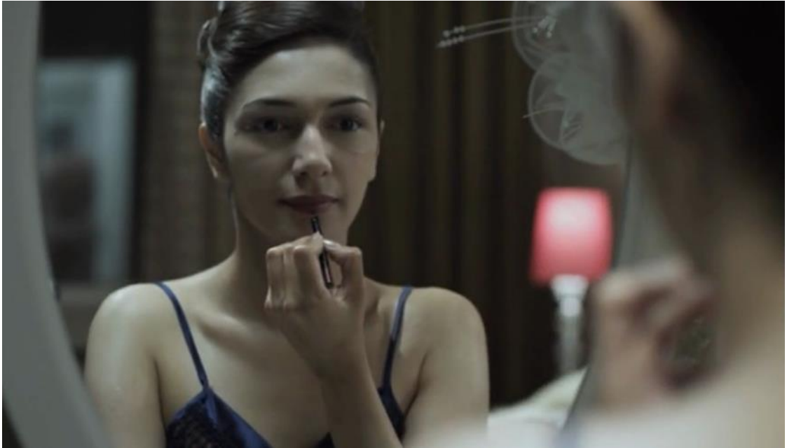
Görsel:5.29 (Sevda aldatıldığını anlayınca gülümseyerek makyajına devam eder.)