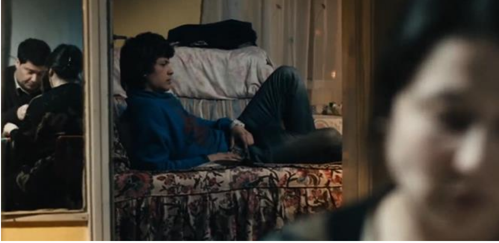
Görsel:5.3 (Olgun, anne ve babası)

Filmin ilerleyen dakikalarında Olgun karakterinin babasına olan öfke ve mesafesini, annesine olan bağlılığını ve sevgisini anlarız (Bkz. Görsel:5.3). Olgun'un gelecek hayalleri Zehra ve annesiyle birlikte bir hayat kurmaktır. Olgun'nun bu karakteri akla Freud'un Oedipus kompleksini getirir. Freud'a göre erkek çocuk annesini arzular ve onunla bütün olmak ister. Fakat babanın varlığının bilincine varması ve bu ilişkiye izin vermeyeceğini farketmesiyle birlikte hadım edilme korkusuyla anneden uzaklaşıp baba ile özdeşleşmeye başlar. Olgun karakterine de baktığımızda babasını sevmemesine rağmen aynı davranış örüntülerini sergilediğini görürüz. Annesinden gizli çekmecedan para alması, küfür etmesi ve içmesi aslında babası ile özdeşim kurduğunun göstergeleridir (Akın, 2017).