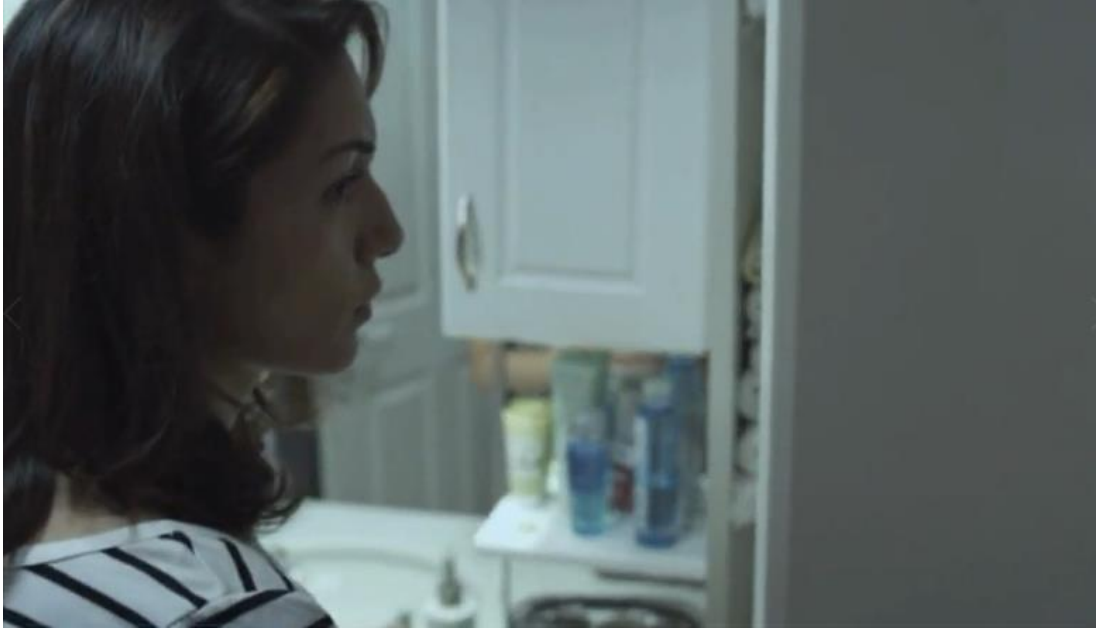
Görsel:5.24 (Sevda aldatıldığından kuşkulananmaya başlıyor.)

Zühal ile birlikte olan Cezmi eve gitmeden önce kendine yeni bir gömlek alır. Arabada üzerindeki gömleği çıkarıp yeni aldığı gömleği giyer. Çıkardığı gömleğini ise camdan atarak evine doğru yola çıkar. Bu sahnedeki yan anlam Cezmi'nin yenilenmiş bir şekilde temiz yuvasına dönmesidir. Eski gömleği ise dışarı atarken aslında Zühal ile yaşadığı “yasak ilişkiyi” dışarı atmaktadır. Zühal ataerkil anlamda “kötü” kadındır ve onun evin dışında kalması, temiz aileyi kirletmemesi gerekmektedir (Bkz. Görsel:5.23).