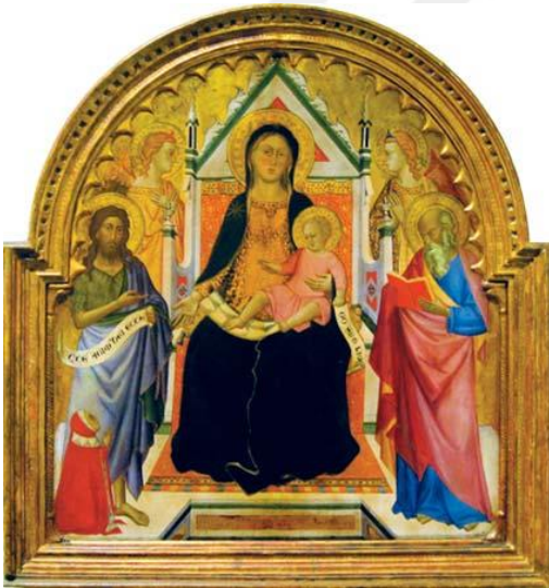
Fotoğraf 2.24 Madonna and Child with Saints John the Baptist and Paul (?), Don Silvestro dei Gherarducci'ye atfedilir, (1375) Los Angeles Sanat Müzesi. 254