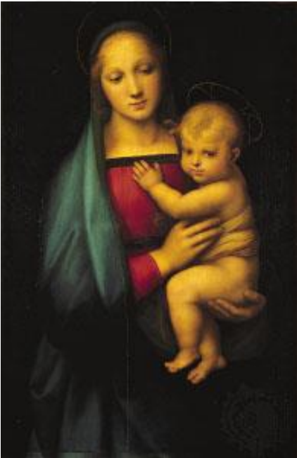
Fotoğraf 2.22 The Grand Duke's Madonna , Raphael (1505). Pitti Palace, Florence. 252