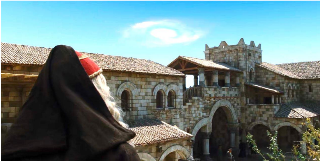
Fotoğraf 2.20 Rahip Bahira'nın kurtarıcının alametini fark ettiği sahne

Tıpkı Samuel gibi Rahip Bahira da Hz. Peygamber'in doğum mucizesine şahit olmuş, yıllardır beklenen peygamberin dünyaya geldiğini anlamıştır. Hz. Peygamber ile karşılaşmasında, onun her hareketinden etkilenip bu davranışları dini metinlerinde geçen alametlerle ötrüştüren Bahira, onun gerçekten müjdelenen peygamber olduğuna emin olmuştur. Samuel'in aksine Rahip Bahira, peygamberi belirli bir kavim ile sınırlandırmadığı için Hz. Peygamber'in peygamberliğini daha hızlı kabullenebilmiştir.