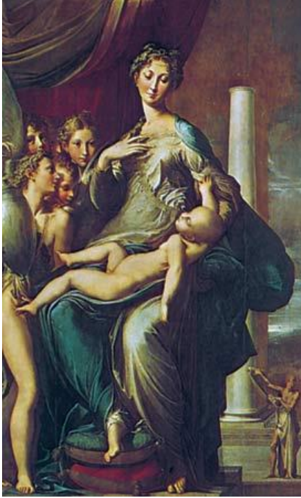
Fotoğraf 2.23 Madonna of the Long Neck , Parmigianino (1535) Uffizi, Florence. 253