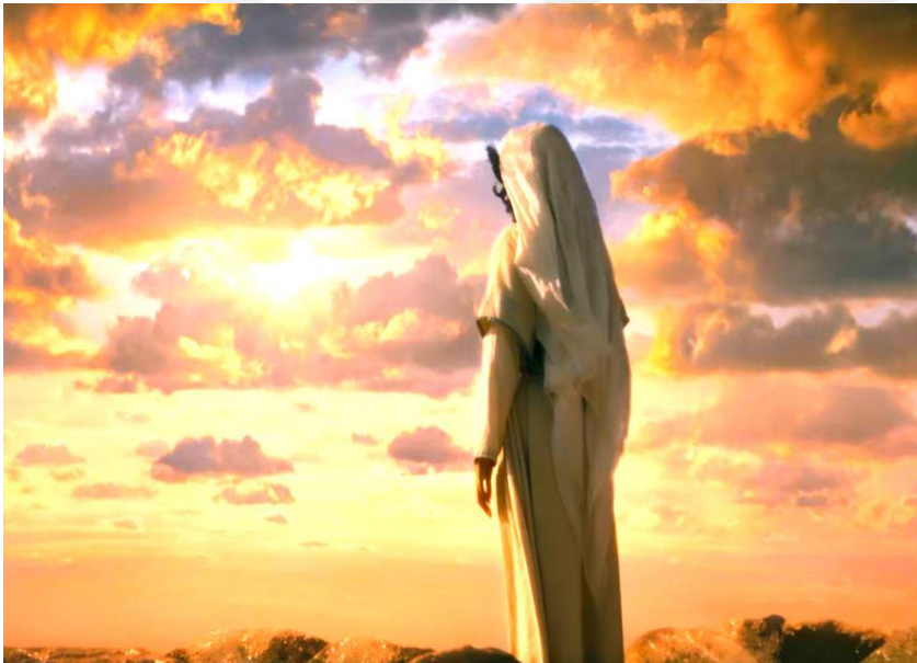
Fotoğraf 2.28 Hz. Muhammed: Allah'ın Elçisi filminden bir mucize sahnesi

7. ve 8. görsellerde yer verilen İsa Mesih ile Hz. Muhammed tasvirleri de birbirlerini anımsatmaktadır. İsa Mesih'in görsel olarak tasvirinde dikkat çeken birtakım hususlar bulunmaktadır. Bu hususları mucizevi bir hissiyat oluşturmaları, ilahi bir atmosfer çizmeleri ve sembolik anlamlar taşımaları olarak saymak mümkündür. Öyle ki bu hususlar söylemsel bazı anlamlar taşımaktadır. Hristiyan dünyasının İsa Mesih'e atfettiği kodları, onun tasvirlerinde gözlemlemek mümkündür. Teslisten mucizelerle dolu yaşamına, insanlık için çektiği acılardan tekrar dirilişine kadar Hristiyan teolojisinin iman ettiği meselelerin bir