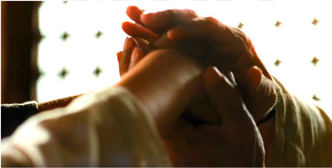
Fotoğraf 2.5 Abdulmuttalib'in ölmeden önce Hz. Peygamber'i Ebû Tâlib'e emanet etmesi

Ebû Tâlib, onu asla terk etme. Babasını hiç görmedi, annesi de öldü. Onu koruyacak kişi sensin. Onu kendi evladın gibi gör. Ona her şeyi söyle, hak ettiği sevgiyi ver. Şimdi huzur içinde ölebilirim.