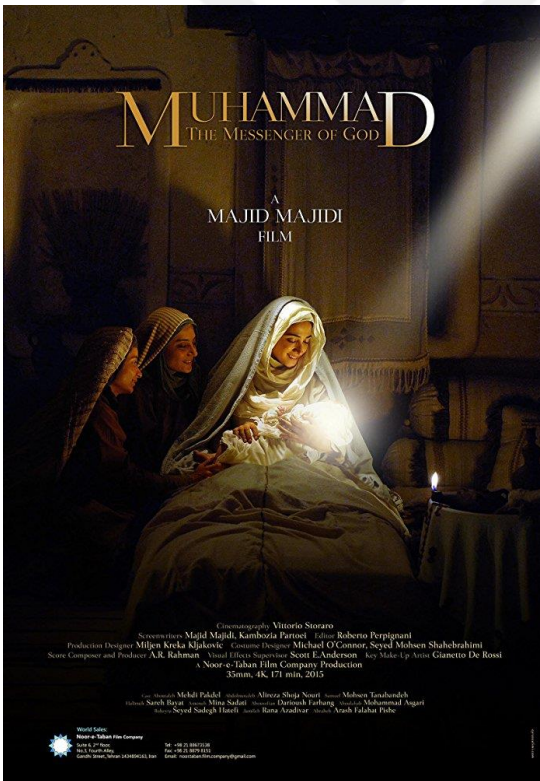
Fotoğraf 2.26 Hz. Muhammed: Allah'ın Elçisi filmi resmi afişlerinden biri 256