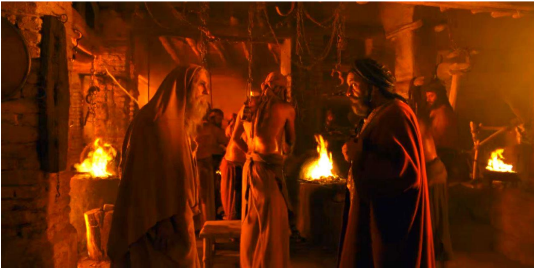
Fotoğraf 2.16 Savaş hazırlığı yapılan bir ortamda Hâşimî-Emevî karşıtlığının Ebû Tâlib ve Ebû Süfyân karakterleri üzerinden mezhepsel bir söylemi olarak yansıtıldığı sahne

Karşıt karakterler arasında en dikkat çeken eşleşme Ebû Tâlib ile Ebû Süfyân karşıtlığıdır. Ebû Tâlib ile Ebû Süfyân arasındaki zıtlık İslam tarihi boyunca meydana gelen karşıtlıkların sembolik olarak iki şahsa indirilmiş hâli olarak görmek mümkündür. İki şahsın karşıtlığı aslında Haşimoğulları ve Ümeyyeoğulları arasında süregelen çekişmenin tezahürüdür. Nitekim filmde Haşimoğullarından Ebû Leheb'in eşi Ümeyyeoğullarından Ümmü Cemil ile bir diyalogu, aileler arasındaki husumete işaret etmektedir. Ümmü Cemil Haşimoğulları ile Ümeyyeoğulları'nın barışmaları için arada kendisinin kurban seçildiği yönünde sitem ederken Ebû Leheb de iki aile arasında barış olmayacağını ifade ederek geleceğe bir projeksiyon yapmaktadır. Majidi'nin çizdiği Ebû Tâlib ve Ebû Süfyân karşıtlığı ve Ebû Leheb'in husumetin devam edeceği öngörüsü mezhepsel bir söylem niteliğindedir.