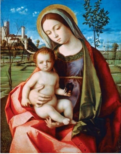
Fotoğraf 2.21 Madonna and Child , Giovanni Bellini (1500). Metropolitan Sanat Müzesi, New York City. 251