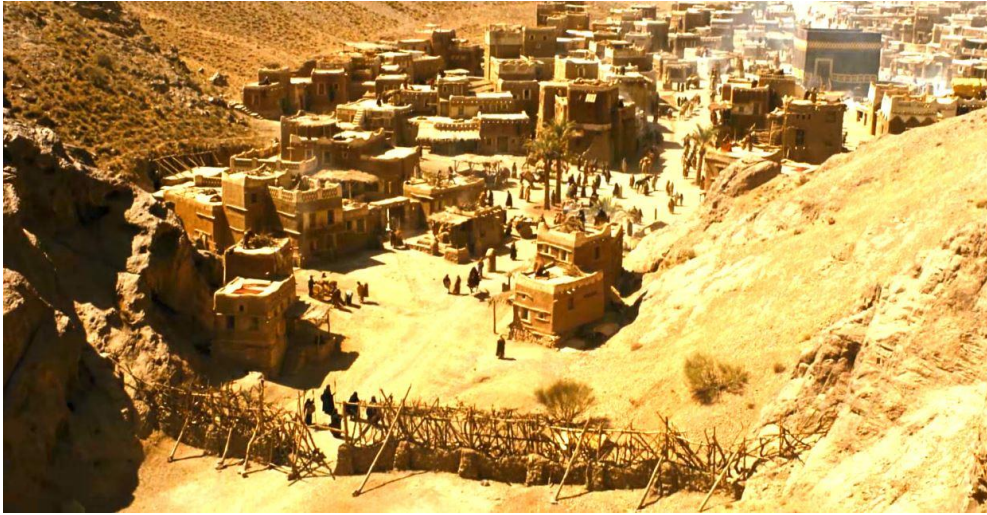
Fotoğraf 2.10 Mekke'nin ve Şi'bü Ebi Talib'in görüntüsünün verildiği sahne