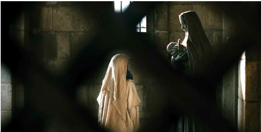
Fotoğraf 2.29 Hz. Peygamber'in, İsa Mesih ve Hz. Meryem heykelini izlediği sahne

Majidi'nin filmde, Hz. Peygamber ile İsa Mesih'i karşı karşıya konumlandığı bir sahnesi de bulunmaktadır. Günümüz dünyasında var olan güçlü bir İsa Mesih figürü karşısında Hz. Peygamber'i konumlandığı sahnesinden sembolik ve söylemsel yorumlar çıkarmak mümkündür.