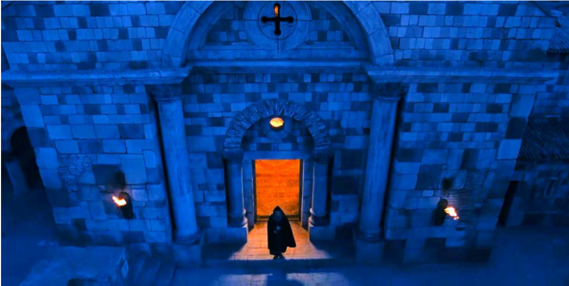
Fotoğraf 2.18 Rahip Bahira'nın kozmik bir mucizeye tanık olarak kurtarıcının doğduğunu anladığı ve İncil'den bir pasaj okuduğu sahne

Yahudi Samuel, kurtarıcının Mekkeli bir Yahudi aileden çıkacağını düşünüyordu. Bebeği ararken ad verme törenlerine denk geldiklerinde yanındaki karakterin küçümser bir edayla sorduğu bu kavimden mi peygamber çıkacak sorusuna “Bu kavimden değil, bu kavim için” cevabını vererek peygamberin İsrailoğulları'ndan çıkacağından ne kadar emin olduğu anlaşılmaktadır. Fakat Samuel, o gece Mekkeli Yahudilerden kimsenin doğum yapmadığını öğrenmesi üzerine fikrinde değişiklikler başlamıştır. Din adamlarıyla yaptığı bir konuşmada kurtarıcının onlardan olmaması ihtimali hakkında konuşmuş ve bu şüphe içinde yer etmiştir. Samuel, artık kurtarıcının onlardan olmadığına inanmaya başlamıştır. Uzun süre Hz. Peygamber'i bulmaya çalışan Samuel, sonunda kendisinin mucizesine tanık olmuştur. Mucizeyi görmesi sonucunda hiçbir şüphesi kalmayan Samuel, filmin sonunda da iman edenlerden birisi olarak izleyicinin karşısına çıkmaktadır.