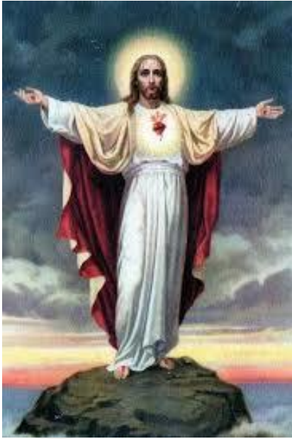
Fotoğraf 2.27 L'arrivée de Jésus-Christ pour son règne de mille ans (Bin yıllık hükümü için gelen İsa Mesih) 259