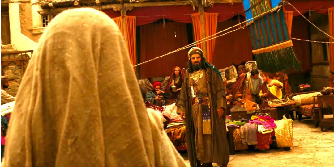
Fotoğraf 2.15 Gösterişli bir hayat sürerken insanlara insanlık dışı muamele eden Ebû Leheb sahnesi

Karşıt karakterler arasında en dikkat çeken eşleşme Ebû Tâlib ile Ebû Süfyân karşıtlığıdır. Ebû Tâlib ile Ebû Süfyân arasındaki zıtlık İslam tarihi boyunca meydana gelen karşıtlıkların sembolik olarak iki şahsa indirilmiş hâli olarak görmek mümkündür. İki şahsın karşıtlığı aslında Haşimoğulları ve Ümeyyeoğulları arasında süregelen çekişmenin tezahürüdür. Nitekim filmde Haşimoğullarından Ebû Leheb'in eşi Ümeyyeoğullarından Ümmü Cemil ile bir diyalogu, aileler arasındaki husumete işaret etmektedir. Ümmü Cemil Haşimoğulları ile Ümeyyeoğulları'nın barışmaları için arada kendisinin kurban seçildiği yönünde sitem ederken Ebû Leheb de iki aile arasında barış olmayacağını ifade ederek geleceğe bir projeksiyon yapmaktadır. Majidi'nin çizdiği Ebû Tâlib ve Ebû Süfyân karşıtlığı ve Ebû Leheb'in husumetin devam edeceği öngörüsü mezhepsel bir söylem niteliğindedir.