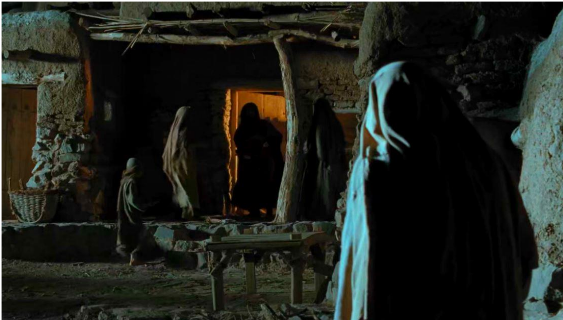
Fotoğraf 2.6 Ebû Tâlib'in Hz. Peygamber'i Hz. Ali'ye emanet ettiği sahne

Ebû Tâlib: Ali, oğlum! Bölüştürme bitti mi? Peygamberi yalnız bırakma. Onun yanında kal. Hz. Ali: Tabi ki, babacığım.