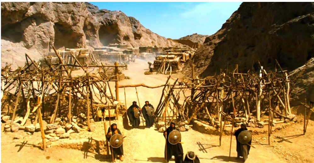
Fotoğraf 2.11 Müslümanların tecrite uğradığı Şi'bü Ebi Talib'in görüntüsünün verildiği sahne