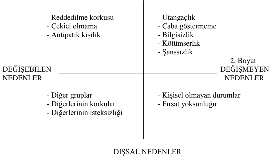
Şekil 1. Yalnızlığın Algılanan 13 Nedeni (Michela, Peplau ve Weeks, 1982)

Michela, Peplau ve Weeks, (1982) yalnızlığın algılanan 13 nedenini şu şekilde gruplandırmışlardır: