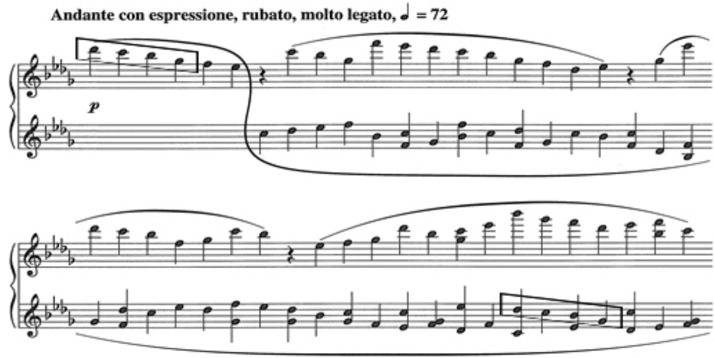
Şekil 11. Pour Irina'nın başlangıcı © SCHOTT MUSIC, Mainz - Germany