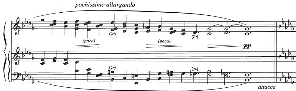
Şekil 13. Pour Irina yavaş bölümün sonu © SCHOTT MUSIC, Mainz - Germany

Etüdün başından itibaren piano nüansı ile ilerleyen müzik, son on dört akorla beraber gelen crescendo ve decrescendo ile hareketlenir ve pianissimo nüansla yavaş olan ilk bölüm sona erer (Şekil 13). Bölüm boyunca yapılan rubato dışında tek hareket olan bu kısımda, crescendo ve decrescendo çok abartılmadan küçük tutularak sakin karakteri bozmamaya dikkat edilmelidir.