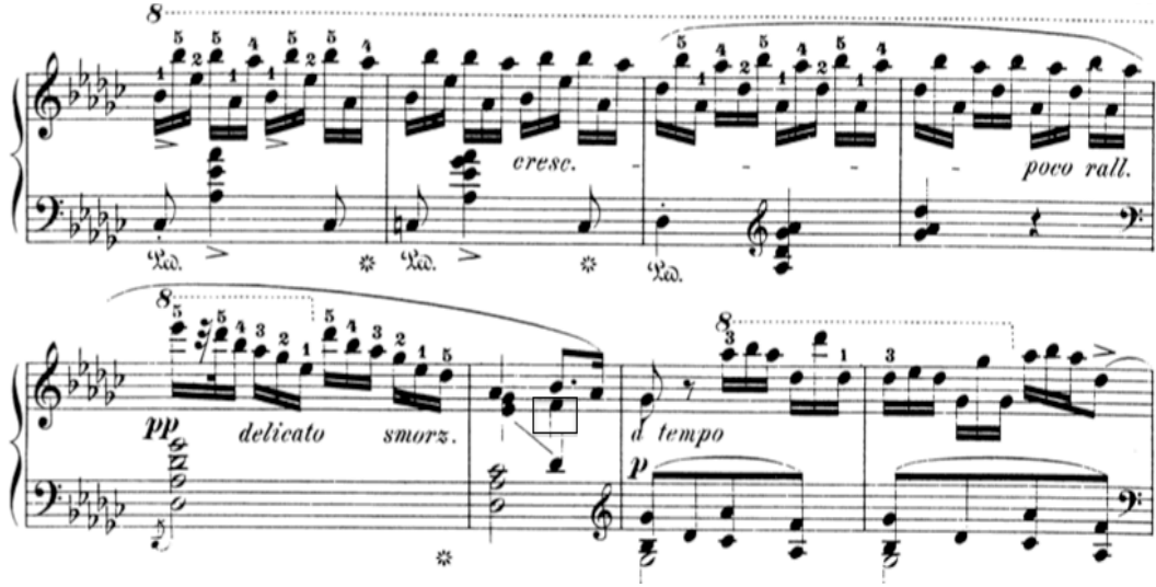
Şekil 9. Chopin Etüt Op. 10 No. 5 61-68. ölçüler