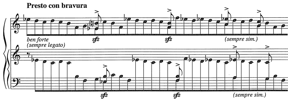
Şekil 17. On yedinci etüdün başlangıcı

Ligeti, üçüncü kitap etütlerinden sadece À bout de souffle ’da tempoyu kademe kademe artırmadan, başından sonuna kadar sabit tutmuştur. Temposu Presto con bravura olan bu etütteki sekizlik dizilerde aksanlar sağ ve sol elde hep aynı notalardadır ve kanondan dolayı hep arka arkaya gelerek Ligeti’nin stil özelliklerinin temel taşlarından biri olan aksak ritmi ortaya çıkarır (Şekil 17).