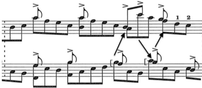
Şekil 7. Çapraz aksanlama

Nabız yükselir, fakat tempo aynıdır. Vivacissimo con brio 'da çapraz aksanlarla gelen aksamaya ve dolayısıyla ritimdeki asimetriye rağmen, tartı nettir (Şekil 7).