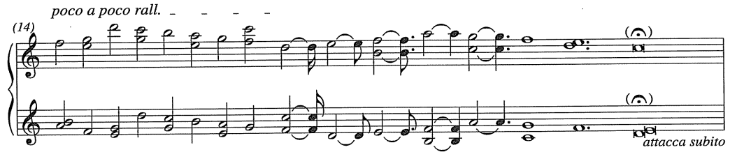
Şekil 4. On beşinci etüt 14. ölçü

Hızlı bölüme kadar nüansın piano olduğu bu yavaş kısım, 15. ölçüde son bulur. Ligeti, yavaş bölmenin bitişinde rallentando kullanmış, aynı etkiyi sürdürmek için son akorların nota değerleriyle oynayarak tempoyu yavaşlatmıştır. Bu yavaşlama ise cümlelerin içinde sürekli duyduğumuz re-mi-fa-la motifinin altıncı ve son kez gelişile başlamaktadır (Şekil 4).