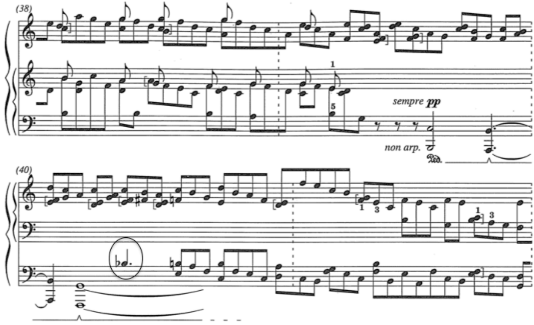
Şekil 8. On beşinci etüt 38-41. ölçüler © SCHOTT MUSIC, Mainz - Germany