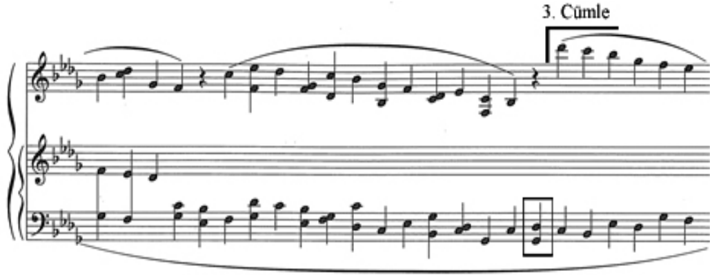
Şekil 12. Pour Irina yavaş bölüm üçüncü cümle başlangıcı © SCHOTT MUSIC, Mainz – Germany