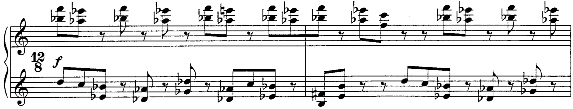
Şekil 2. Hocketing ritim

Ligeti'nin neredeyse bütün etütlerinde kullandığı aksanlar, sadece sekizinci etüt Fém 'de kullanılmamıştır. Etüt genelde tam beşlilerin kullanıldığı sekizlik “hocketing” ritim üzerine kurulmuştur (Şekil 2). “Hocketing” ritim iki ya da daha fazla partiden oluşabilir. Tek başlarına çalındığında anlam ifade etmemekle beraber birleştirildiğinde bir bütün (melodi) oluştururlar (Steinitz, 2003: 300). Ligeti, etüdün başında yazdığı açıklamada etütte kullanılacak aksanları yorumcunun kararına bırakmıştır.