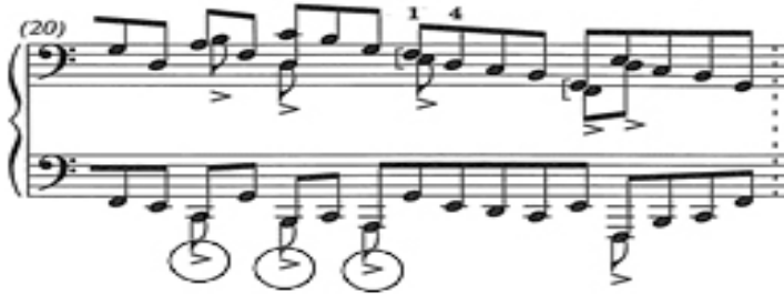
Şekil 6. On beşinci etüt 20. ölçü

Alt parti, kalın perdelere indikçe sık kullanılan aksanlarla daha aksak hale gelir. 20. ölçüde alt partide arka arkaya yerleştirilmiş aksanlar tansiyonun giderek yükselmesinde büyük önem taşıdığı için özellikle belirtilmelidir (Şekil 6).