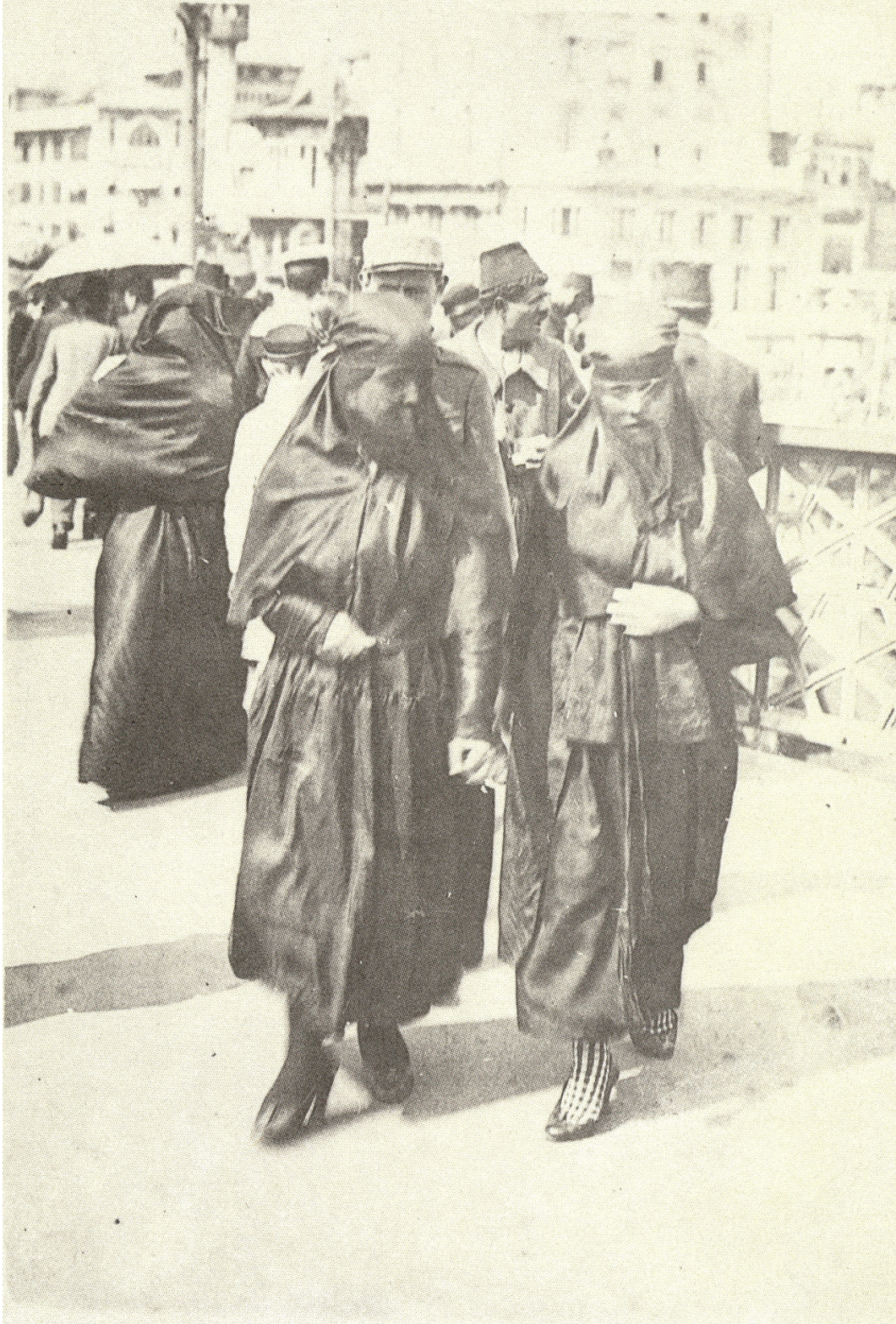
Fig. 19. Two fashionable Muslim women walking on the Galata Bridge, page 88 of İşgal İstanbul'undan fotoğraflar: Fransız Ordusu Sinema-Fotoğraf Servisi (Romeo Marchinez'in arşivinden) İstanbul: Türkiye Ekonomik ve Toplumsal Tarih Vakfı, 1996.