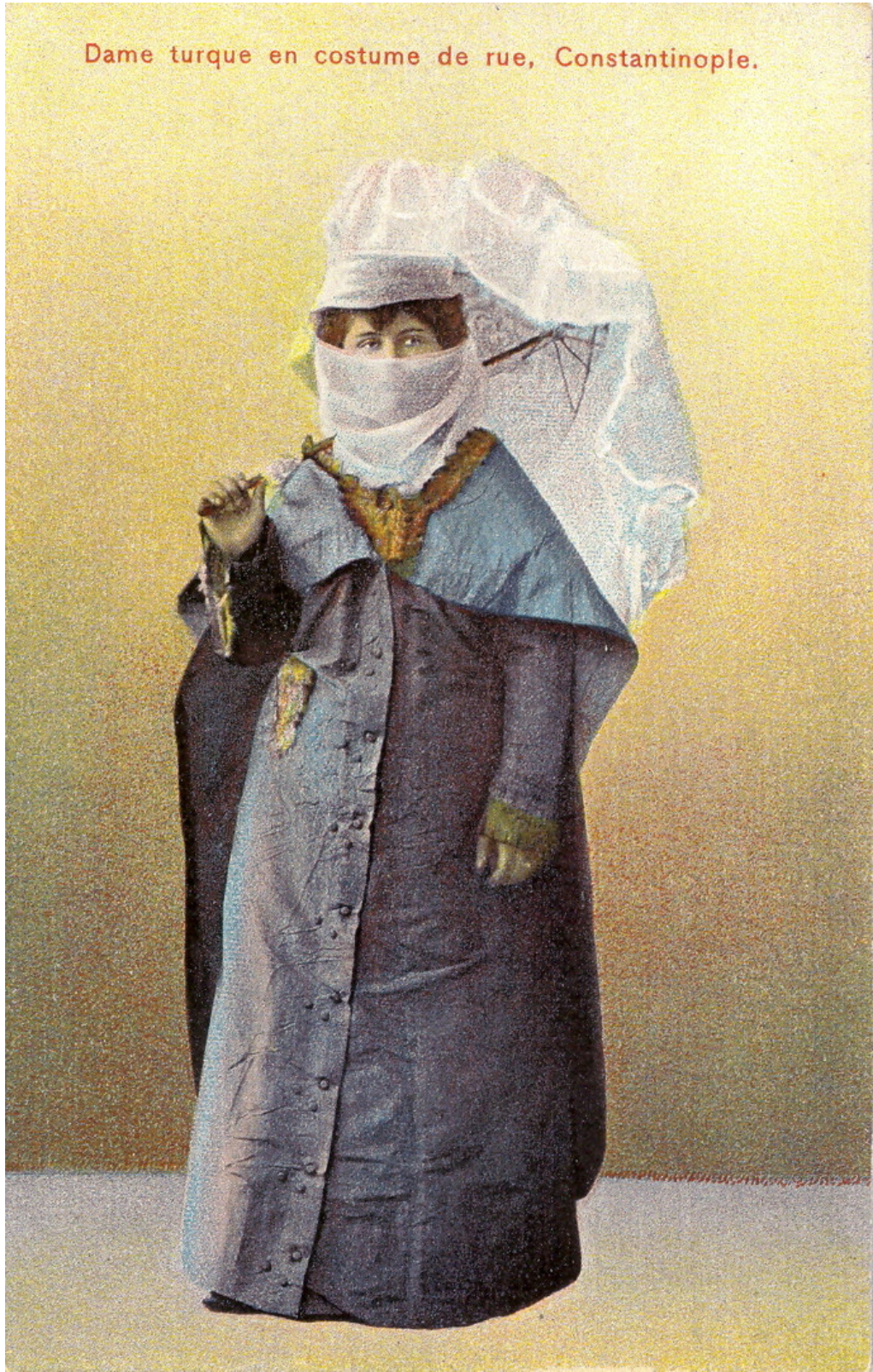
Fig. 2. An Ottoman lady in ferace and yaşmak , from the postcard collection of Yavuz Selim Karakışla.

Dame turque en costume de rue, Constantinople.