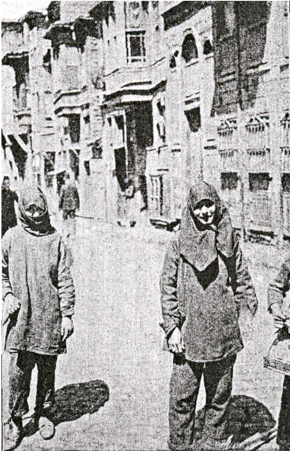
Fig. 10. Turkish women street-sweepers, page 9 of Demetra Vaka, The unveiled ladies of Stamboul (Boston : Houghton Mifflin, 1923).