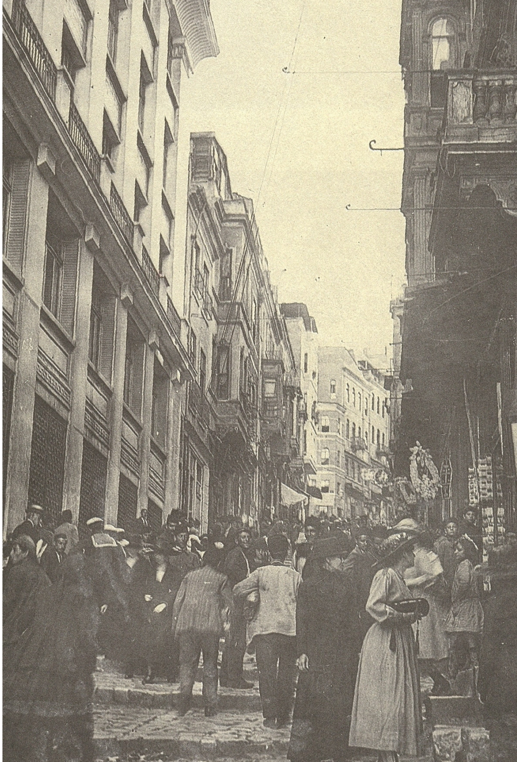
Fig. 6. On the steps leading to Galata, page 45 of İşgal İstanbul'undan fotoğraflar: Fransız Ordusu Sinema-Fotoğraf Servisi (Romeo Marchinez'in arşivinden) İstanbul: Türkiye Ekonomik ve Toplumsal Tarih Vakfı, 1996.