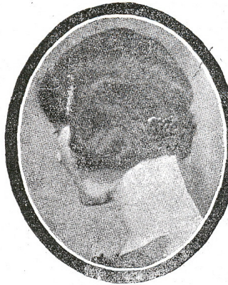
تمام اولسه بر باشک کوسترشی

بر ایکی تجربه دن سوکرا بو توالتی یاغنه، موفق اولورسکنز. توالتک کورونوشی تفوق ماده جاذبدر.