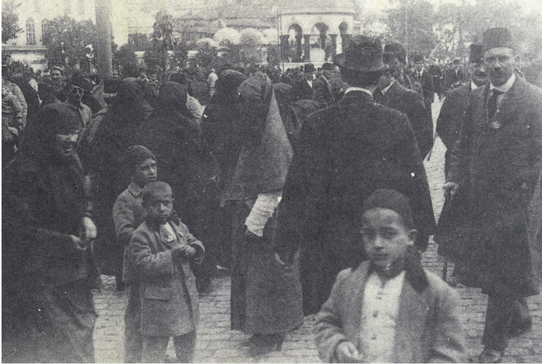
Fig. 5. Turkish women protesting the occupation of Izmir in a demonstration in Sultanahmet in May 1919, page 149 of İşgal İstanbul'undan fotoğraflar: Fransız Ordusu Sinema-Fotoğraf Servisi (Romeo Marchinez'in arşivinden) İstanbul: Türkiye Ekonomik ve Toplumsal Tarih Vakfı, 1996.