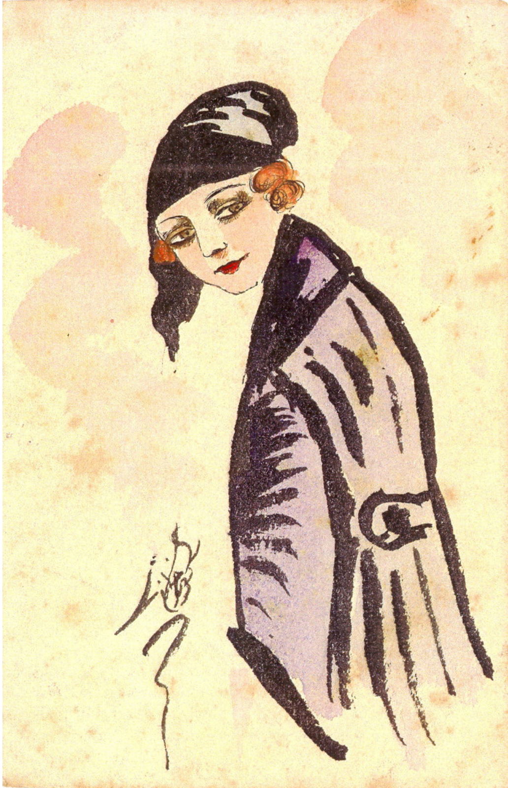
Fig. 14. Illustration of a Turkish woman using “Russian Head” style headgear depicted in a masculine manner, from the postcard collection of Yavuz Selim Karakışla.