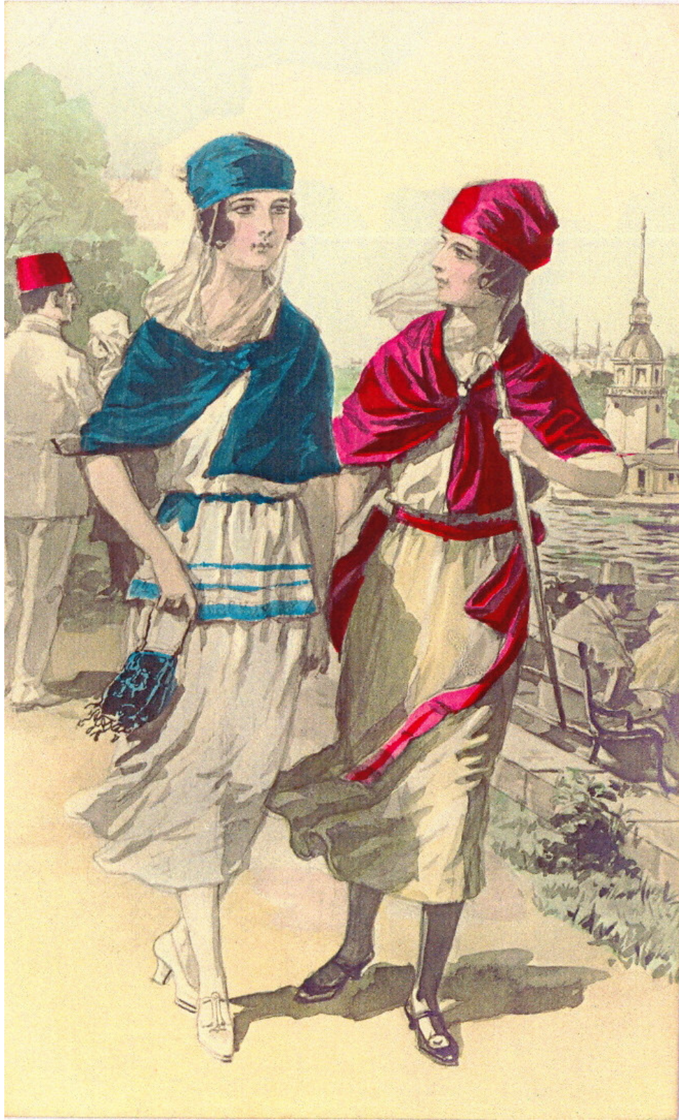
Fig. 17. Illustration of two Turkish young women in Üsküdar.