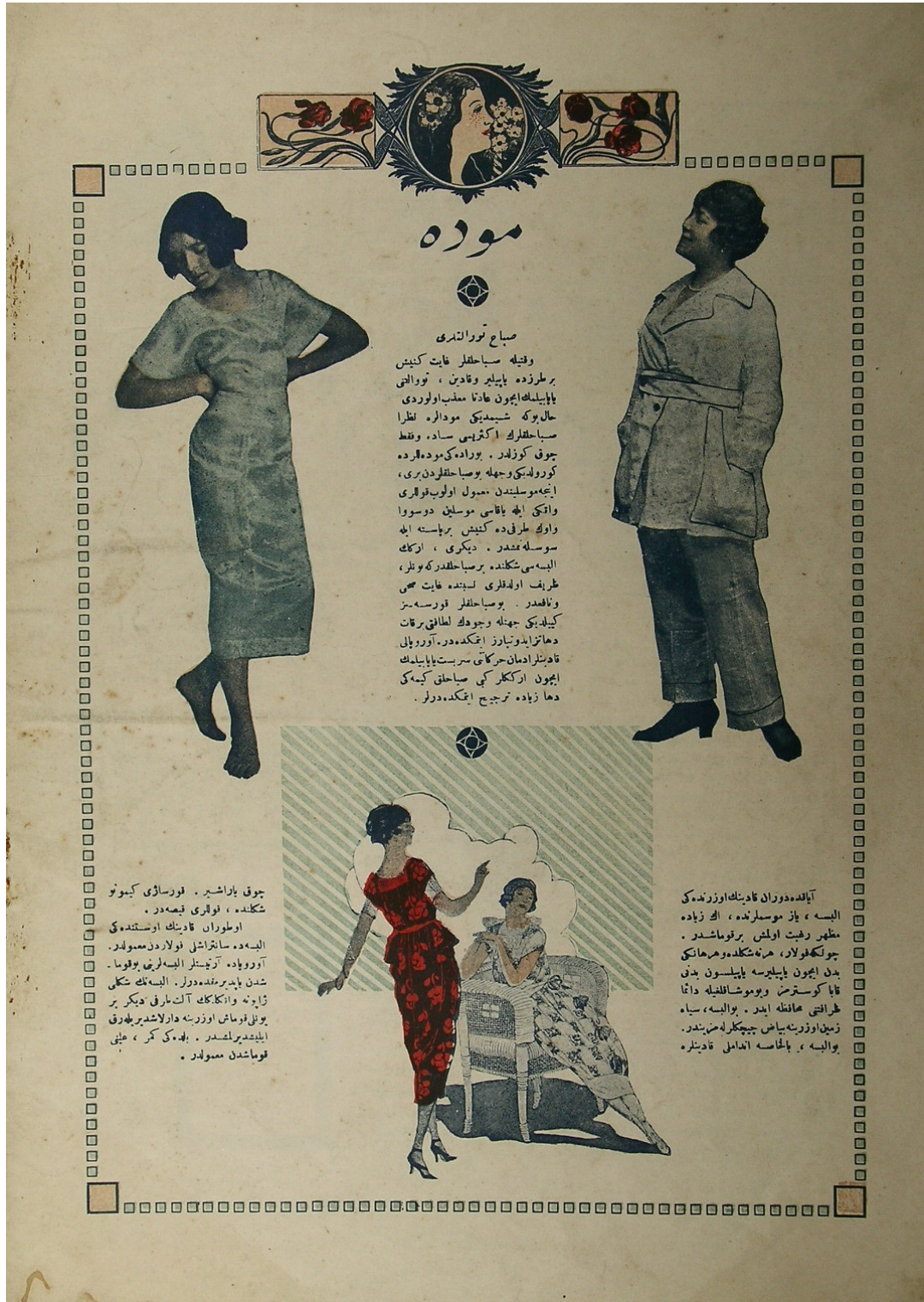
Fig. 11. A pyjama and a nightgown model, back page of Inci , no. 6 (1 July 1919).