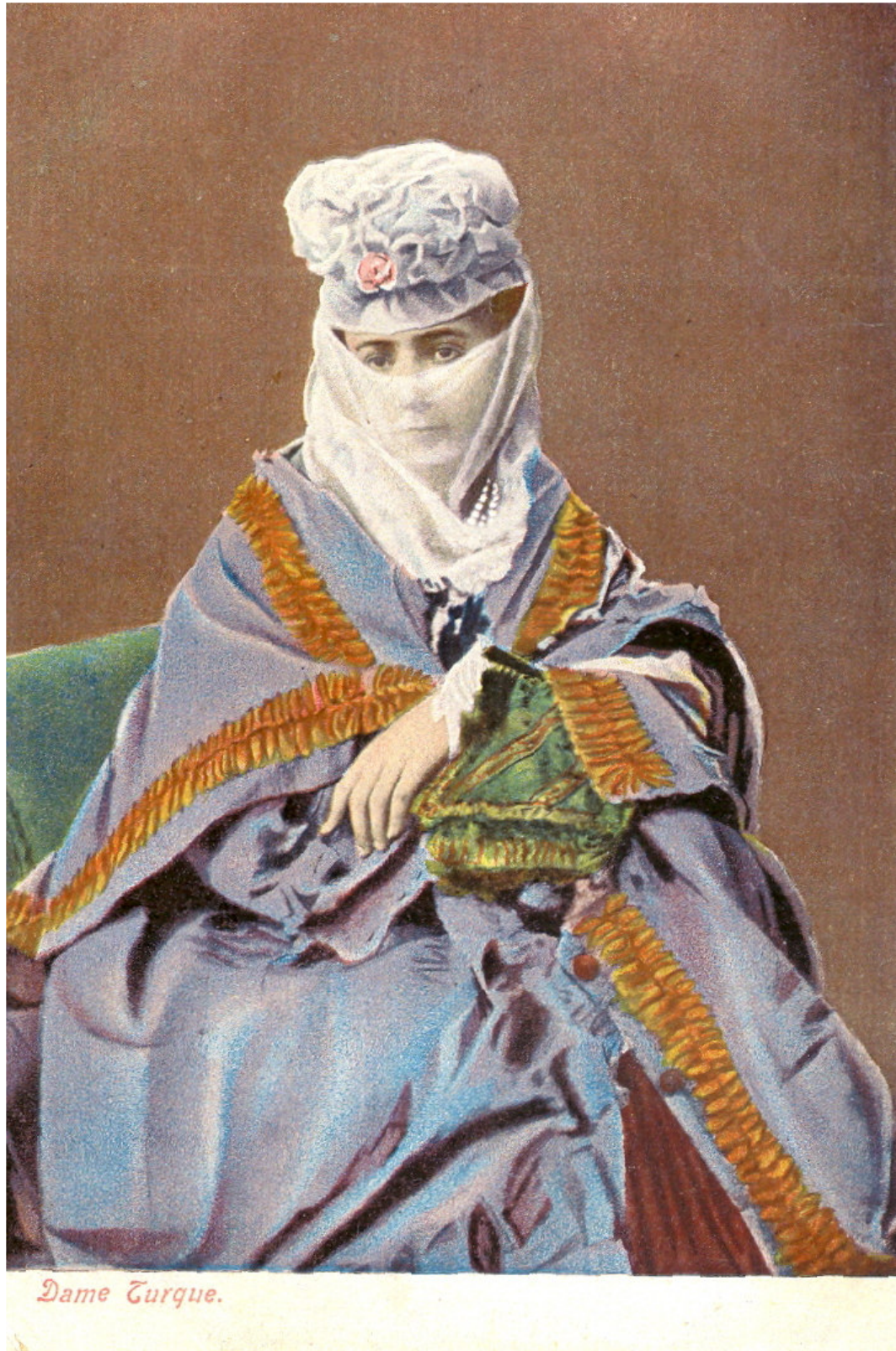
Fig. 1. An Ottoman lady in ferace and yaşmak .