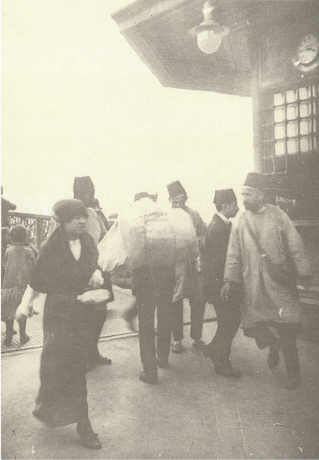
Fig. 23. An unveiled Turkish lady who has tied her headgear in the “Russian Head” style, page 90 of İşgal İstanbul’undan fotoğraflar: Fransız Ordusu Sinema-Fotoğraf Servisi (Romeo Marchinez’in arşivinden) İstanbul: Türkiye Ekonomik ve Toplumsal Tarih Vakfı, 1996.