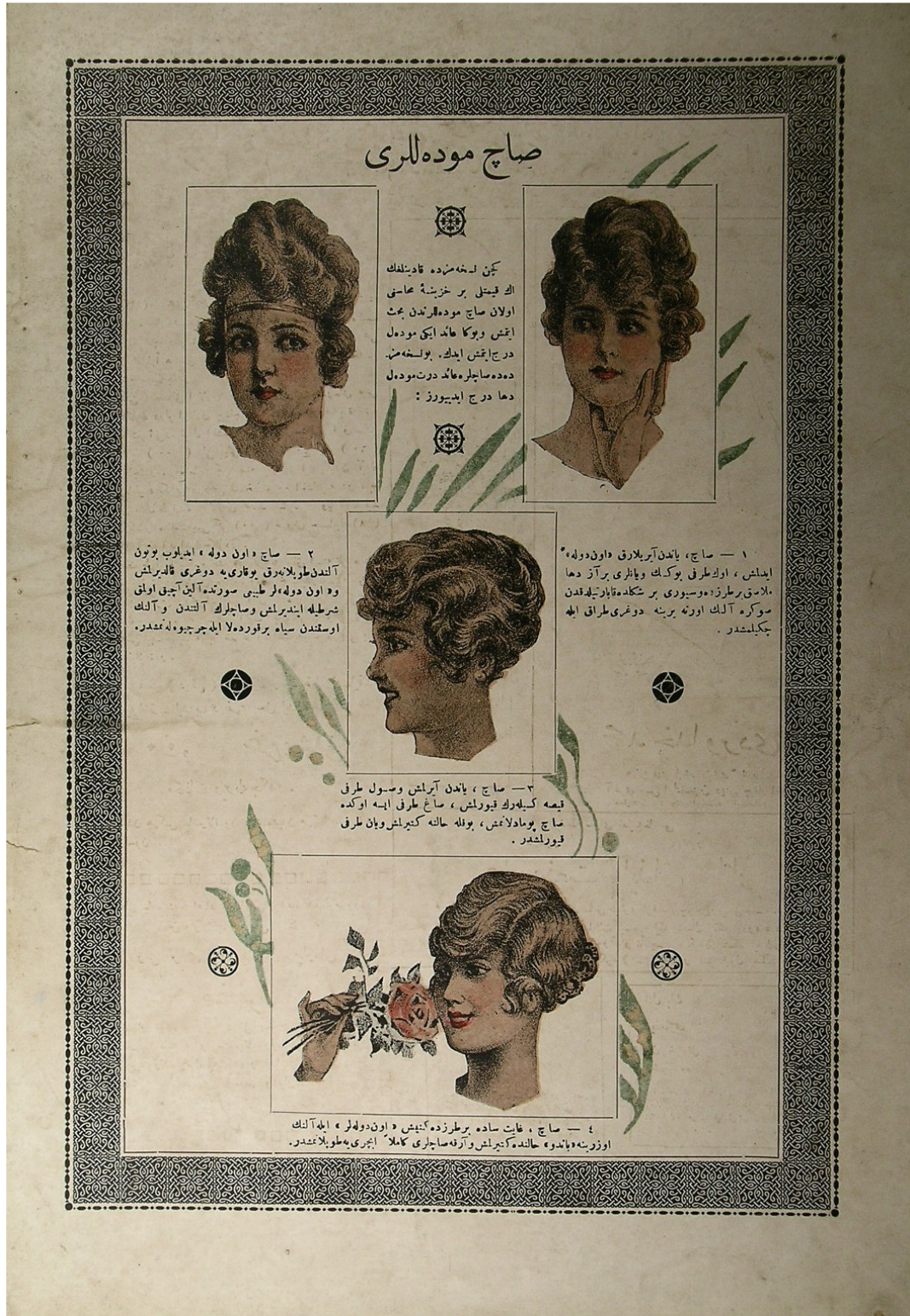
Fig. 12. Short hair models, back page of İnci , no. 8 (1 September 1919).