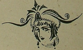
Fig. 8. An article criticizing women's fondness for fur trimmings of monkey tail, page 7 of Yeni İnci, no. 10 (May 1923).

بوکون اورانغ اوتانغ ، غوریل کئی بوکوک و سائر اوقاق تفک مایونلرک قویروفقرینه بیاسه ده وریله ن قیبت اودرجه بی بوشدرکه بو ، حیرتله سزادر . قادیئارده ، بیاسه تک و تجارت اربابنک بو ترغ قومه دیسی نسیتمده ، مایمون قویروغنه مالک اولوق و اوتنکده ایلرینک قوللری و کورکلری سوسله مک خصوصنده اهمیتی بر مودا مجادله سنه آتیمشلردر . شو حالده عقلی مایمونلر بوندن صوکرا پک کوچ قویروفقرینی المزه ویره جکدر . حتی انسانلرک زنده اعتبارلرینک بوردجه آرتدیغندن