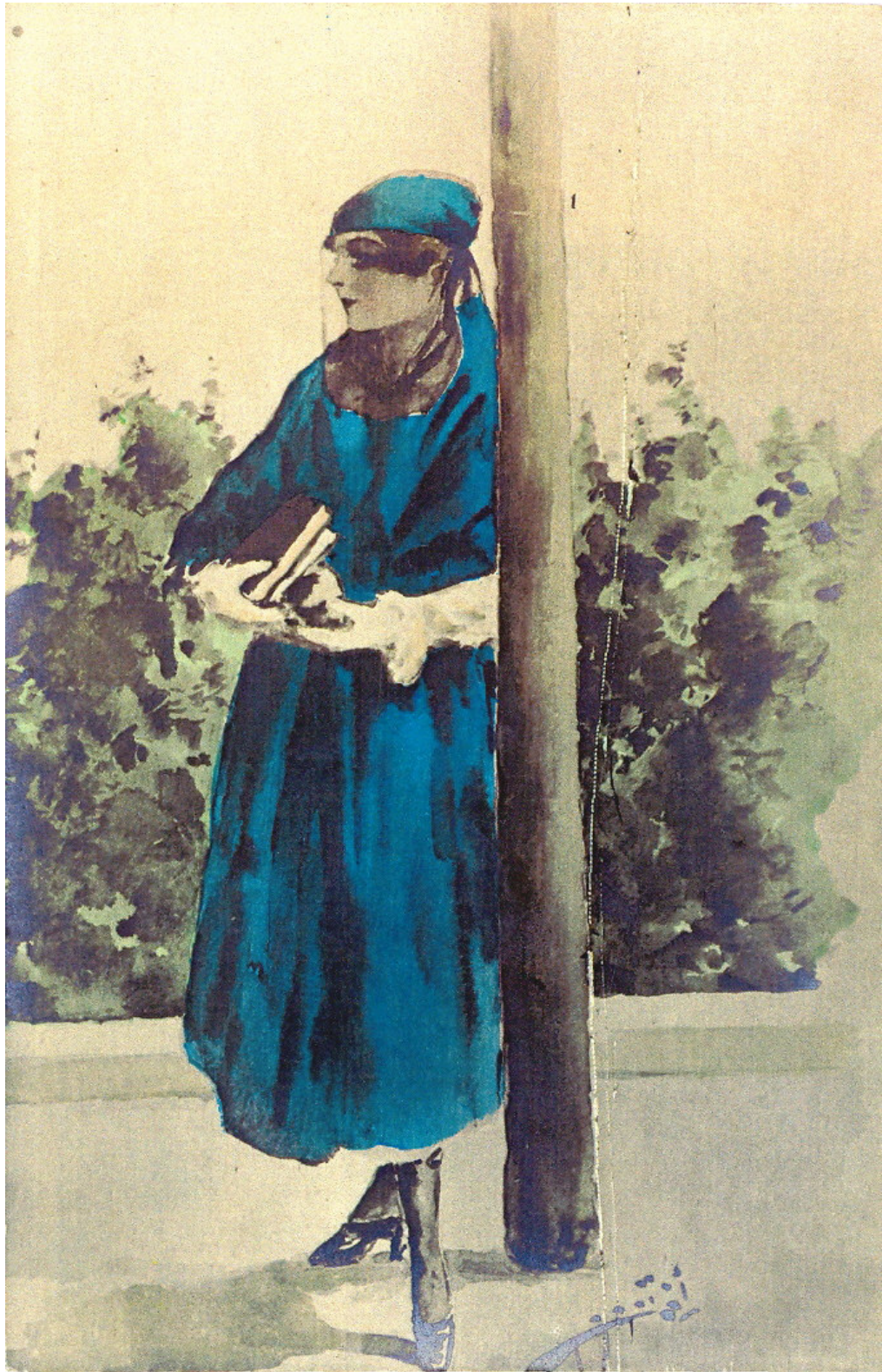
Fig. 15. Illustration of an educated Turkish young woman, from the postcard collection of Yavuz Selim Karakışla.