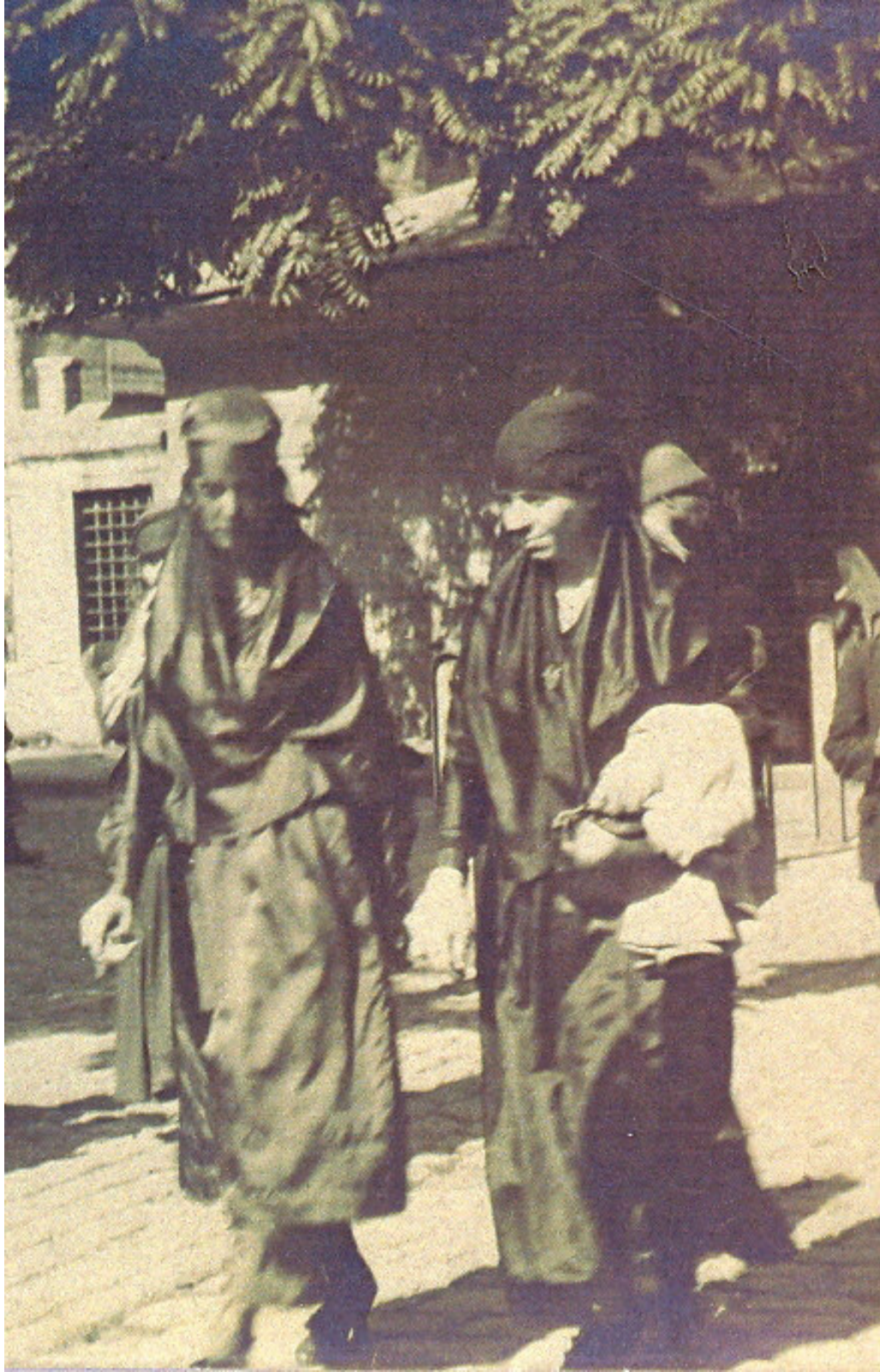
Fig. 4. Turkish women in fashionable çarşaf , from the postcard collection of Yavuz Selim Karakışla.