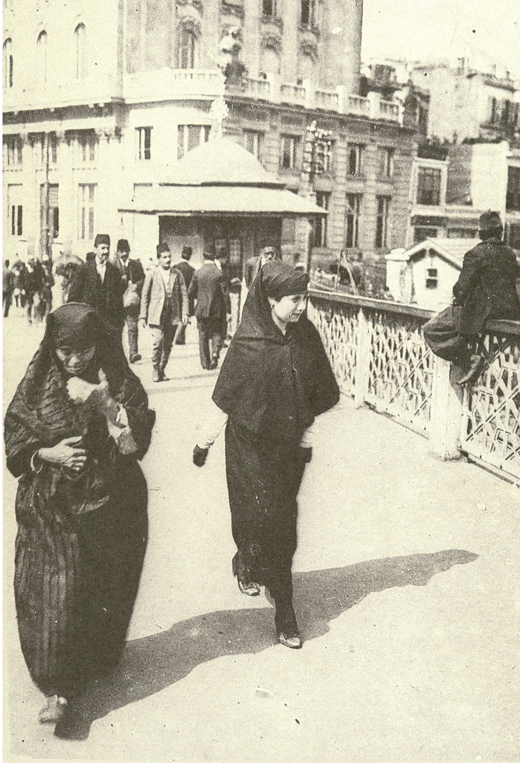
Fig. 18. A lower-class woman in a traditional çarşaf (on the left) and a chic woman in a tighter and fashionable one, both of them unveiled, page 89 of İşgal İstanbul'undan fotoğraflar: Fransız Ordusu Sinema-Fotoğraf Servisi (Romeo Marchinez'in arşivinden) İstanbul: Türkiye Ekonomik ve Toplumsal Tarih Vakfı, 1996.