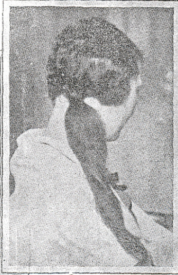
آبریکن صراحی برباغ ایله بربنده باغلامیکن

صاچلری کسلییی، کسه ملییی؟ ایشته بوگون بوتون کنج قیزلری مشغول ایدن اشمهم توالت مسئله سی. قادیئرلر حیاته کیرنجه اوده اوطوروب اوزون اوزادی به توالت یاغنه، باشلری ایچون ساعتلر صرف ایتمکله وقت بولاماز اولدیلر. طفیلی دورک ایجابی اولان اوزون صاچلره، اوزون توالتره بر نهایت ویرمک لازم کلدی. و بو جریان ایلمک دنه ایچوق حیاته کیرمش اولان آمریقان باشلادی. اولا برایکی جسور قیز صاچلری کسدیلر. اونلری دیگرلری تعقیب ایشدی و دیرکن آیی بر باش موده سی میدانه چیقدی. آرقن کنج انتیار هر کس صاچلری کسدیریوردی. فقط هنوز قادیئرلر حیاته کیرمه دیکی جمیترده بو صاچ کسه موده سی