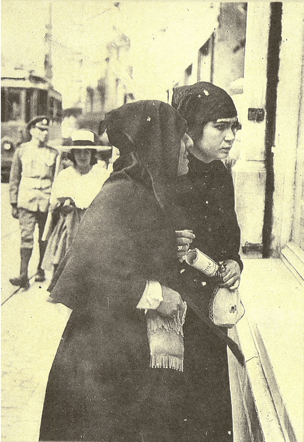
Fig. 21. Two unveiled upper-class Turkish women in front of a jeweler's shop, page 84 of İşgal İstanbul'undan fotoğraflar: Fransız Ordusu Sinema-Fotoğraf Servisi (Romeo Marchinez'in arşivinden) İstanbul: Türkiye Ekonomik ve Toplumsal Tarih Vakfı, 1996.