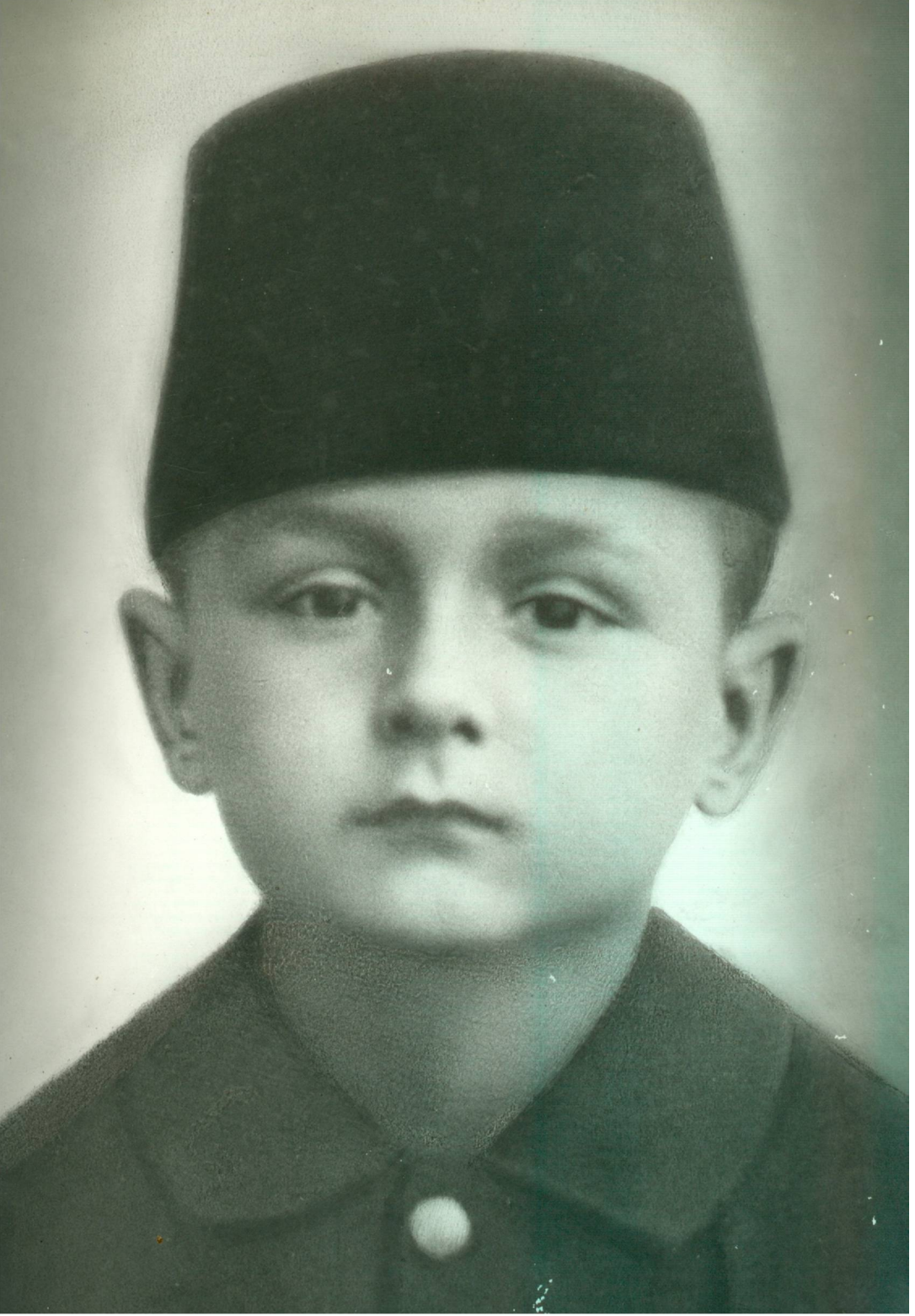
Ek 14- Nihat Erim'in 5 Yaşında İken Çekilmiş Bir Fotoğrafi.