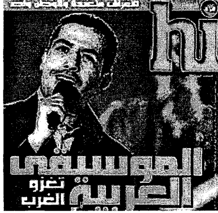
Şekil 3. “hi” Dergisi Kapak