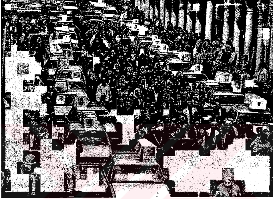
EK 9. Irak yneminin organize ettięi kitlesel bebek cenazeleri treni, Baędat, 1998.