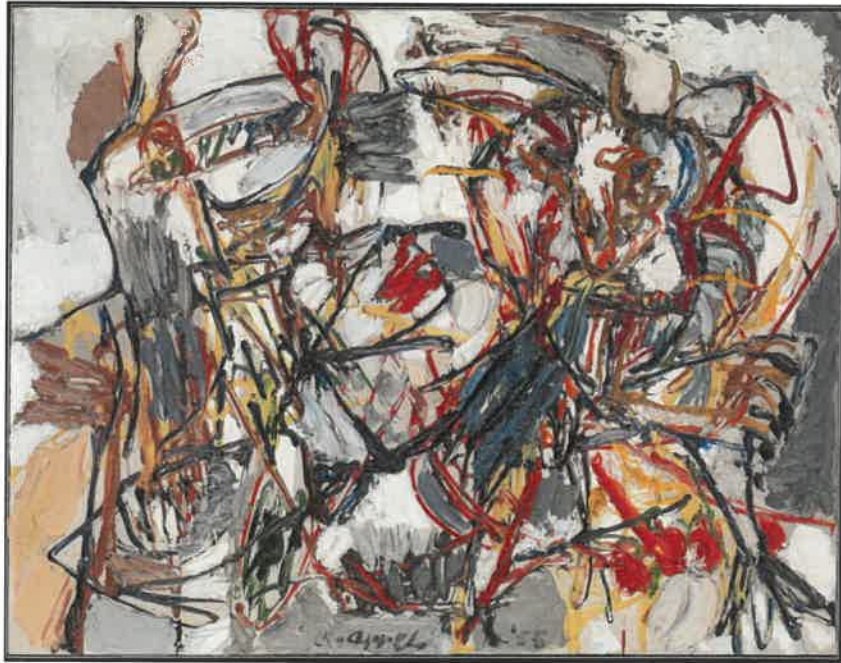
Resim – 29 Karel Apple, Amorous Dance, 1140 x 1460 mm, Tuval üzerine yağlı boya, 1955.