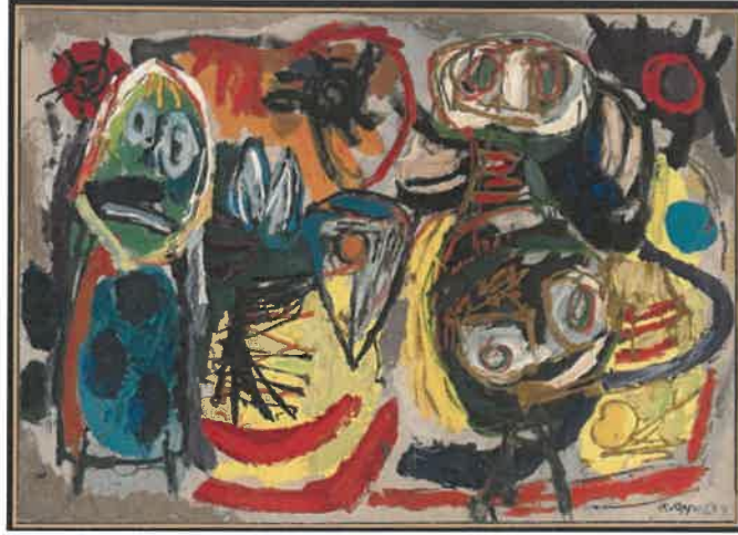
Resim - 30 Karel Apple, İnsanlar, Kuşlar ve Güneş, 1730 x 2428 mm, Tuval üzerine yağlıboya, 1954.