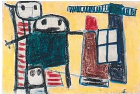
Resim – 22 Karel Apple, Sorgulayan Çocuklar, 20.4 x 30.5 cm, 1948.