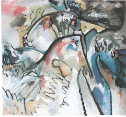
Resim – 3 Wassily Kandinsky, Doğaçlama 21A, 96 x 105 cm, 1911

Kandinsky'nin bu sözleri, incelenen bu eserdeki düşünceyi doğrular niteliktedir. Kandinsky'nin sanatta ruhsallık kitabından edinilen bilgiler doğrultusunda şöyle söylenebilir: Çocukluktan yetişkinliğe geçiş sürecinde yaşadığımız deneyimler ve bu deneyimler sonucu, kavramların, nesnelere beyinde oluşturduğu kalıplar ve semboller Kandinsky'nin sanatındaki çıkış noktasını belirtmektedir.