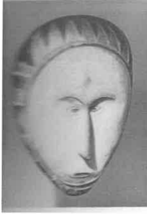
(Lytnton, 2015: 29).