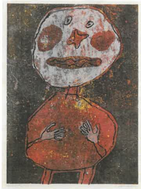
Resim – 25 Jean Dubuffet, Kırmızı Giysili Kişi, 65 x 50, 7 cm, renkli Taşbaskı, 1961.