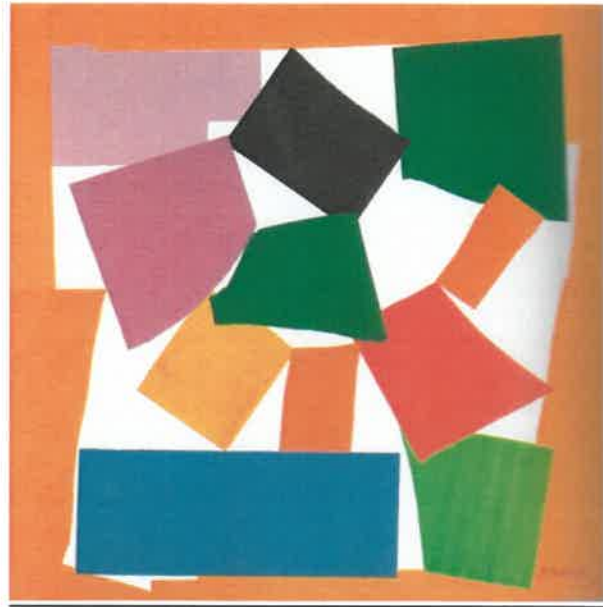
Resim – 9 Henri Matisse, Salyangoz, 185,5 x 287 cm, 1953

Matisse'nin ilkel kabilelere ait heykelleriyle benzerlik gösterdiği düşünen 'Nehirde Yıkanan Kadınlar' eserinden sonra, tıpkı bir çocuk gibi' kesme, yapıştırma' tekniğine benzer ” Salyangoz” eseri de 'Primitifsel' eğilimin başka bir yöndeki örneğini temsil etmektedir.