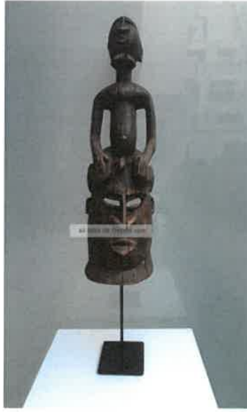
Resim – 8 Kunst Afrika Entstehungszeitnach 1945 Masken.