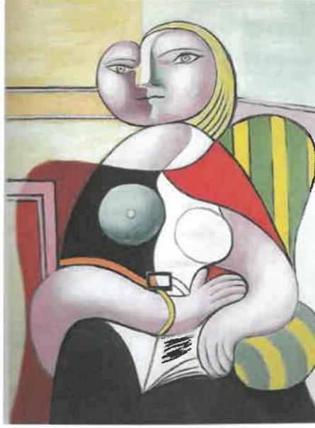
Resim – 12 Pablo Picasso, Okuma, 130 x 97,5 cm, 1932