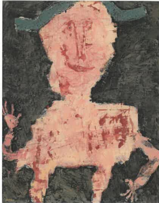
Resim – 27 Jean Dubuffet, Yeşil Şapkalı Adam, 92 x 73, Tuval Üzerine YağlıBoya, 1954.