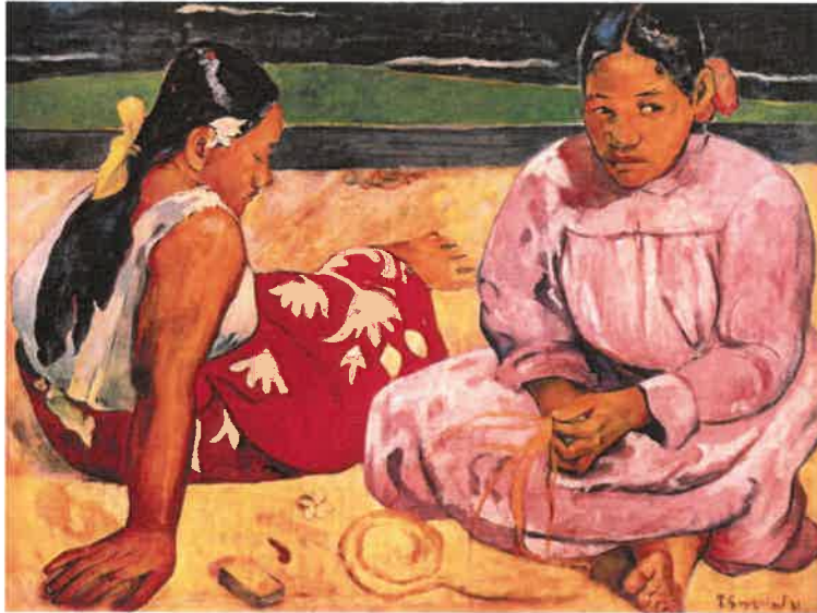
Resim - 4 Paul Gauguin, Tahiti’li Kadınlar, 69 x 92 cm, 1891.

Paul Gauguin’nin ilkel sanat anlayıřını ilk benimseyen sanatçılardan olduđu bilinmektedir. Gauguin, ilkel sanattan etkilenen ve ilkel sanatın modern sanat anlayıřı içindeki oluřumunu sađlayan sanatçılardan olduđu da bilinmektedir. Sanatçının, ilkel sanatın dekoratif anlatımında simgesel ve sembolik ifadeciliken etkilendiđi, eserleri incelendiđinde rahatça görölmektedir. Primitivizme olan eğilim; Paul Gauguin’nin zengin anlatımı, canlı renk kullanımı ve renklerin heyecan vericiliđi, ilkel yařamdaki duyguların egzotik ifadeci yaklařımıyla dikkat çeker iken, Fovistlerdeki canlı renkler, dođadaki gerçekliđin resimde ki (öznel ifadesi), Kübizmin Afrika sanatındaki ilkel keskin imgelerin geometrik soyutlamalarından etkilenmiř olmaları 20. yüzyıl modern sanatında ‘Primitivizm’ eğilimlerin oluřumu açısından önemli bir yer tutmaktadır. Sanatında yeni arayıřlara açık olan sanatçı Paul Gauguin’nin sanatına yeni ifade biçimleri ve teknikler kazandırabilmek adına Tahiti’ye yolculuk yaptıđı ve burada en önemli eserlerini ürettiđi bilinmektedir.