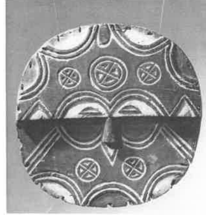
(Lytnton, 2015: 29).

İlk olarak bir önceki (Lytnton'nun Modern Sanatın Öyküsü kitabından) metinden çıkarımla, Vlaminck Paris'e gittiğinde Etnografya ve Arkeoloji müzelerinde görmüş olduğu Afrika kökenli ilkel işleri ve daha sonra sahip olduğu maskeler 'Fov' sanatının diğer üyelerinden Andre Derain'ni etkilediği görülmektedir. Bu durumun da ilkel sanatın Fovist sanatçılar tarafından keşfedilmesini sağladığı da söylenebilir. Fovist sanatçıların akademik kurallara takılmaması giderek büyüyen kendilerine özgü tarzları, aykırı renk anlayışları Afrika sanatının doğal dışavurumcu tavırlarıyla örtüştüğü de görülmektedir. Matisse'nin Fransa'da kurduğu Fovizm akımının öncülerinden olduğunun bilinmesiyle birlikte kısaca Fovizm akımından söz etmek gerekir ise; Fovist sanatçıların renkleri hiç karıştırmadan, ton yaratmadan, sert fırça darbeleriyle tuale uygulamalar yaptıkları oldukları gözlemlenmektedir. Özgürlükçü ve yaratıcı düşünmeyi ilke edinen bu akım, basite indirgedikleri sembolik insan figürleri ve manzara resimlerinin ilk kez sanatta büyük benzerlik taşıdıkları görülmektedir. Tamamen içgüdüsel ve ifadeci tavırları olan Fovist sanatçıların, Matisse'nin ilkel sanatı keşfetmesi ile birlikte ilkel sanatı bütün inceliklerini çalışmalarına aktardıkları da görülmektedir.