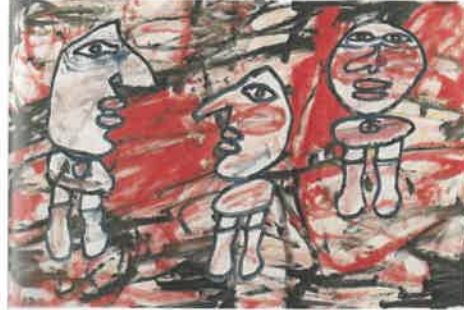
Resim – 21 Jean Dubuffet, Üç Kişili Görünüm (F104), 67 x 100 cm, Bez Kaplama Üstüne Akrilik, 1982.