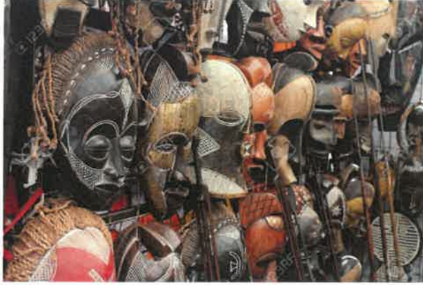
Resim - 2 Viele afrikanische Masken