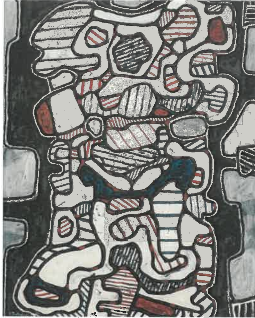
Resim – 26 Jean Dubuffet, Musluğun Efsanevi Şifresi, 100 x 81 cm, Tuval Üstüne Vinil, 1965.