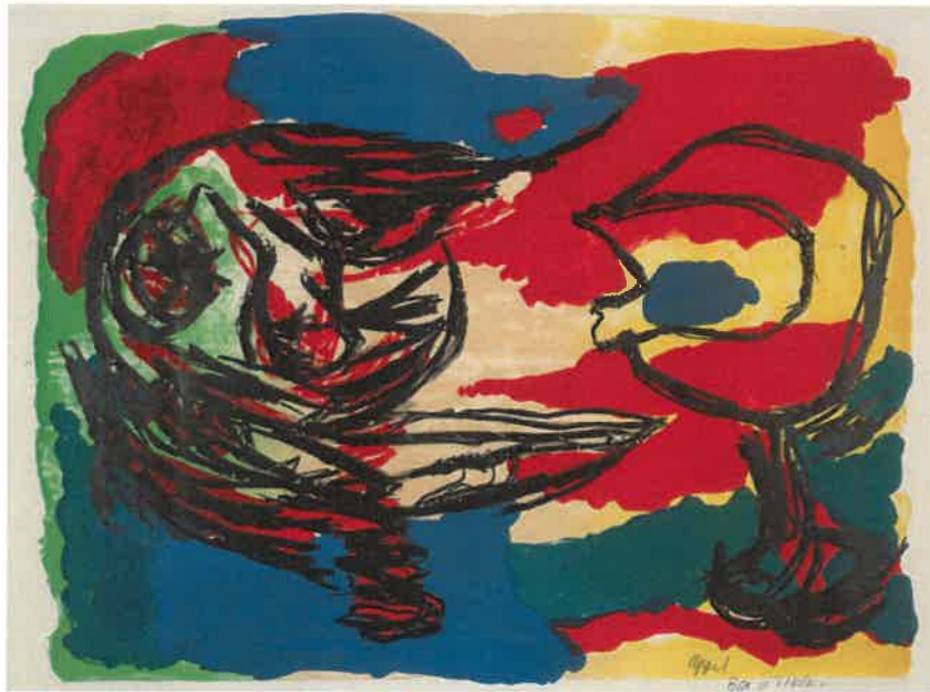
Resim - 31 Karel Apple, Renkli Manzara Alanında Başlar, 75 x 762 mm, Kağıt Üzerine Litografi, 1965.