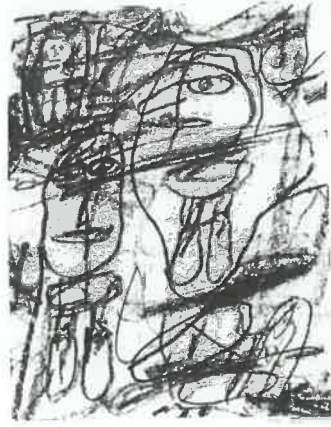
Resim – 20 Jean Dubuffet, Kalem Akar, 28,5 x 38 cm, Siyah Taşbaskı, 1982.