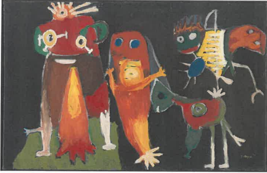
Resim - 28 Karel Apple, Kalça, Kalça, Hoorah!, 817 x 1270 mm, Tuval üzerine yağlı boya, 1949.