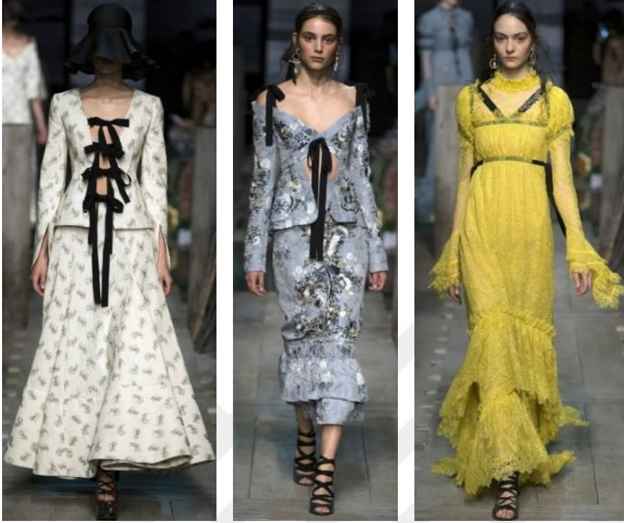
Şekil 25. Erdem Moraloğlu İlkbahar – Yaz Koleksiyonu 2017