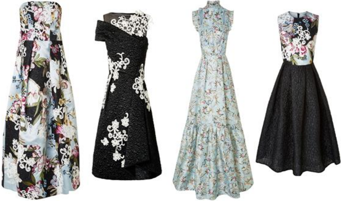
Şekil 29. Erdem Moralıođlu Net-A-Porter Koleksiyonu 2015