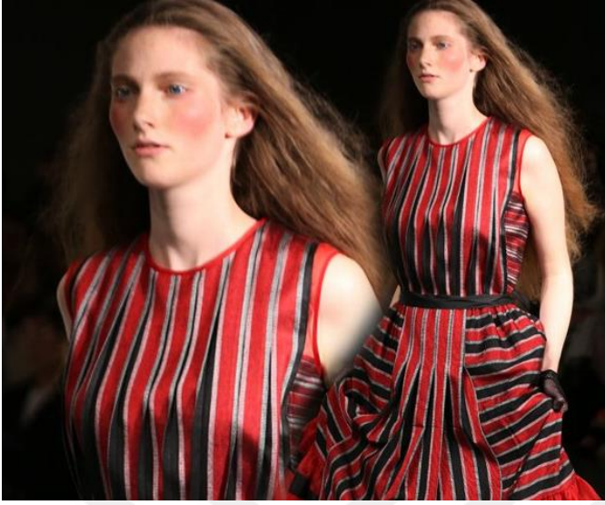
Şekil 35. İlkbahar-Yaz Koleksiyonu 2018