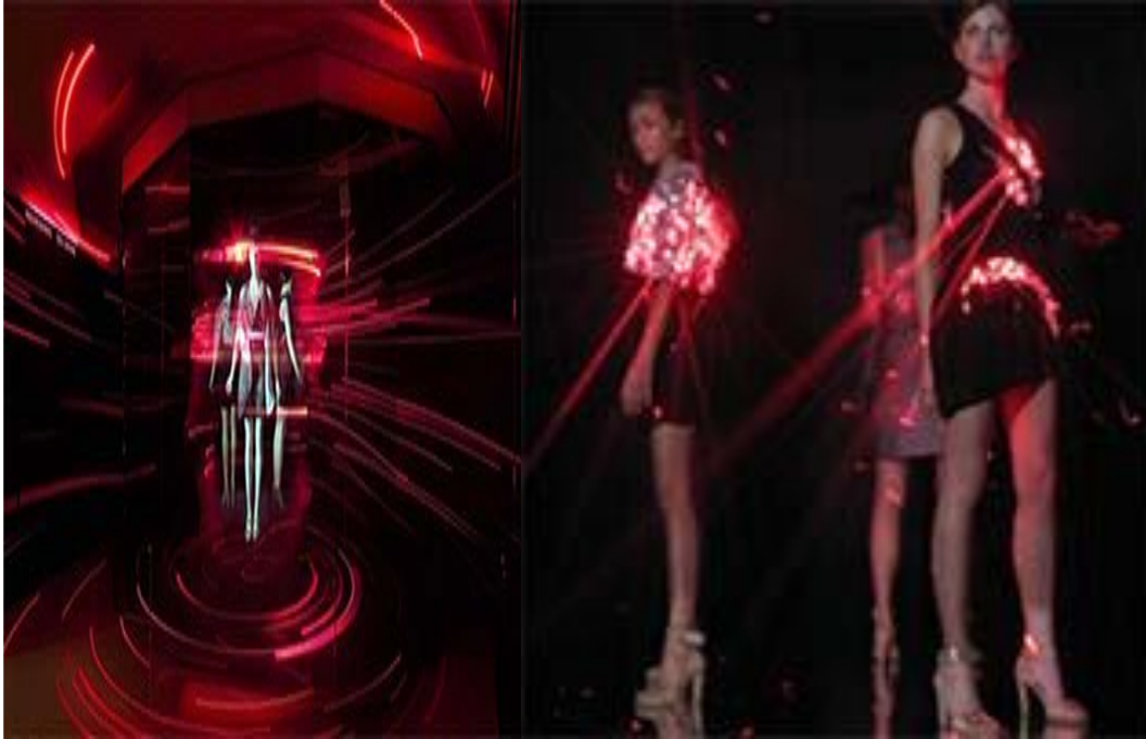
Şekil 14. Readings (Okumalar) İlkbahar - Yaz Koleksiyonu 2008