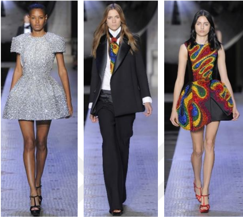
Şekil 20. Nocturne 54 Sonbahar - Kış Koleksiyonu 2015-2016