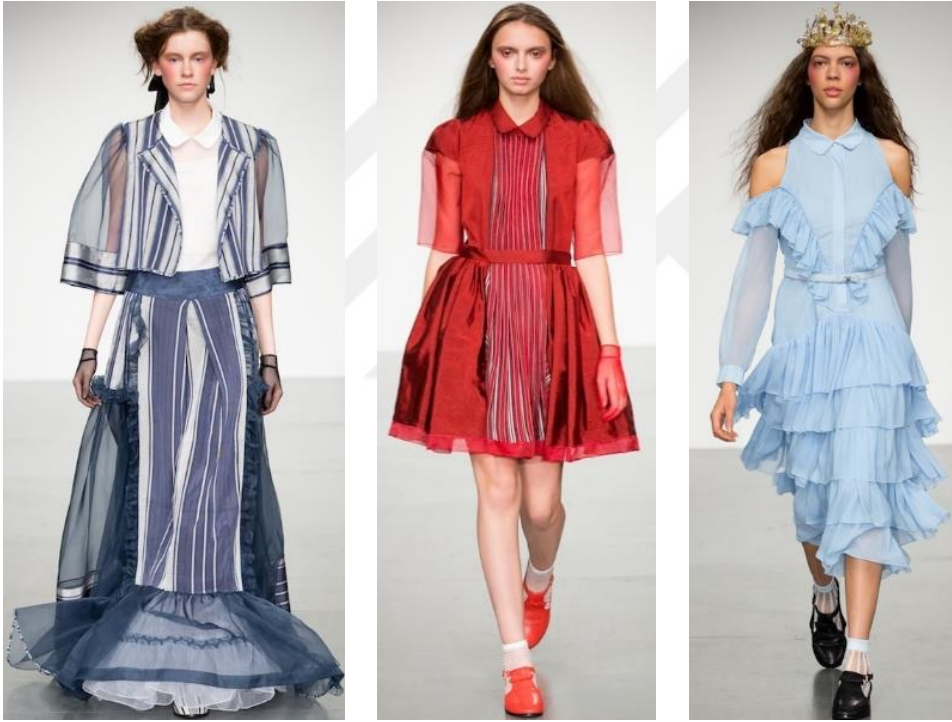
Şekil 34. İlkbahar-Yaz Koleksiyonu 2018

yaşatmaktadır. Geleneksel, modern ve sofistike feminenliği nakışlarda ve baskılı elbiselerde yansıtan bu koleksiyonun genel silüeti zenginlik ve feminenlik üzerinedir. Bora'nın anneannesinin gardrobundaki el dikişi elbiseler ve onların detayları koleksiyonun genel detayları için esin kaynağı oluşturmaktadır. Pileler, büzgüler ve nakışlar bu detaylardan bazıları. Kısa ceketler, drapaj gömlekler bu romantik nostalji koleksiyona ayrı bir boyut eklemektedir (a.g.e).