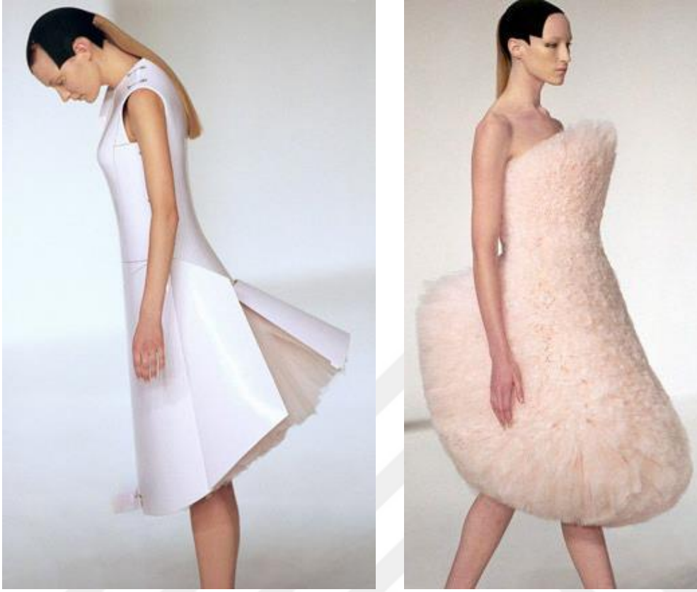
Şekil 9. Before Minus Now (Önce Eksi Şimdi) İlkbahar- Yaz Koleksiyonu 2000