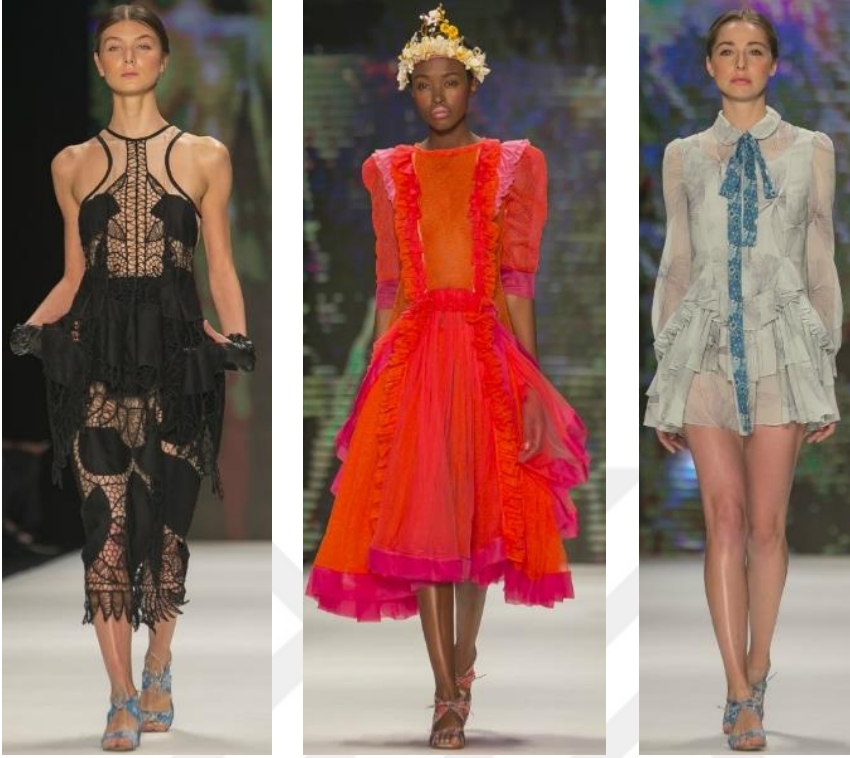
Şekil 33. Mercedes-Benz İstanbul Fashion Week - 2017 İlkbahar