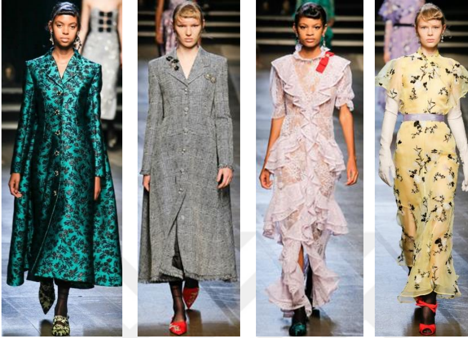
Şekil 27. Erdem Moraloğlu İlkbahar – Yaz Koleksiyonu 2018