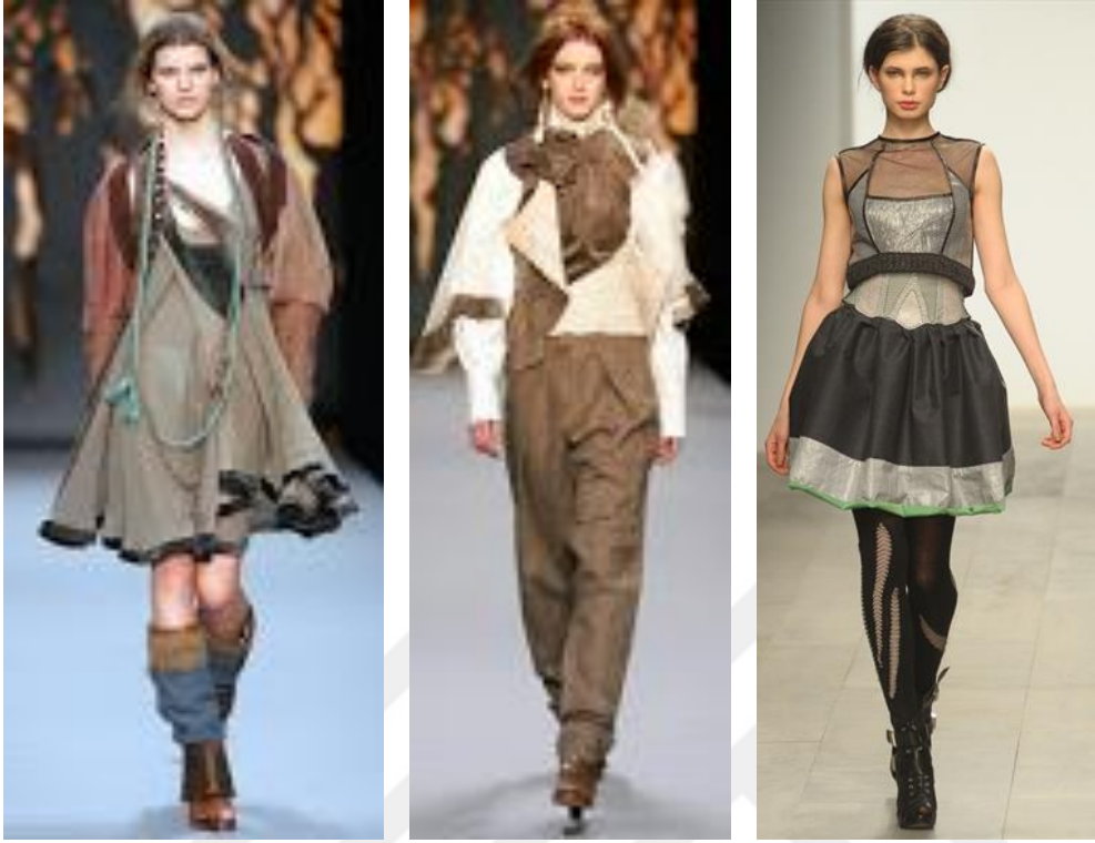
Şekil 36. Sonbahar – Kış Koleksiyonu 2006-2007