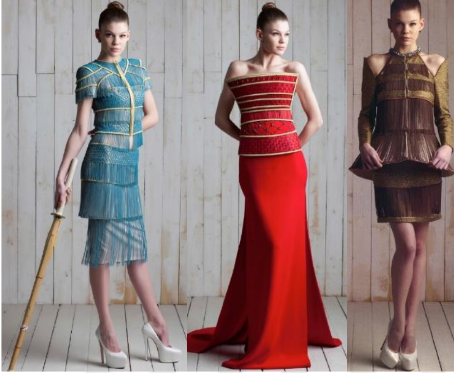
Şekil 30. İlkbahar - Yaz Koleksiyonu “Beginning” 2015