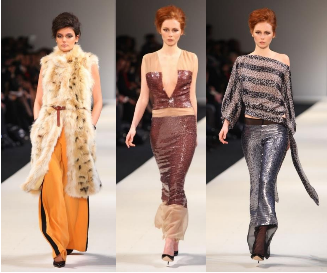
Şekil 4. Sonbahar - Kış Koleksiyonu 2011-2012