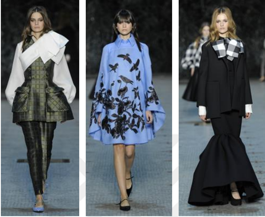
Şekil 18. Woven Tales (Dokuma Masallar) İlkbahar - Yaz Koleksiyonu 2016