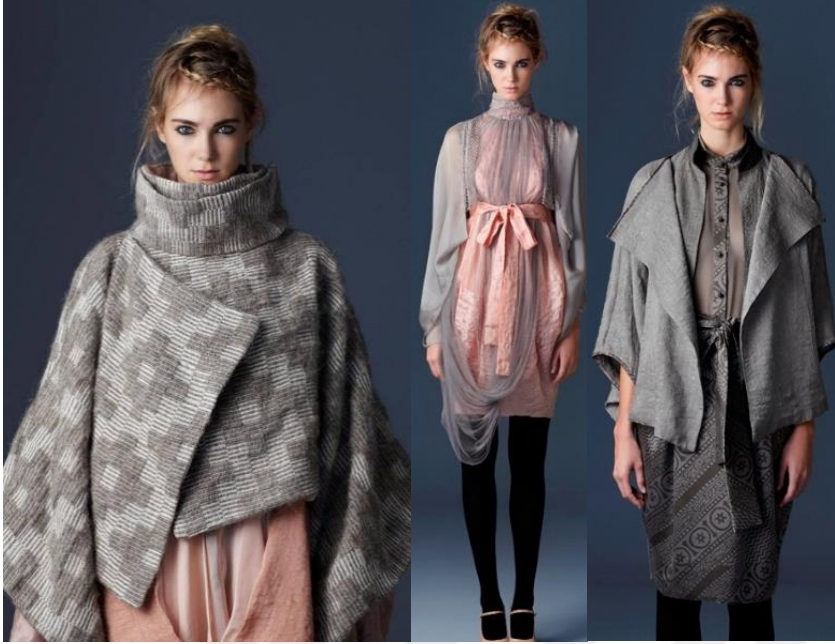
Şekil 38. ARMAGGAN 2011