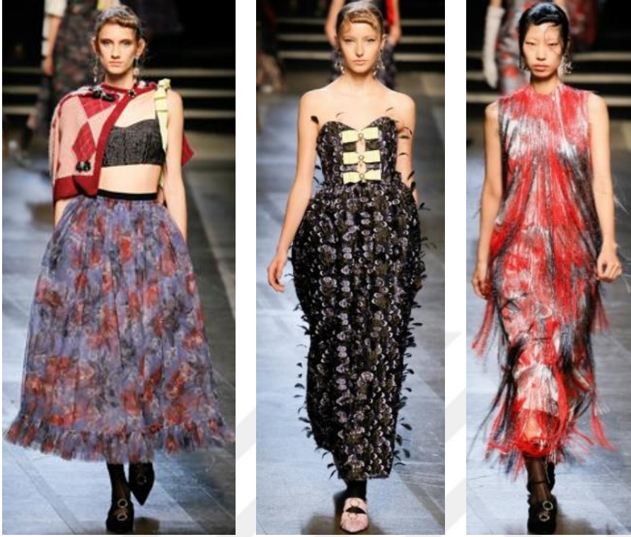
Şekil 26. Erdem Moraloğlu İlkbahar – Yaz Koleksiyonu 2018