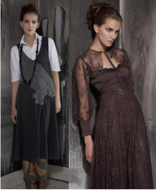
Şekil 37. KOTON Kış Koleksiyonu 2006-2007