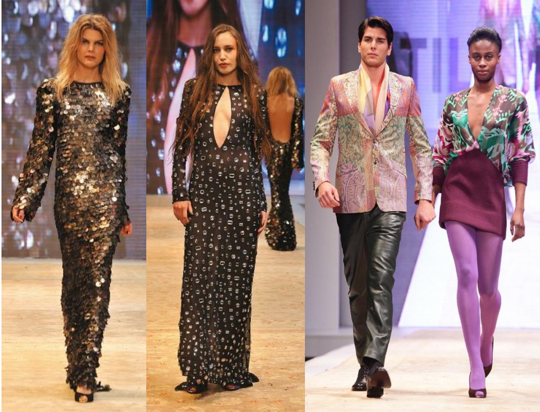
Şekil 5. Sonbahar- Kış Koleksiyonu 2012-2013

Kaynak: http://www.atilkutoglu.com , 2018.