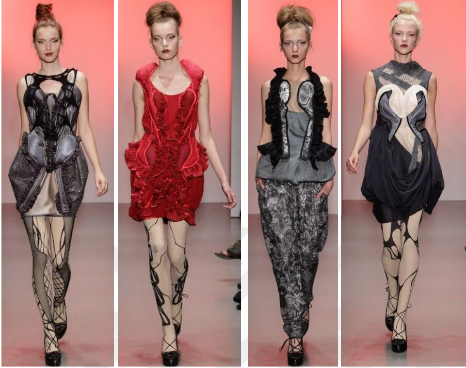
Şekil 40. Karıncalar ve Korseler İlkbahar - Yaz 2011