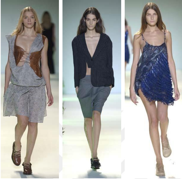
Şekil 13. Blindscape (Körmanzara) İlkbahar – Yaz 2005