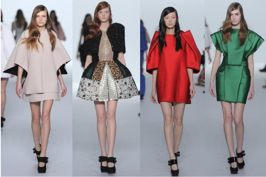
Şekil 17. Dollhouse (Bebekevi) İlkbahar – Yaz Koleksiyonu 2015