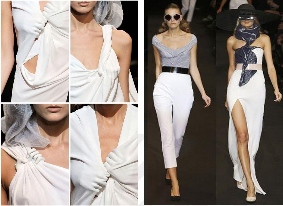
Şekil 16. Dolce Far Niente (Tatlı Aylaklık) İlkbahar - Yaz Koleksiyonu 2010