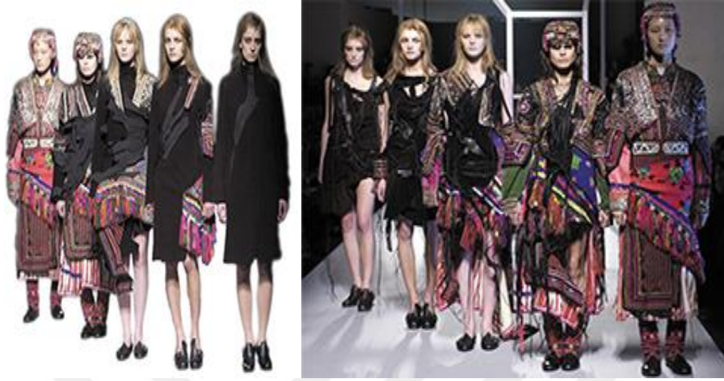
Şekil 10. Ambimorphous (Ambimorfik) Sonbahar- Kış Koleksiyonu 2002

Kaynak: hussein chalayan 1994 – 2010, İstanbul Modern Sanat Müzesi, 2010, s 43.