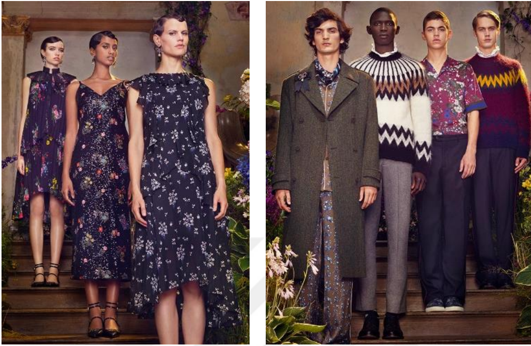
Şekil 23. Erdem x H&M Sonbahar – Kış Koleksiyonu 2017-2018