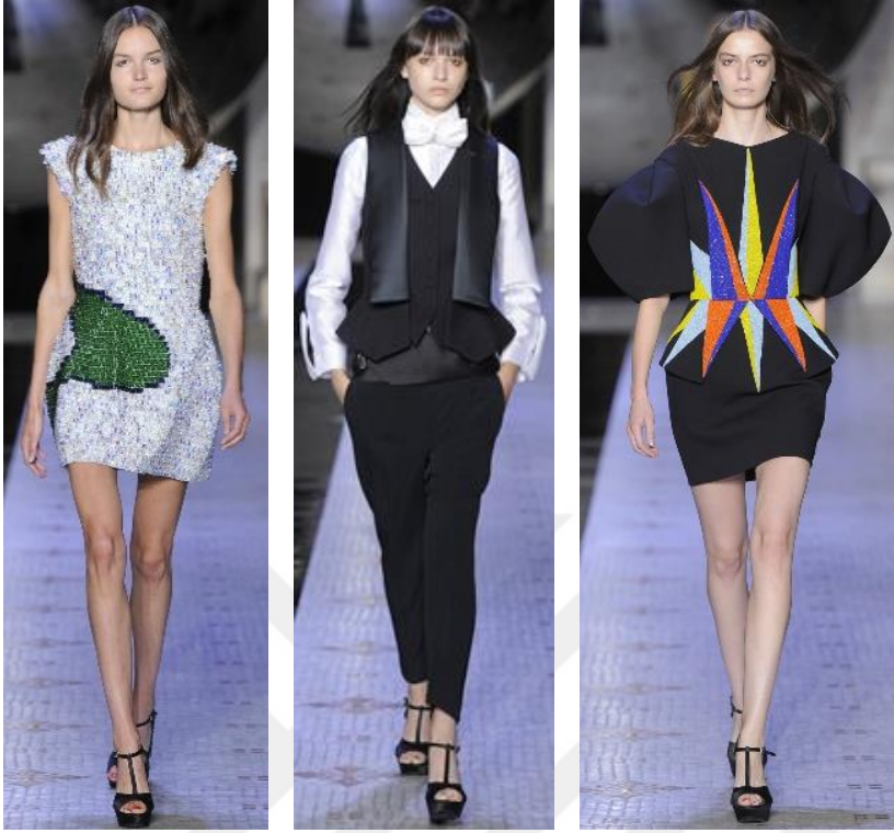
Şekil 21. Nocturne 54 Sonbahar – Kış Koleksiyonu 2015-2016