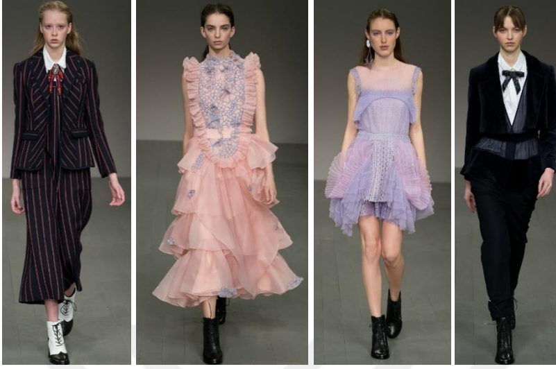
Şekil 39. Sonbahar – Kış Koleksiyonu 2018-2019