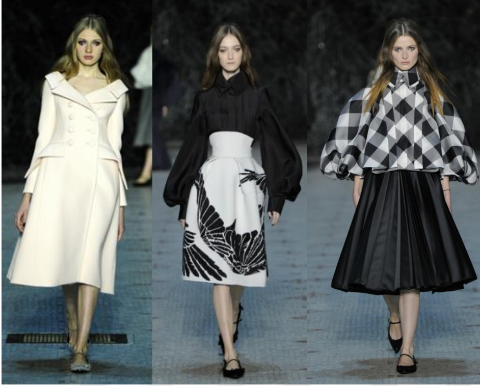
Şekil 19. Woven Tales İlkbahar - Yaz Koleksiyonu 2016