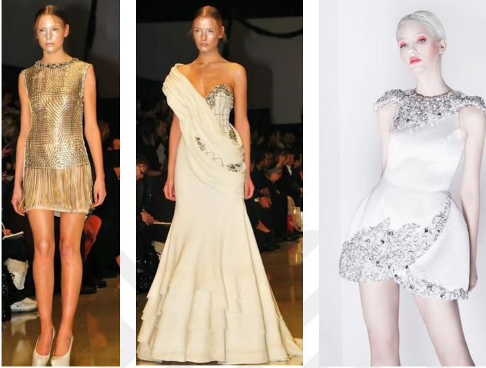
Şekil 32. Deepwaves (Derin Dalgalar) Yaz Haute Couture 2014