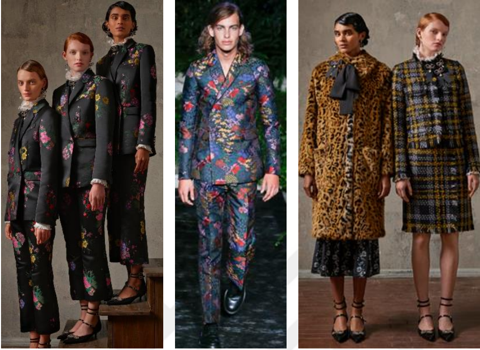
Şekil 24. Erdem x H&M Sonbahar – Kış 2017-2018