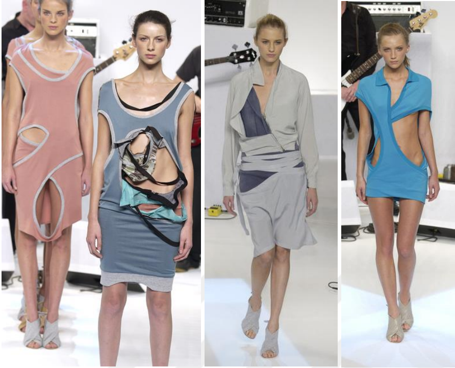
Şekil 11. Manifest Destiny (Kaderin Tecellisi) İlkbahar- Yaz Koleksiyonu 2003

Kaynak: hussein chalayan 1994 – 2010, İstanbul Modern Sanat Müzesi, 2010, s 53.