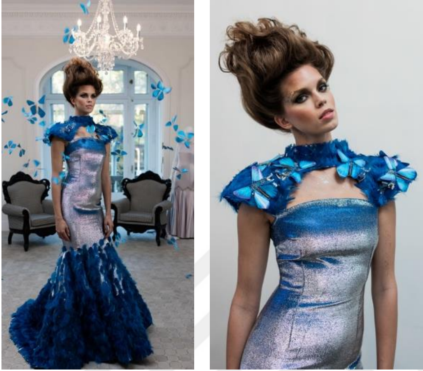
Şekil 31. Butterfly Dress 2016