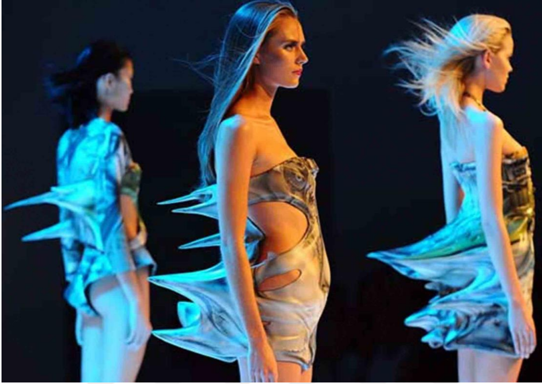
Şekil 15. Inertia ( Hareketsizlik) İlkbahar - Yaz Koleksiyonu 2009