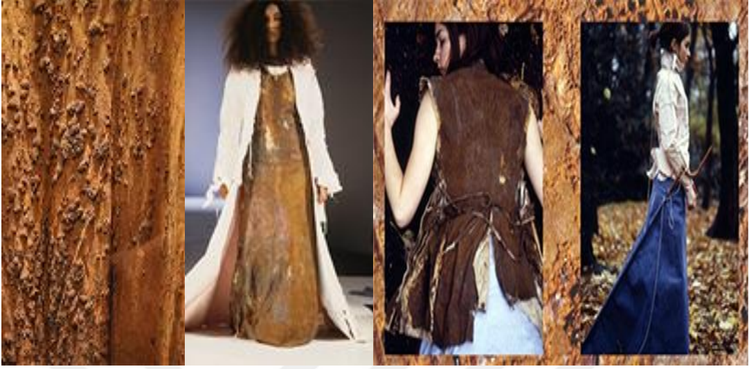
Şekil 7. The Tangent Flows 1993-1994

Kaynak: https://cultureofdesign.com , 2010.