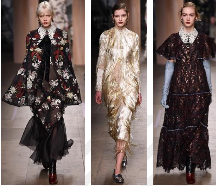
Şekil 22. Erdem Moralıođlu Sonbahar – Kış Koleksiyonu 2016