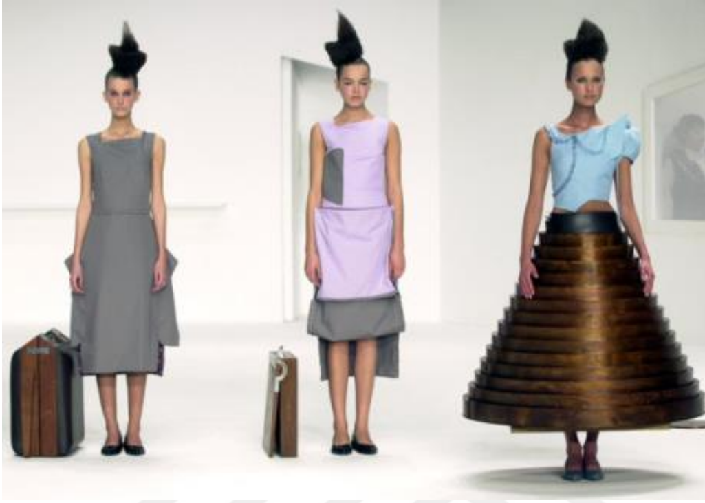
Şekil 8. After Words (Sözlerden Sonra) Sonbahar- Kış Koleksiyonu 2000

Kaynak: hussein chalayan 1994 – 2010, İstanbul Modern Sanat Müzesi, 2010, s 39.