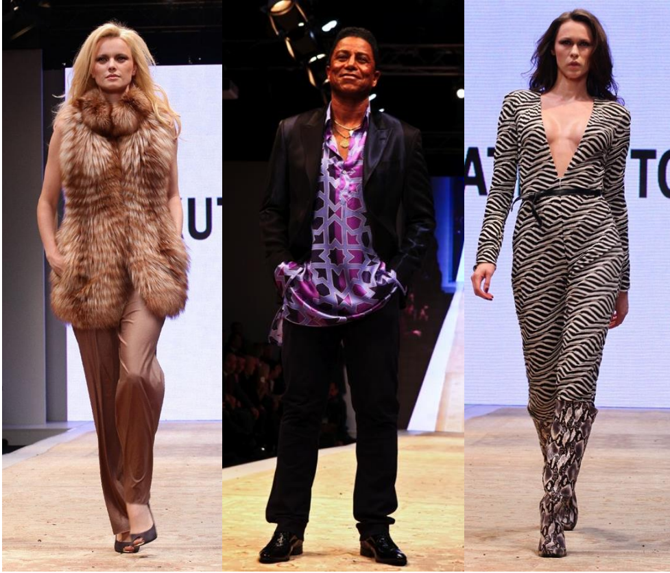
Şekil 6. Sonbahar- Kış Koleksiyonu 2012-2013