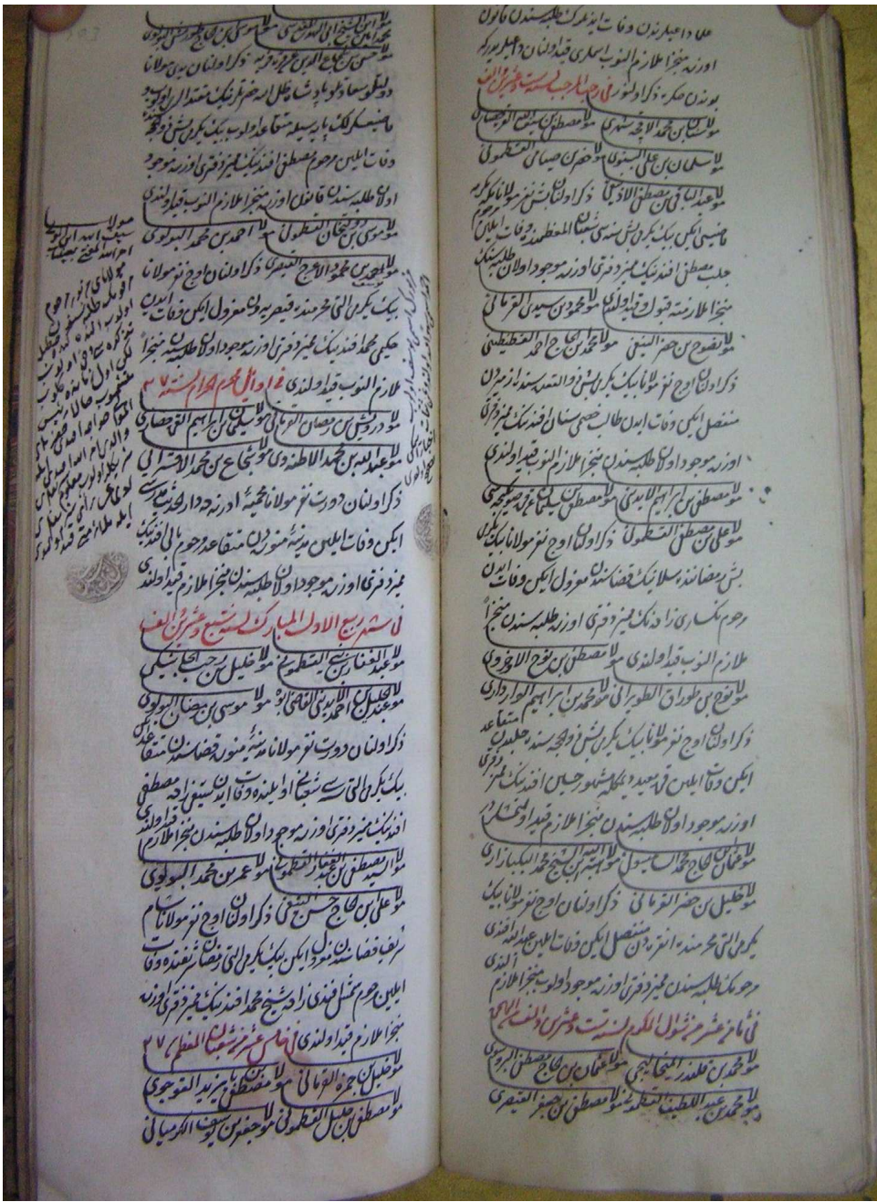
s. 102, 103