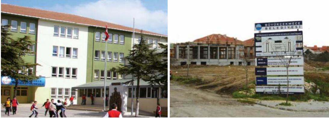
Şekil 7: Büyükçekmece Belediyesi Katkılarıyla Yapılan Okullardan Örnekler

Arsası belediyece tahsis edilen, 50 derslikli yemekhane ve spor salonuna sahip Recep Güngör Lisesi 6 Aralık 2006 tarihinde, yeniden yapılmak üzere belediyece yıkılan ve yapımı Akçansa Çimento A.Ş tarafından üstlenilen 50 derslikli kapalı spor salonu, tiyatro salonu ve yemekhanesi bulunan Fatih Sultan Mehmet Akçansa İlköğretim Okulu 18 Eylül 2006 tarihinde, Belediye tarafından arsası tahsis edilen, 2 kat 24 derslikli, kapalı spor salonu bulunan Halime Bulduk İlköğretim Okulu ise yine 2006-2007 eğitim öğretim yılında hizmete açılmışlardır. 150