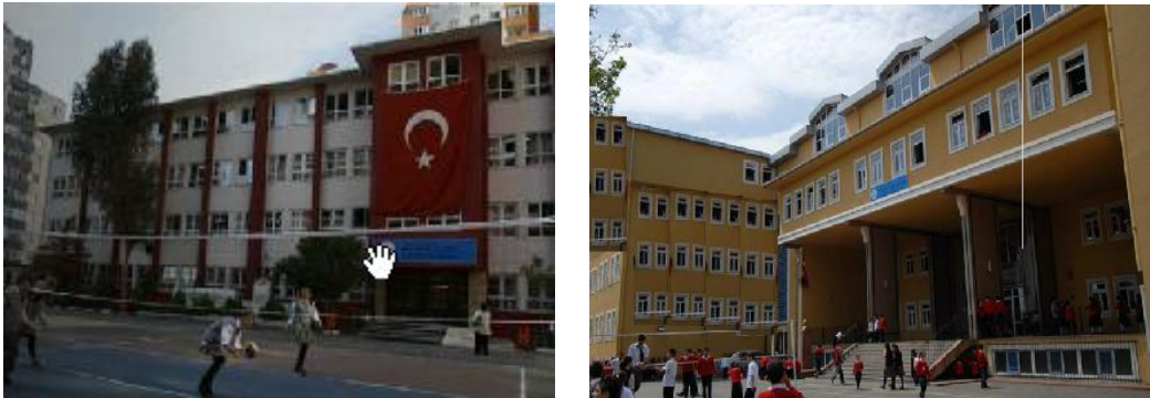
Şekil 2: İSMEP Projesi İle Yeniden İnşa Edilen Okul Binaları

Proje kapsamındaki faaliyetlerin gerçekleştirilmesi ve denetimi sağlanması amacıyla, İstanbul İl Özel İdaresi bünyesinde, İstanbul Proje Koordinasyon Birimi (İPKB) kurulmuştur. Proje kapsamında yapılan güçlendirme, yeniden inşa vb. çalışmalar aşağıda tablo 15'de gösterilmektedir.