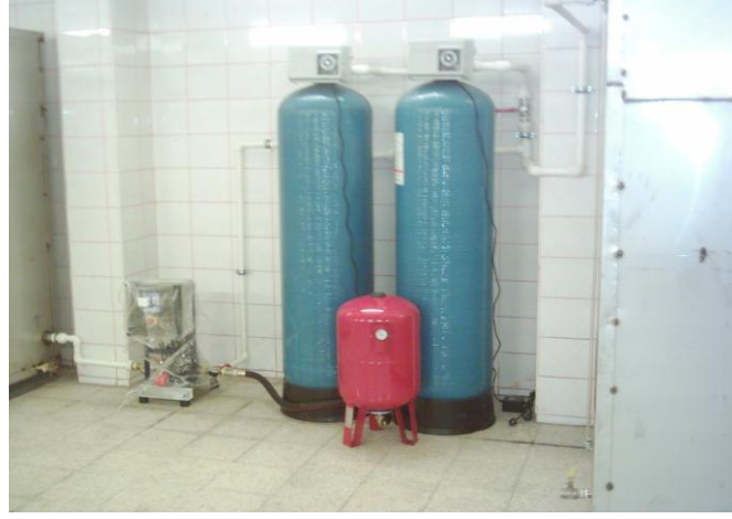
Şekil 6: Bakırköy Belediyesi Tarafından Okullara Kurulan Su artıma Sistemleri

yılında 86.256 YL 126 ve 2009 yılında 110.044 TL 127 olmak üzere, 5 yılda toplam 376.102 TL harcama yapmıştır. (bkz. tablo 23)