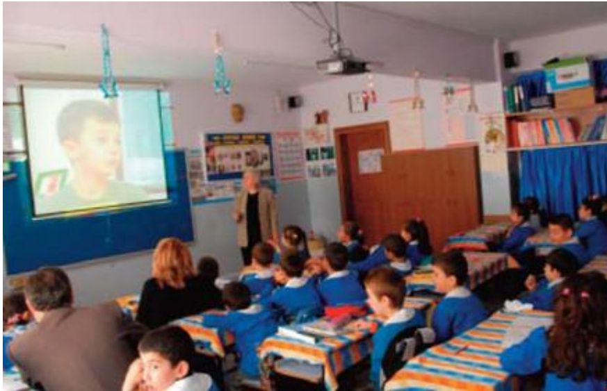
Şekil 8: Fatih Belediyesi, Eğitim de F@tîh Projesi

02 Ocak 2011 tarihinde Fatih Ulubatlı Hasan İlköğretim Okulunda Milli Eğitim Bakanının Nimet ÇUBUKÇU'nun katılımıyla gerçekleştirilen tanıtım toplantısı, birçok medya organında haber konusu olmuş, proje tüm ülkede sınıfların akıllı tahta ile donatılması projesi olan Eğitimde F@tîh Projesinin 166 doğmasına ön ayak olmuştur.