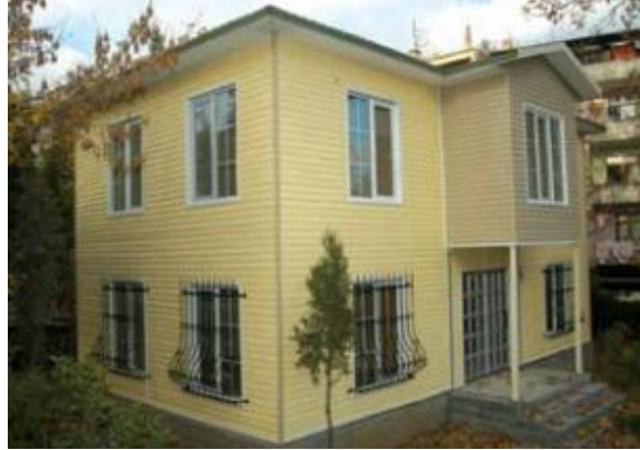
Şekil 9: Gaziosmanpaşa Belediyesi Okul Bahçelerine Prefabrik Okul Uygulaması

Gaziosmanpaşa Belediyesi, 2005 yılında, ilçe genelindeki 27 okul bahçesine, hafif çelikten prefabrik bina olarak tasarlanan, 2 katlı, içinde kütüphane, bilgisayar odası, okuma salonu, mutfak ve lavabo bulunan, yapılar inşa etmiş ve bu prefabrik yapıların, elektrik su ve ısıtma tesisatları, iç ve dış boyaları, seramik, laminat parke kaplamalarını yaparak, okul idarelerine devretmiştir. Belediyece bilgi evi olarak tasarlanan ve okul idarelerine devredilen 27 prefabrik yapının 24'ü hâlihazırda anaokulu olarak hizmet vermektedir. 181