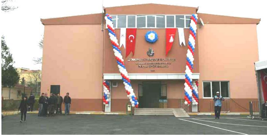
Şekil 4: İBB 120 Okul 120 Spor Salonu Projesi

Arazi bakımından uygun olan resmi okulların bahçelerine yapılan küçük ölçekli spor salonu ve orta ölçekli spor salonu olmak üzere iki türde inşa edilen spor salonları, okul saatleri dışında, faydalanmak isteyen vatandaşların kullanımına da açık haldedir. 87