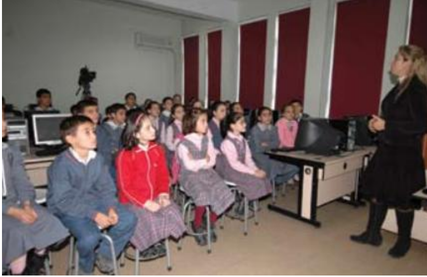
Şekil 5: Bağcılar Belediyesinin Okullara Eğitim Araçları Desteği

Toplamda 1.900 adet sınıfta sunum sistemleri kuran Belediye, derslerin, çoklu zekâ kuramına göre, görsel açıdan zengin materyallerle işlenebilmesi için, gerekli fiziki elektronik donanımın oluşmasına katkı sağladığını düşünmektedir. 108