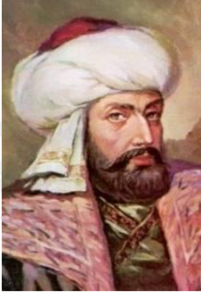
Resim 2: Erbil Atabeyliđi'nin son hükümdarı Muzafferuddin Gökboru 172