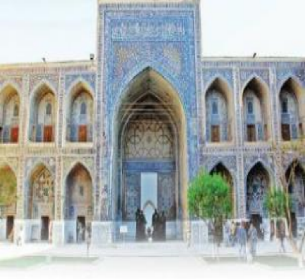
Resim 3: Selçuklu Devleti döneminde Bağdat'ta kurulmuş olan Nizamiye Medresesi 173