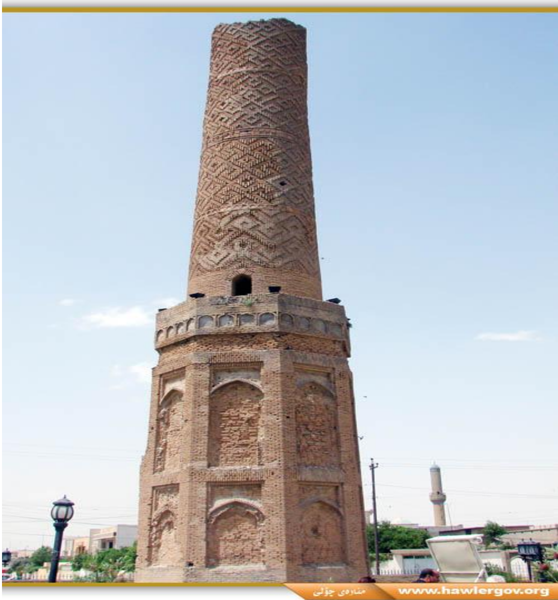
Resim 6: Erbil’de bulunan Selçuklu dönemine ait Muzafferiye Camii (Günümüze sadece minaresi ulaşmıştır) 176