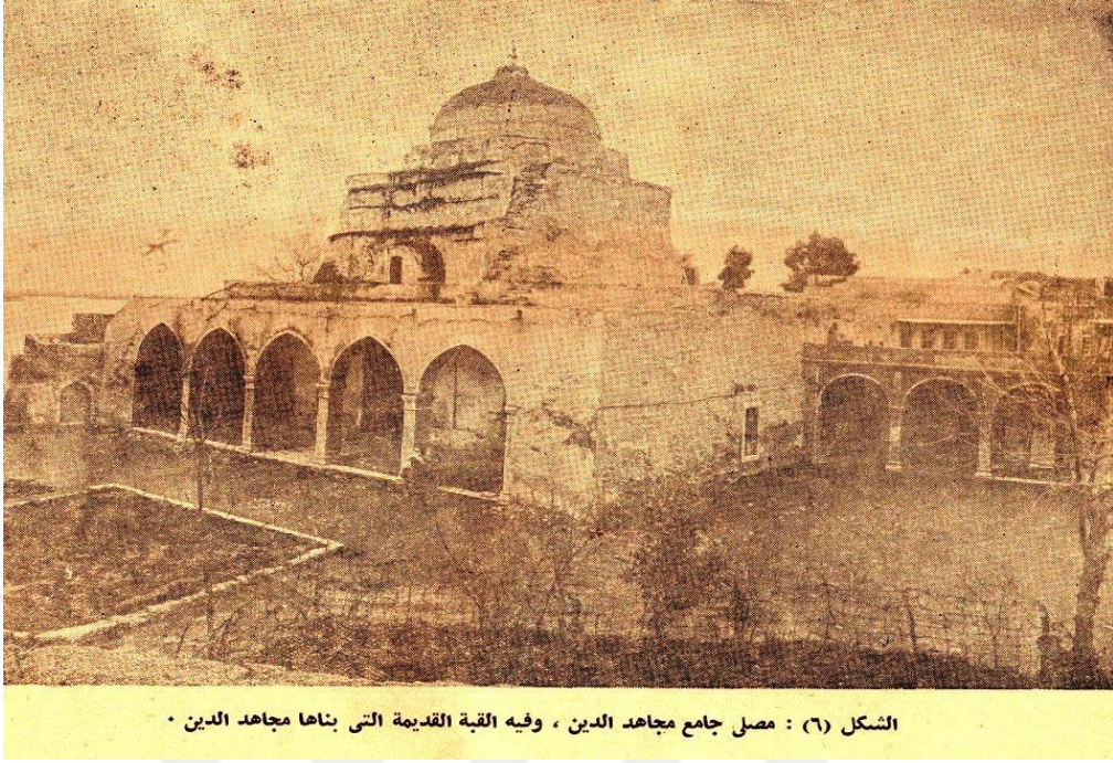
Resim 4: Begteginliler'in Musul ve Erbil naibi Mücahidüddin Kaymaz tarafından yaptırılan kendi ismiyle anılan cami (Günümüzde varlığını devam ettirmektedir) 174