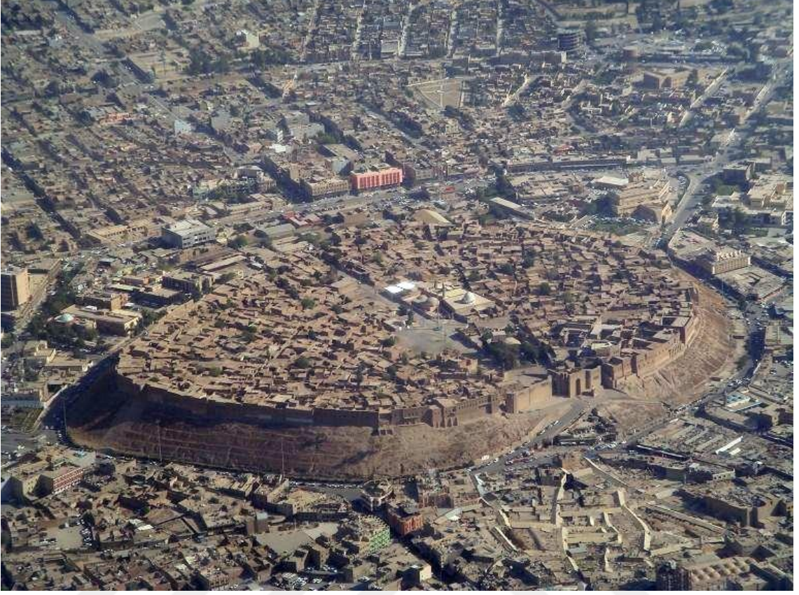
Resim 7: Erbil Kalesinin günümüze ulaşmış sur ve kapıları 177