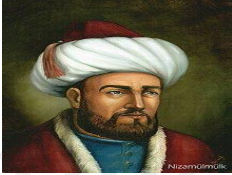
Resim 5: Büyük Selçuklu Devleti'nin en önemli vezirlerinden Nizamülmülk 175