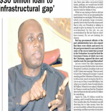
Mr Rotimi Chibuike Amechi, MINISTER for Transportation