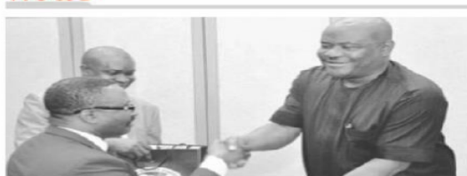
President Christian Association of Nigeria (CAN), Mr Samson Ayokunle (L) and Gov. Nyesom Wike of Rivers, during a courtesy visit by CAN President to Rivers Government House in Port Harcourt on Tuesday.