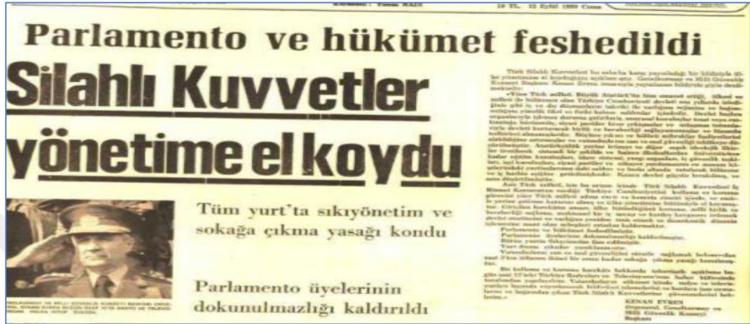
Şekil 3: Cumhuriyet Gazetesinde Yer Alan 12 Eylül 1980 Tarihli Haber

12 Eylül 1980 askeri darbesi dönemine bakıldığında ise ilk dönemde gazetenin tarafsız ifadelerle darbeyi duyurduğu görülmektedir.