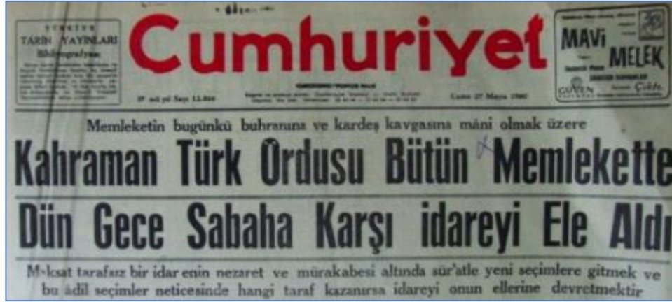
Şekil 2: Cumhuriyet Gazetesinde Yer Alan 27 Mayıs 1960 Tarihli Haber