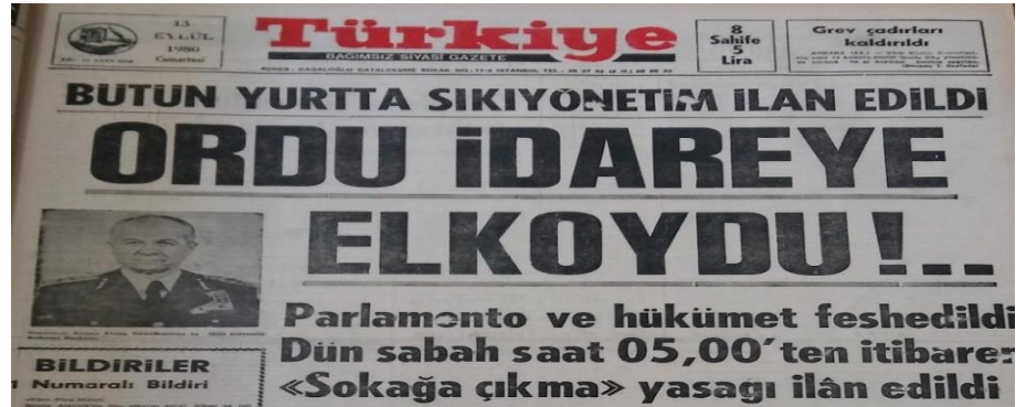
Şekil 5: Türkiye Gazetesinde Yer Alan 13 Eylül 1980 Tarihli Haber

Gazetenin darbe döneminde kullandığı dile bakıldığında ise 12 Eylül 1980 askeri darbesini, 13 Eylül 1980 tarihli sayısında “Bütün Yurtta Sıkı Yönetim İlan Edildi. Ordu İdareye El Koydu!” başlığıyla duyurduğu görülmektedir.