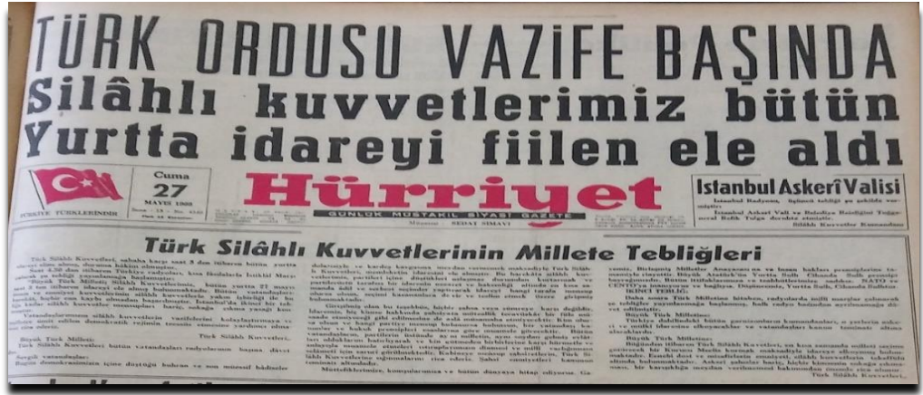
Şekil 4: Hürriyet Gazetesinde Yer Alan 27 Mayıs 1960 Tarihli Haber