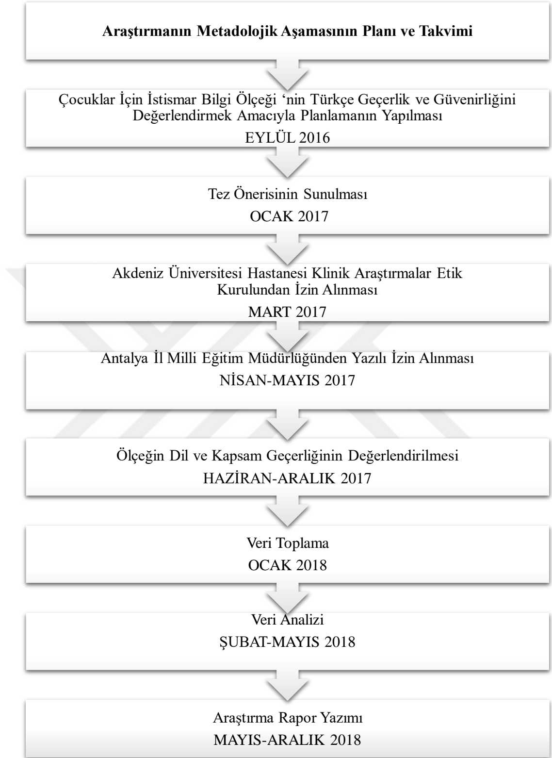
Şekil 3.1. Araştırma uygulama süreci