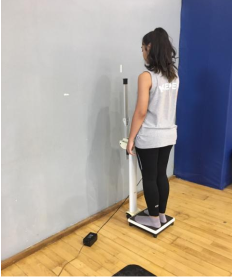
Şekil 2. Boy ve ağırlık ölçümü

Teste katılan tüm deneklerin boy ve ağırlık ölçümü anatomik duruşta iken ayakkabısız ve spor kıyafetleri ile alınmıştır. Deneklerin boy ve ağırlık ölçümü 0.01 cm ve 0.01 kg hassasiyeti olan dijital ölçekli stadiometre ile ölçüldü.