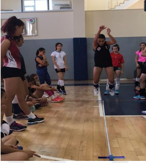
Şekil 7. Durarak uzun atlama ölçümü