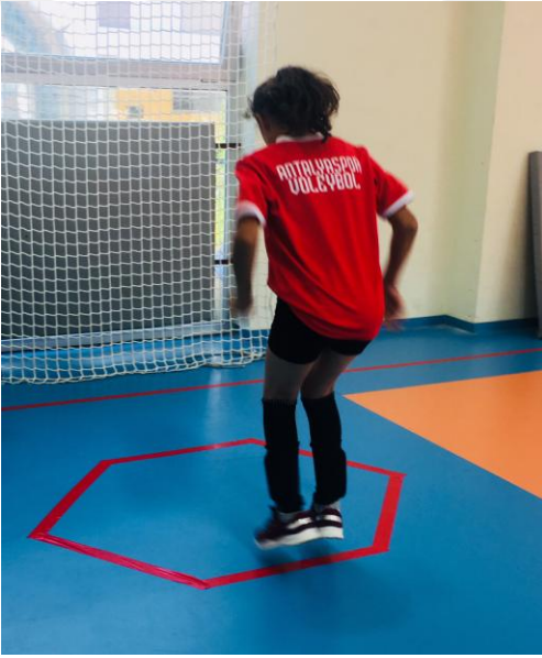
Şekil 3. Altıgen çeviklik ölçümü

Testin değerlendirilmesi: Ölçüm sonucunda iki derecenin ortalaması alındı (Köktaş, 2013).