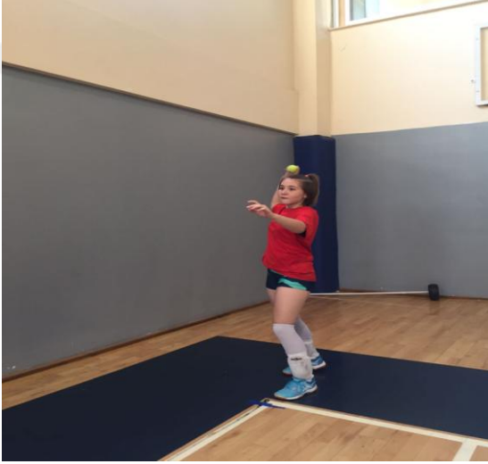
Şekil 12. Tenis topu fırlatma ölçümü

Testin değerlendirilmesi: Tüm ölçümlerin genel ortalaması cm olarak kaydedildi (Altınkök, 2006).