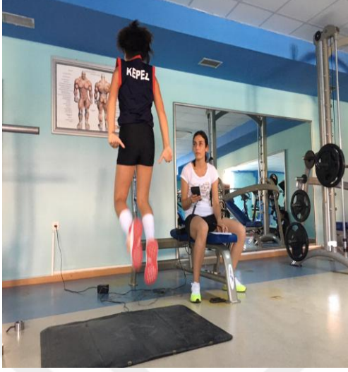
Şekil 10. Havada kalma süresi ölçümü