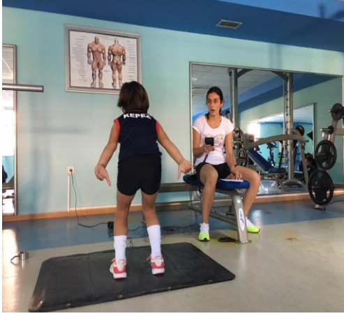
Şekil 9. Countermovement sıçrama ölçümü

Testin değerlendirilmesi: İki tekrar sonucunda en iyi derece kaydedildi (Gheller ve ark., 2014).