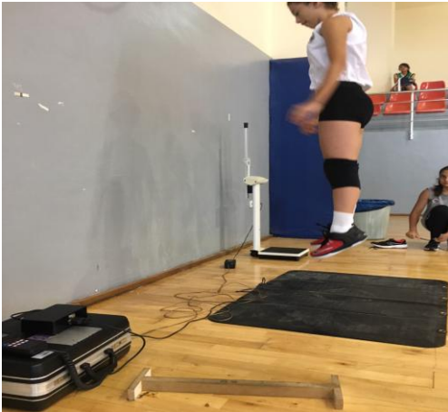
Şekil 8. Dikey sıçrama ölçümü

Testin değerlendirilmesi: Bilgisayar ortamına aktarılan ölçüm sonuçlarında en iyi derece kaydedildi (Sarget, 1921).