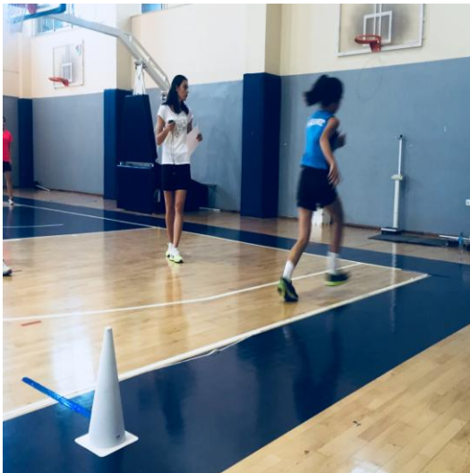
Şekil 11. 10x5 mekik koşusu ölçümü

Testin uygulanması: Denek işaretlenmiş 5 metre mesafe üzerinde ileri koşar ve ardından dönerek başlangıç çizgisine gelir. Bunu ard arda 5 kez yapar. Toplamda 50 m koşu gerçekleştirir. Ölçümlerin sonucu sn olarak kaydedilir (Popovici ve ark., 2016).