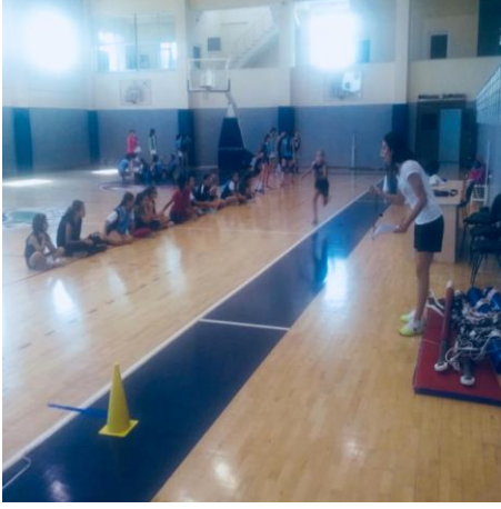
Şekil 5. 20 metre sürat koşusu ölçümü