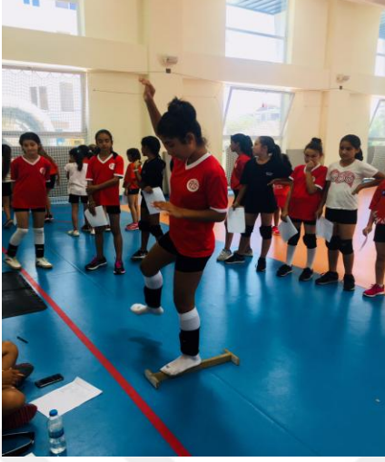
Şekil 6. Statik denge ölçümü