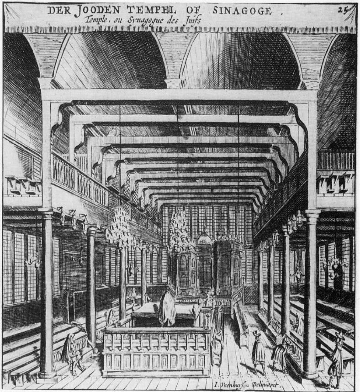
Ek 3: Amsterdam Talmud Torah Sinagogu'nun içeriden görüntüsü.