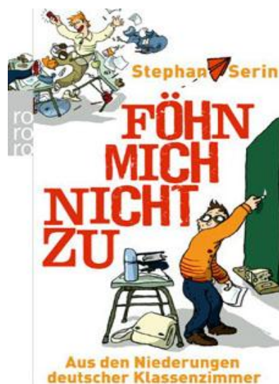
Abbildung 4: Das Buch „Föhn mich nicht zu“

( http://sector-o.cc/2010/10/stephan-serin-fohn-mich-nicht-zu/ , 2014).