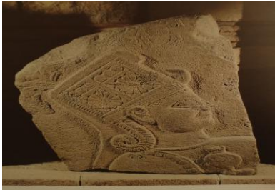
Görsel-9: Geç Hitit Tanrıça Kubaba

Figürlerin cephe ve yanlarını yüzeyler halinde düzleştirerek ve yüzeylerin üzerini kimi öğeleri stilizasyona tabi tutarak süslemişleridir. Böylece heykeller, düzenlenmiş yüzeylerle toplu hale getirilmiş ve heykellere anıtsal bir etki kazandırılmıştır (Görsel-10) (Turani, 1997: 122).