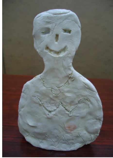
Görsel-28. Öğrenci Çalışması.