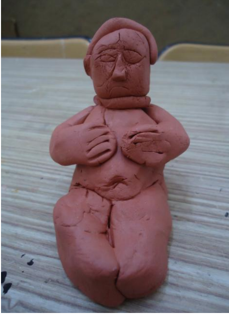
Görsel-19. Öğrenci Çalışması.