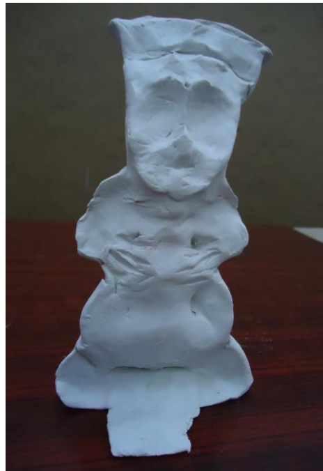
Görsel-26. Öğrenci Çalışması.