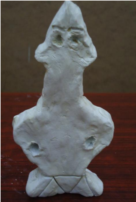
Görsel-33. Öğrenci Çalışması.