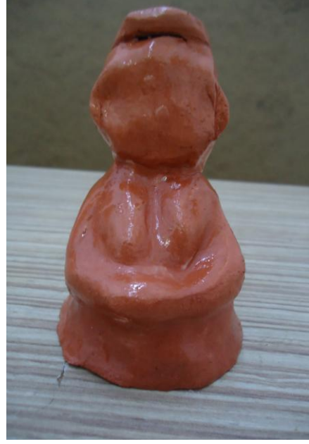
Görsel-20. Öğrenci Çalışması.