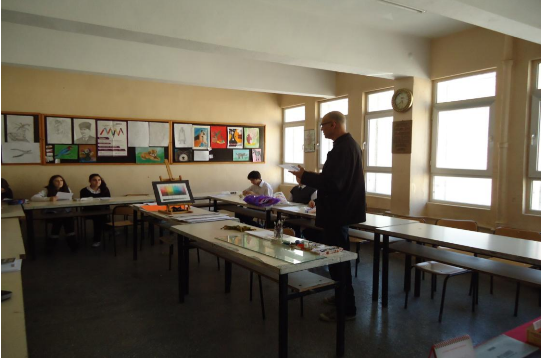
Görsel-59. Atölyede Heykel Uygulama Çalışması Öncesi.