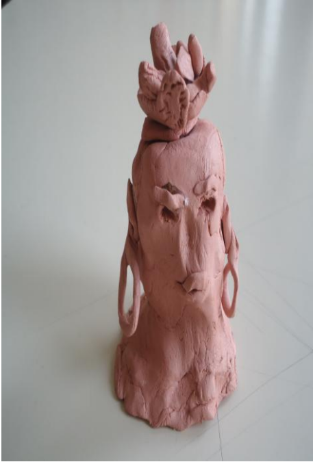
Görsel-43. Öğrenci Çalışması.