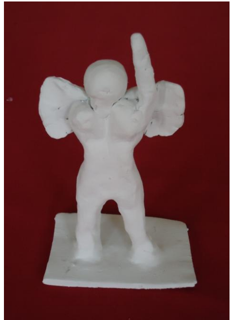
Görsel-46. Öğrenci Çalışması.