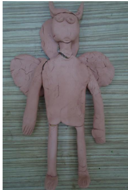
Görsel-38. Öğrenci Çalışması.