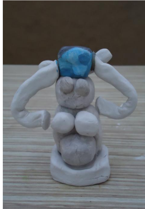
Görsel-42. Öğrenci Çalışması.