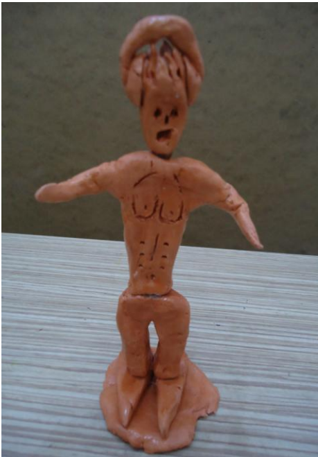
Görsel-17. Öğrenci Çalışması.