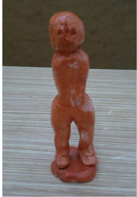
Görsel-44. Öğrenci Çalışması.