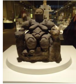
Görsel-4: Ana Tanrıça