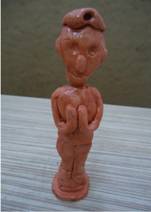
Görsel-51. Öğrenci Çalışması.