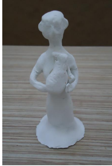
Görsel-36. Öğrenci Çalışması.