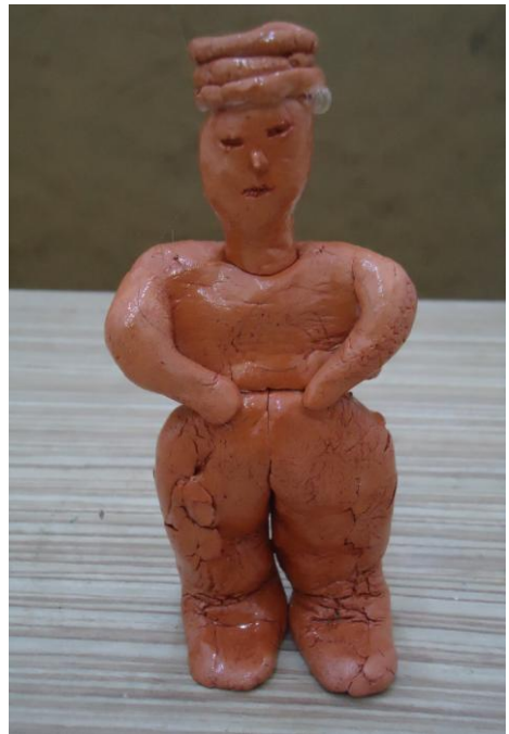
Görsel-34. Öğrenci Çalışması.