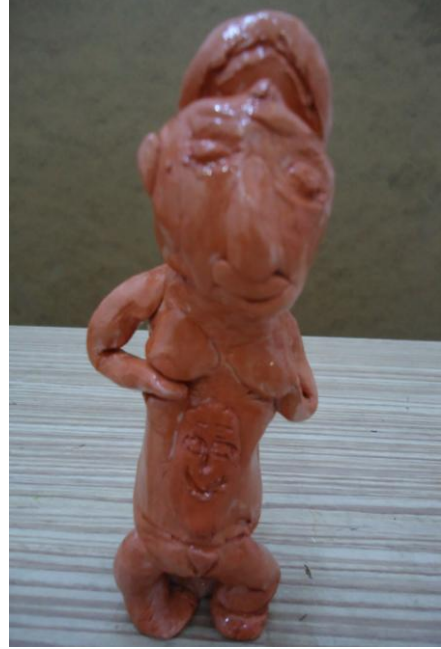
Görsel-16. Öğrenci Çalışması.