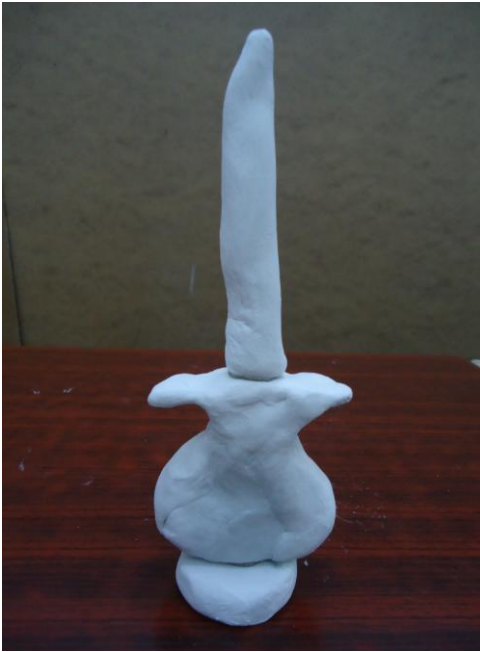
Görsel-49. Öğrenci Çalışması.