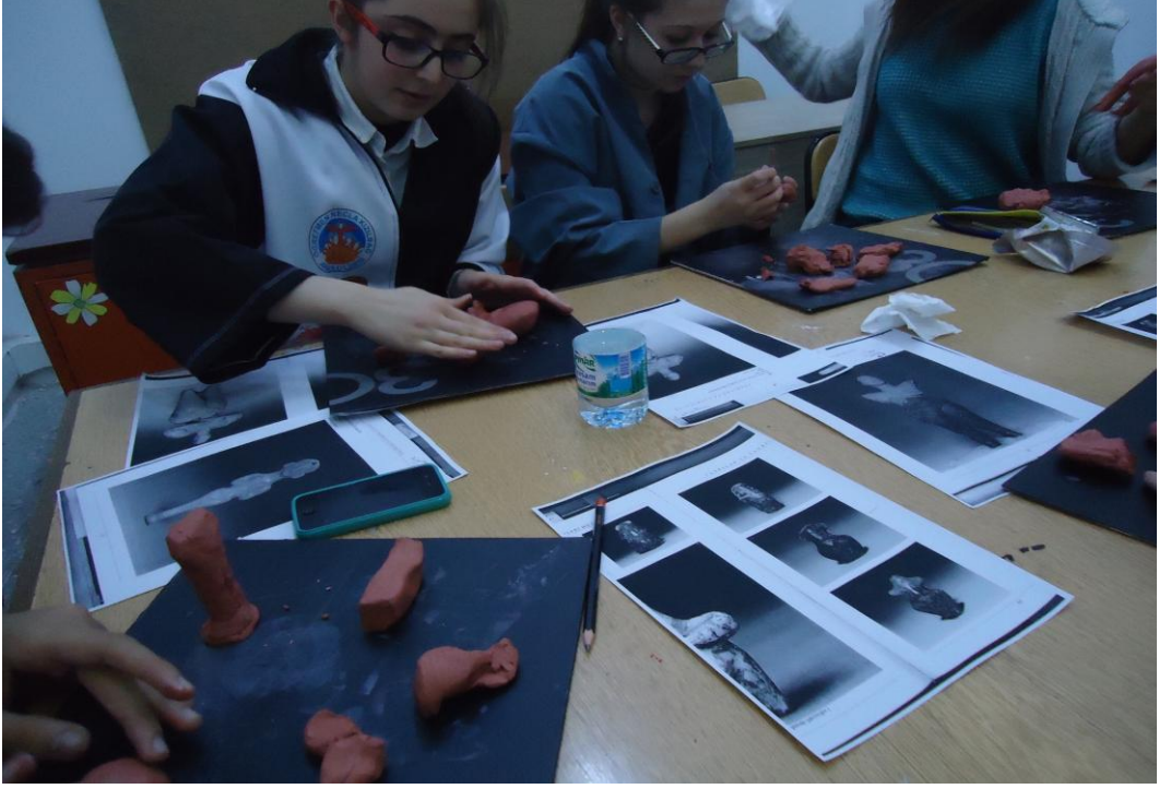
Görsel-61. Atölyede Öğrenciler Heykel Uygulama Çalışması Yaparken.