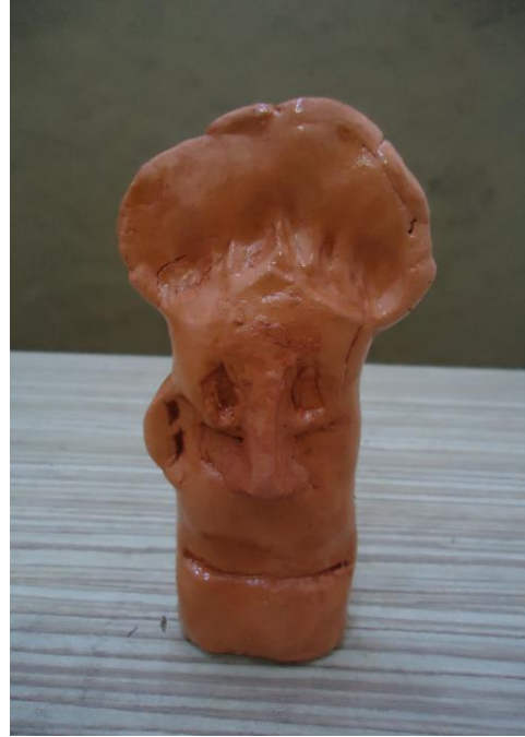
Görsel-52. Öğrenci Çalışması.