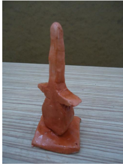
Görsel-50. Öğrenci Çalışması.