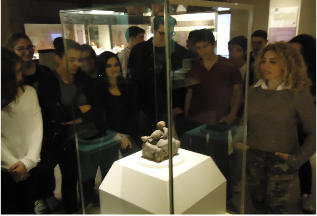
Görsel-57. A.M.M. Müze Eğitimsinin Öğrencilerle Bilgi Paylaşımı