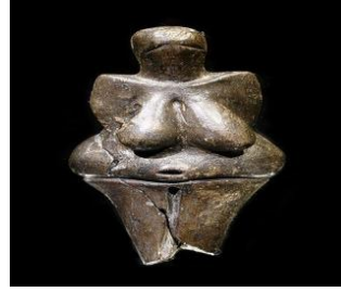
Görsel-2: Wisternitz Venüsü