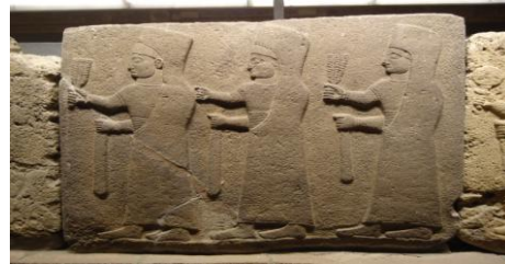
Görsel-10: Geç Hitit Kabartması