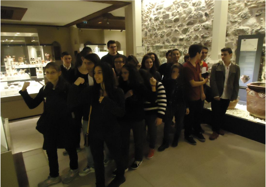
Görsel-58. A.M.M. Etkinlik Uygulamaları.