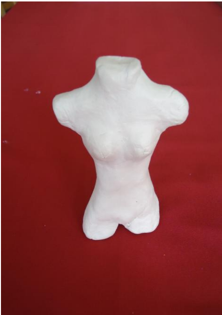
Görsel-45. Öğrenci Çalışması.