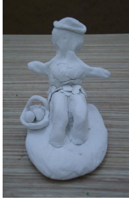
Görsel-40. Öğrenci Çalışması.