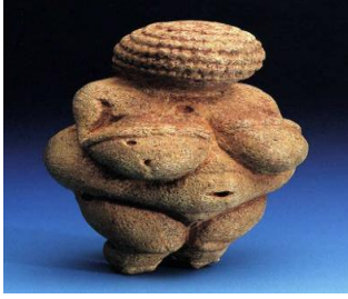
Görsel-1: Willendorf Venüsü