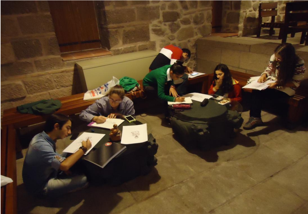
Görsel-56. Anadolu Medeniyetleri Müzesi Uygulama Çalışmaları