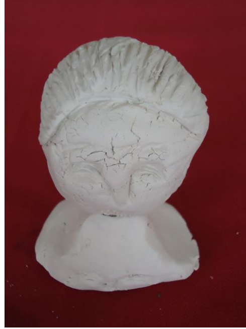
Görsel-48. Öğrenci Çalışması.