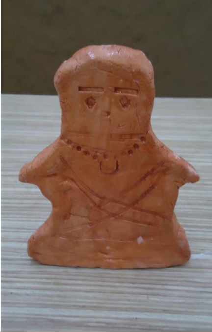
Görsel-39. Öğrenci Çalışması.