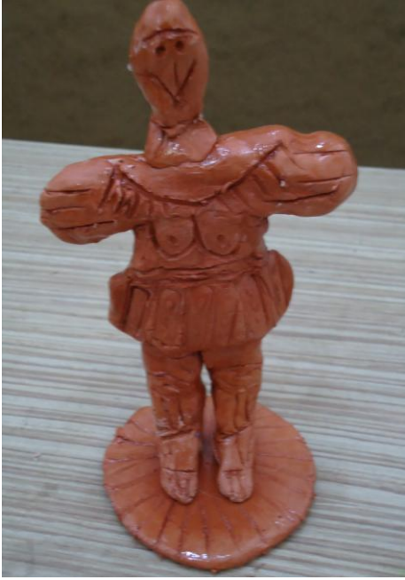
Görsel-31. Öğrenci Çalışması.