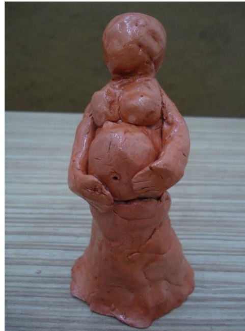
Görsel-54. Öğrenci Çalışması.