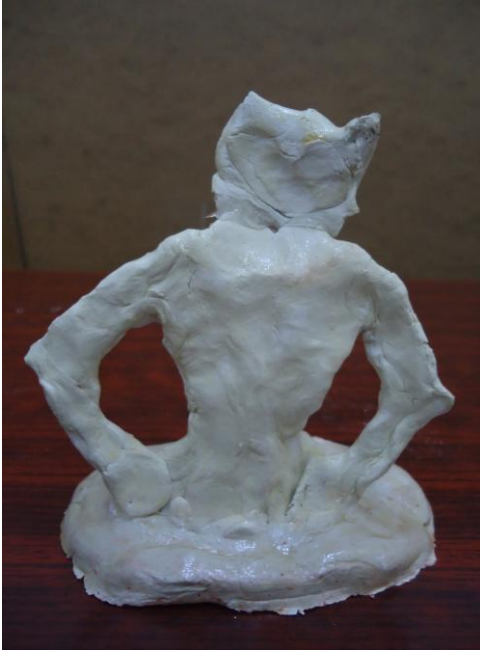
Görsel-27. Öğrenci Çalışması.