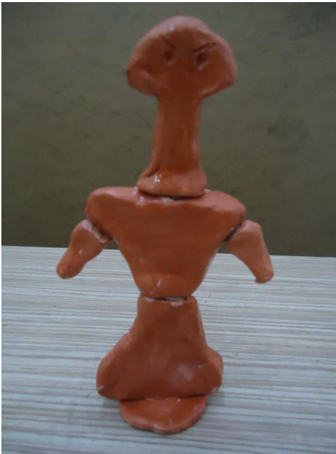
Görsel-53. Öğrenci Çalışması.