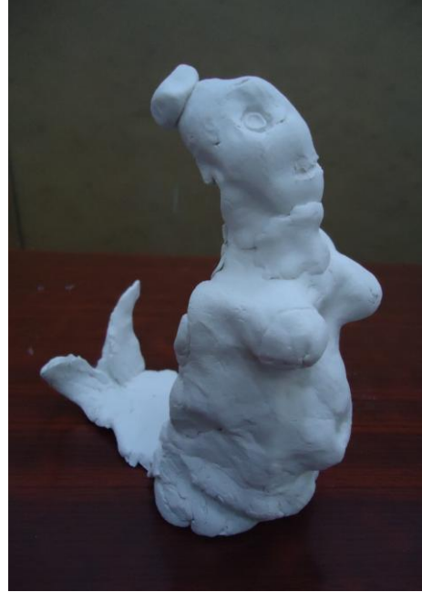
Görsel-22. Öğrenci Çalışması.