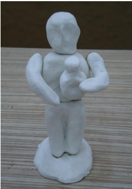
Görsel-37. Öğrenci Çalışması.