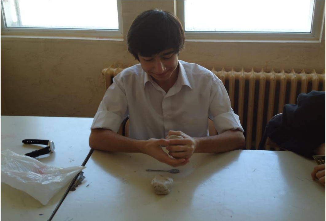
Görsel-62. Atölyede Öğrenciler Heykel Uygulama Çalışması Yaparken.