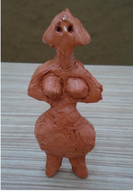
Görsel-35. Öğrenci Çalışması.