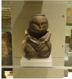
Görsel-3: Ana Tanrıça

Çatalhöyük'te ele geçirilen kadın heykelciklerinde, kadın, ağırlıklı olarak oturur durumdadır. Oturur olmasının nedeni doğum yapıyor olmasıdır. (Görsel-3) İlkel toplumlarda kadınlar, doğum esnasında ebelere ya da yardım eden kişilere tutunarak çömelir ya da oturma pozisyonu alırlardı. O nedenle heykelcikler ağırlıklı olarak bu şekilde biçimlendirilmiştir. Çatalhöyük'te oturan kadın heykelciklerinin çoğunun iki yanında vahşi hayvanlar durmaktadır. Bu hayvanlar gücü sembolize etmektedir. Kadınlar elleriyle; ya bu hayvanları, ya göğüslerini, ya da başlarını tutarlar. (Görsel-4) Kadınların göğüsleri iri ve sarkık, şişman ve iri kalçalıdır (Ergener, 1988: 33).