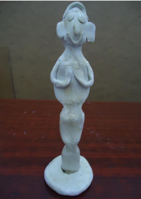
Görsel-25. Öğrenci Çalışması.