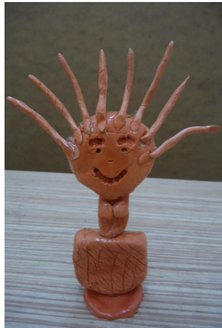
Görsel-18. Öğrenci Çalışması.