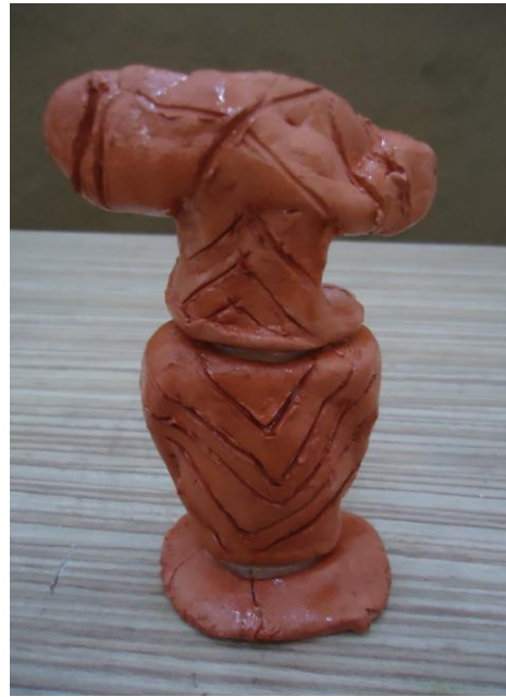
Görsel-30. Öğrenci Çalışması.