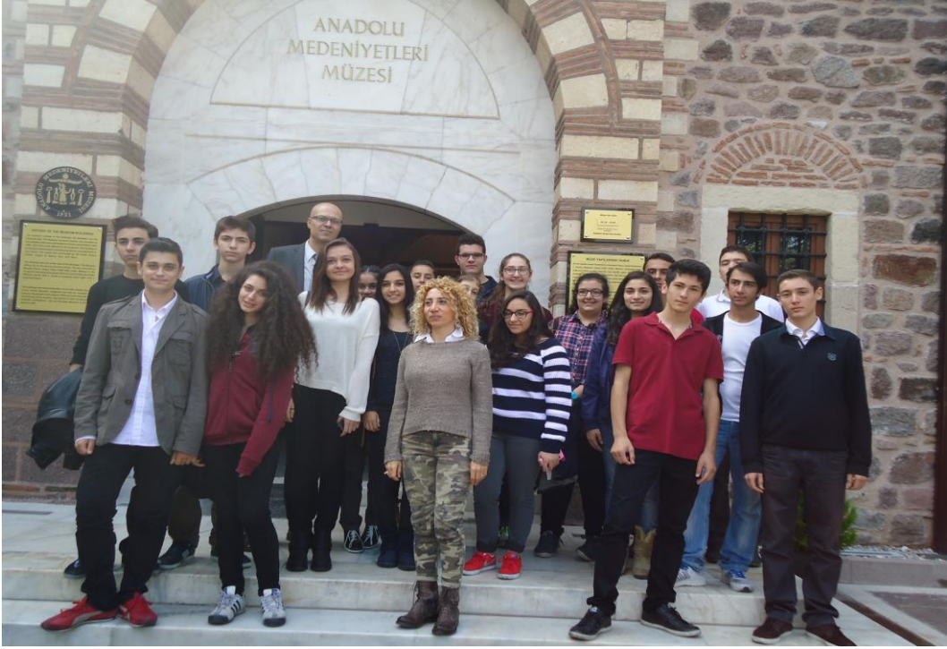
Görsel-55. A.M.M. gezisi öncesi