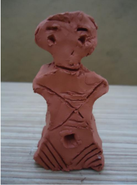
Görsel-21. Öğrenci Çalışması.