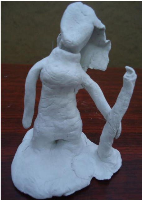
Görsel-29. Öğrenci Çalışması.