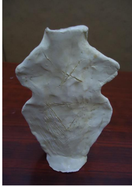
Görsel-24. Öğrenci Çalışması.