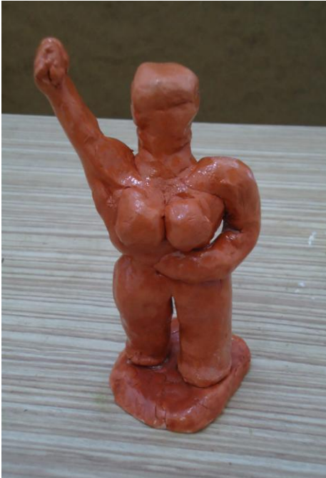
Görsel-41. Öğrenci Çalışması.