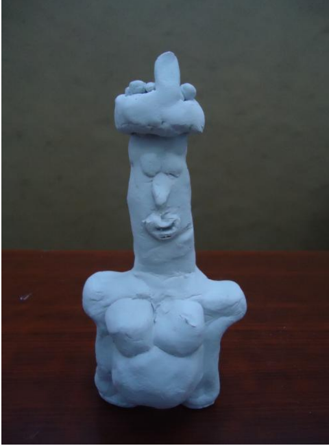
Görsel-15. Öğrenci Çalışması.