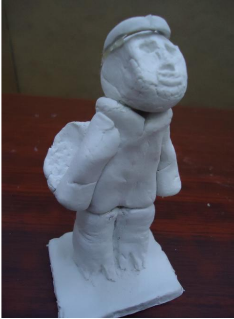
Görsel-23. Öğrenci Çalışması.