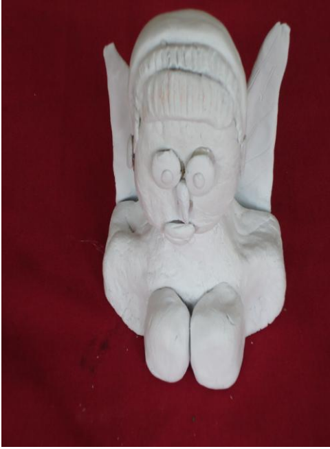
Görsel-47. Öğrenci Çalışması.