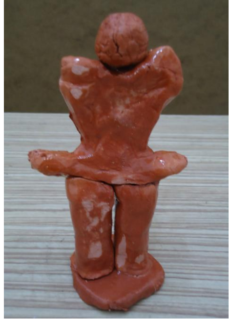
Görsel-32. Öğrenci Çalışması.