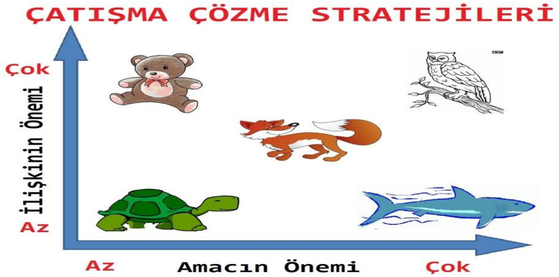
Şekil 1 Çatışma çözme stratejileri (Johnson ve Johnson, 1994).

Simith ve Sidwell (1990) ve Gordon (2005) ise, çatışma çözme davranışını kaçınma, saldırganlık ve problem çözme olarak üç başlıkta açıklamıştır. Bu çatışma çözme davranışları ve olası sonuçları şekil 2’de yer almaktadır.