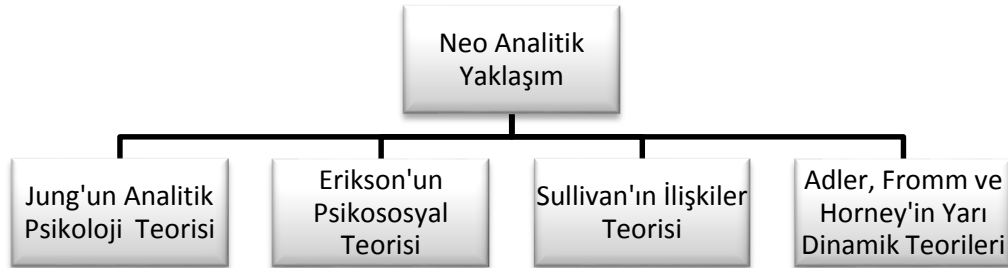
Şekil 3. Neo-Analitik Yaklaşımın Savunucuları ve Teorileri