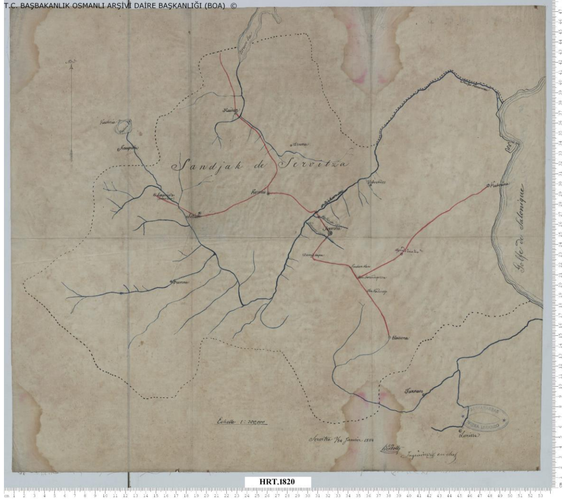
EK-1 Serfice Sancağı'nın Haritası (BOA. , HRT.H. , 1820/1)