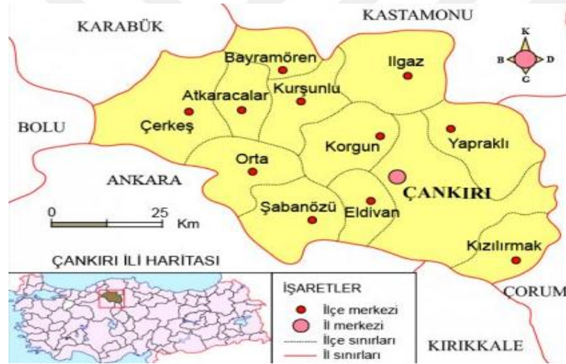
Şekil 3.1. Çankırı ilinin coğrafik konumu (Anonim 1)

Çalışmanın ana materyalini Çankırı ilinde tarımsal üretim yapan geleneksel işletmeler oluşturmaktadır. Çankırı ili, İç Anadolu Bölgesinin kuzeyinde, Kızılırmak ve Batı Karadeniz ana havzaları içinde yer alan uzunluğu 130 km, genişliği ise 80 km olan ekonomisi büyük oranda tarımsal üretime dayanan bir ilimizdir. İlin toprakları 40^{\circ} 36'' 41^{\circ} kuzey enlemleri ile 32^{\circ} 30'' ve 34^{\circ} doğu boylamları arasında kalmaktadır (Cengil, 2013). Doğusunda Çorum, batısında Bolu, kuzeybatısında Karabük, kuzeyinde Kastamonu, güneyinde Ankara ve Kırıkkale İlleri ile yer almaktadır. Yüzölçümü 749.000 ha'dır ve 11 ilçe, üç belde ve 375 köyden oluşmaktadır. İl geneli toplam nüfusu 180.945'tir ve nüfusun %30,3'ü (54.887 kişi) kırsal alanda yaşamaktadır. İl Merkezinin toplam 88.538 kişi'dir (TUİK 2016). Çankırı ili coğrafik ve fiziki konumu Şekil 3.1'de, Çankırı ili topraklarının genel ve ilçelere göre dağılımı Çizelge 3.1 ve Çizelge 3.2'de verilmiştir.