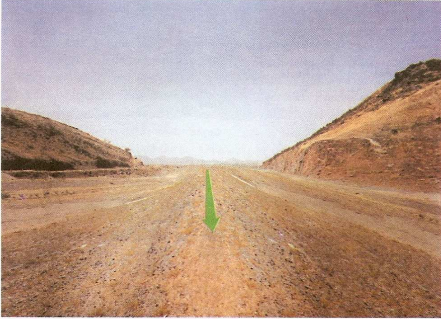
Merru'z-Zahrân'dan hareket İslam ordusunun geçtiği dar boğazın Mekke yönünden görünüşü

Bu resimler, İbrahim Sarıçam'ın, Hz. Muhammed ve Evrensel Mesajı , isimli eserinden alınmıştır.