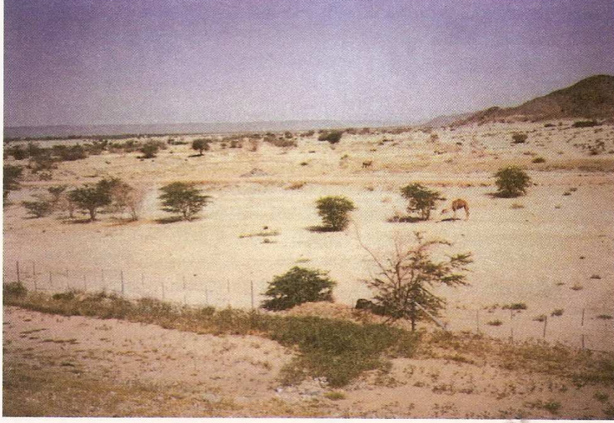
Mekke'nin fethine giderken ordunun konakladığı Merru'z-Zahrân'dan bir başka görüntü