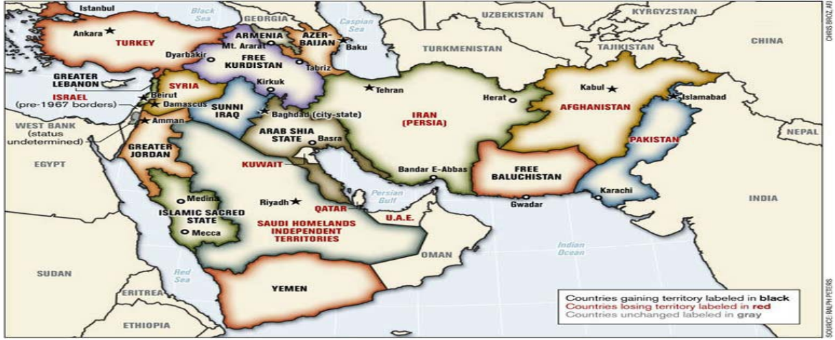
Şekil-6 GOKAP'ın Bölge Hedeflerini Gösteren Harita

büyük olasılıkla Milli Savaş Akademi'sinde ve askeri planlama dairelerinde de kullanılmaktadır.