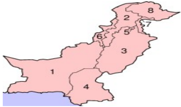
Şekil-4 Pakistan Eyaletleri