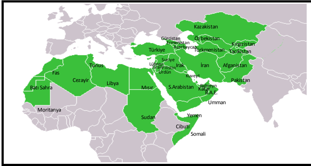
Şekil 2: BOP Bölgesi 26

Bu tez kapsamında ise, “Büyük Orta Doğu Projesi”(BOP) (Şekil 2) adı altında projenin ortaya çıkmış olduğu Kasım 2003'de, ABD'nin Orta Asya ve Kafkasya bölgelerini de proje kapsamına dâhil etmek istediği, ancak Avrasya güçlerini gözetmek durumunda kalması, ABD'nin projenin maliyetini tek başına karşılayabilecek düzeyde olmaması, projenin ortaklarının çoğalması, Atlantik uyumunun sağlanamaması ve bunların sonucunda G-8 zirvesinde projenin daha elle tutulur hale getirilmesi ile proje kapsamına sadece Orta Doğu ve Kuzey Afrika ülkelerinin dâhil edildiği belirtilebilir.