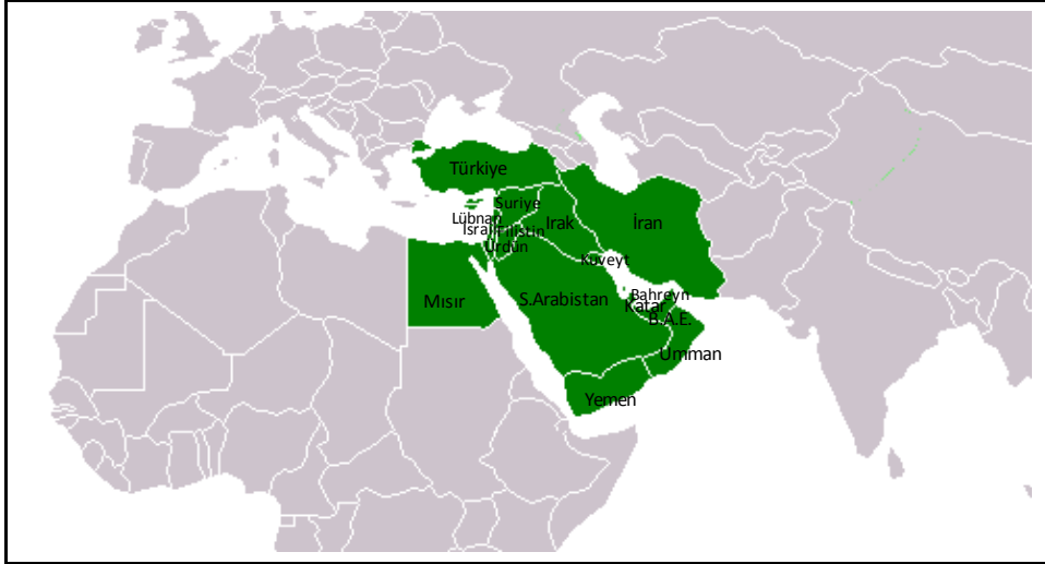
Şekil 1: Dar anlamıyla Orta Doğu 14

Ortadoğu'daki ülkeler için söylenebilecek iki ortak özellik bölgenin bir İslam ve Anti-demokratik Rejimler coğrafyası olmasıdır. Ancak farklılıkları bulunmaktadır. Bunları sıralayacak olursak;