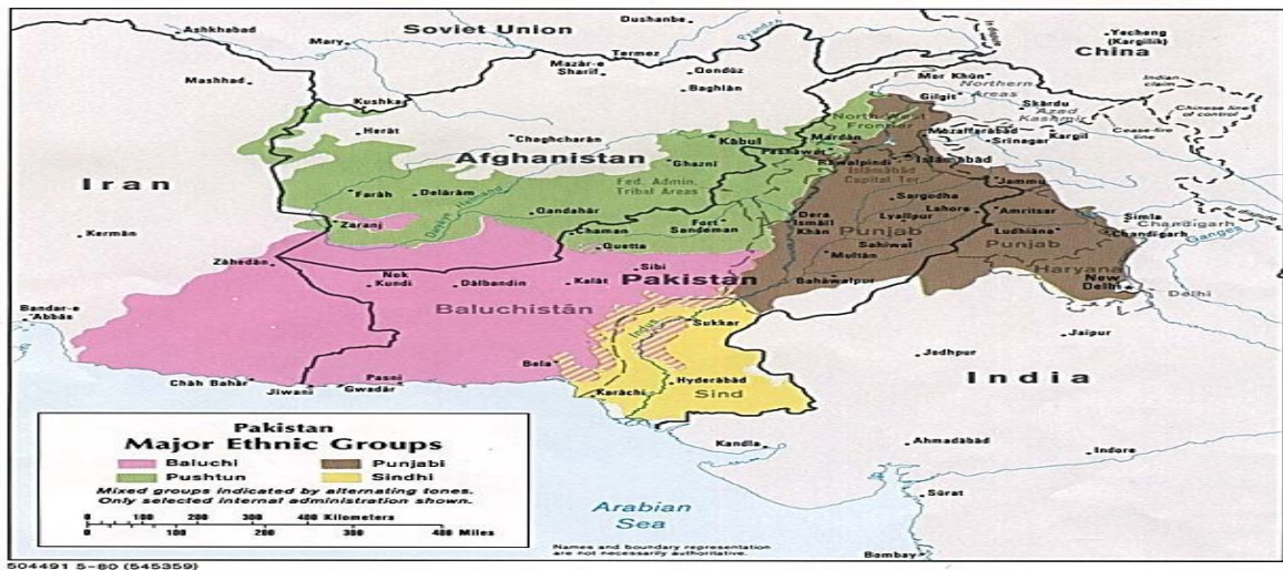
Şekil-5 Belucilerin Yaşadıkları Yerler.

Beluçların kökenleri ile ilgili en geçerli teori, bu halkın akrabaları Kürtler ile birlikte M.Ö. 1500'lü yıllarda Suriye Halep civarından dalgalar halinde şu anki buldukları coğrafyaya göç etmiş olduklarıdır. Gene aynı Kürtler gibi yalnız bir eksikle üç ayrı ülkede Afganistan, İran ve Pakistan sınırları içerisinde yaşamaktadırlar. Belucilerin yaşadıkları bölgeler Şekil-5'deki haritada gösteriliyor.