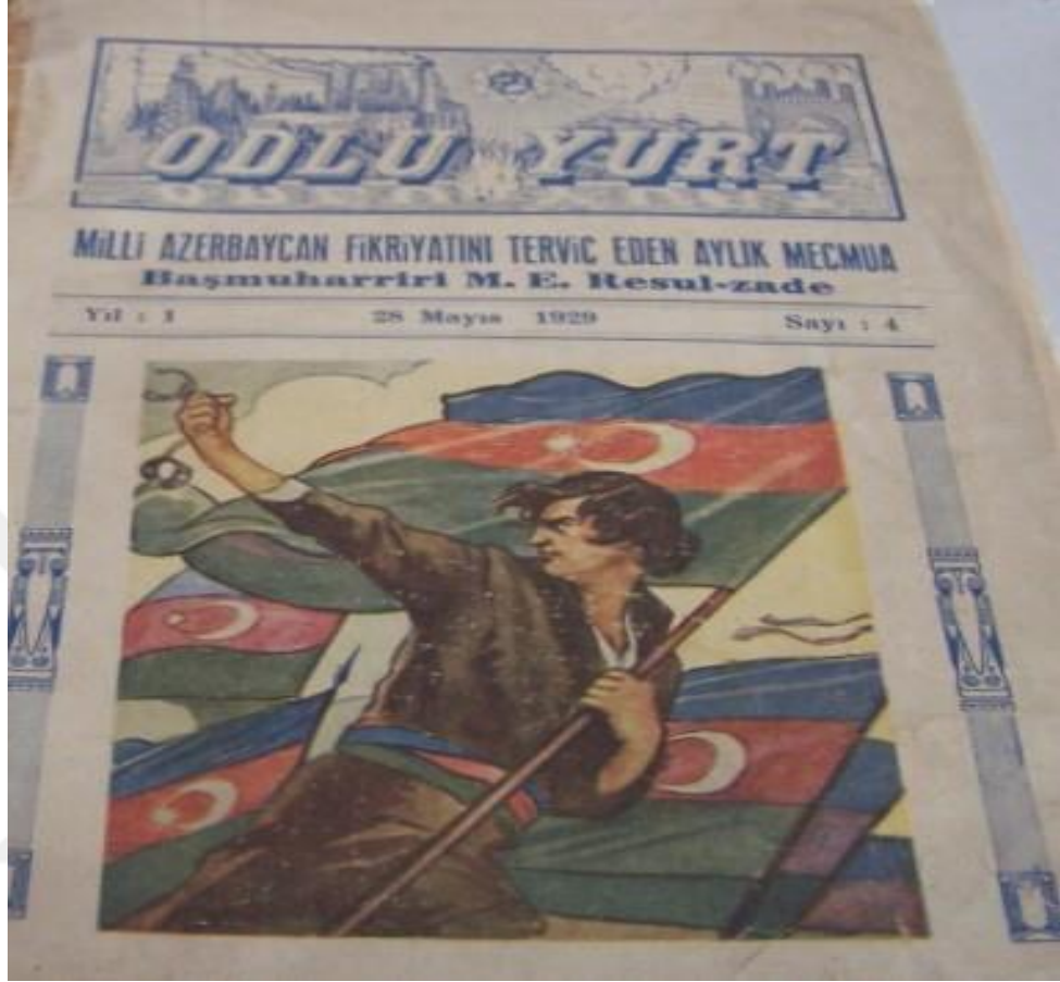
Odlu Yurt Mecmuası Kapak Sayfası, Y.1, S.4, 28 Mayıs 1929