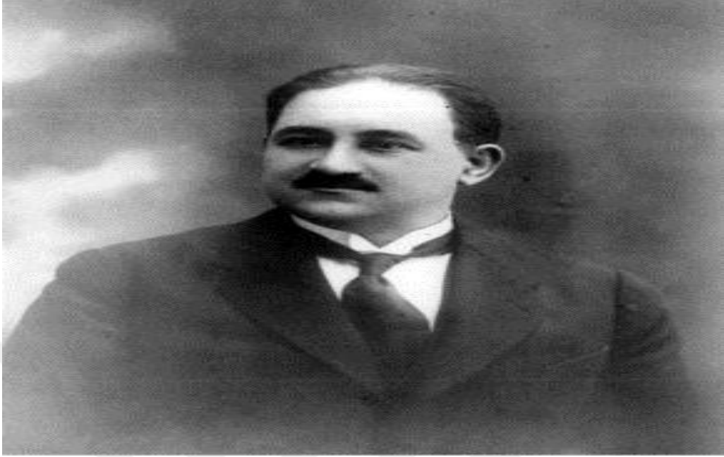
Mehmet Emin RESULZADE