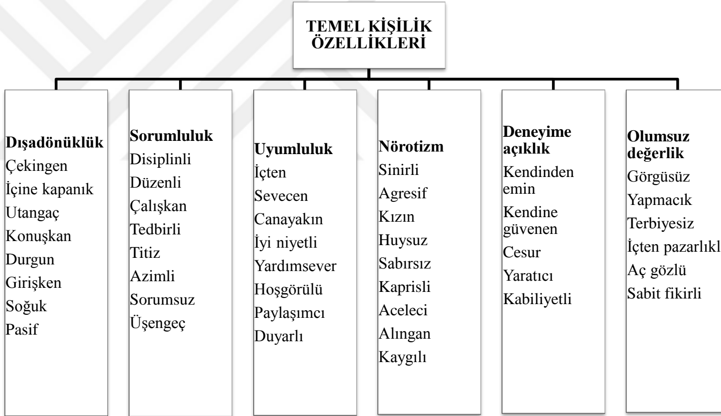
Şekil 1. Temel Kişilik Özellikleri Ölçeği Alt Boyutları