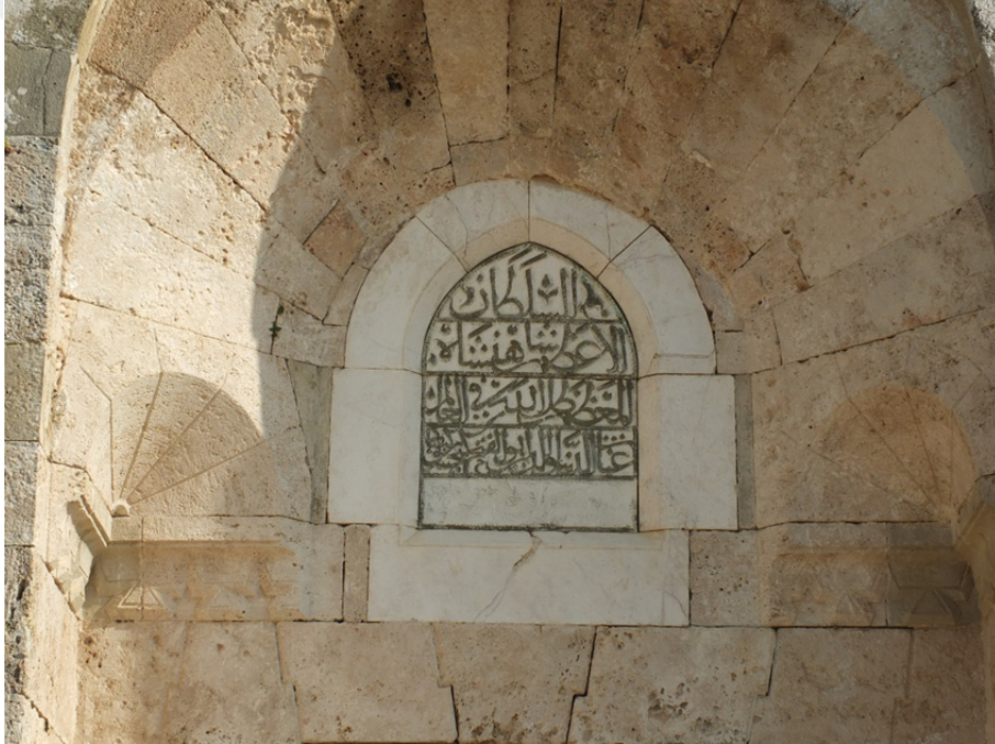
Res. 35: Şarapsa Han Kitabesi