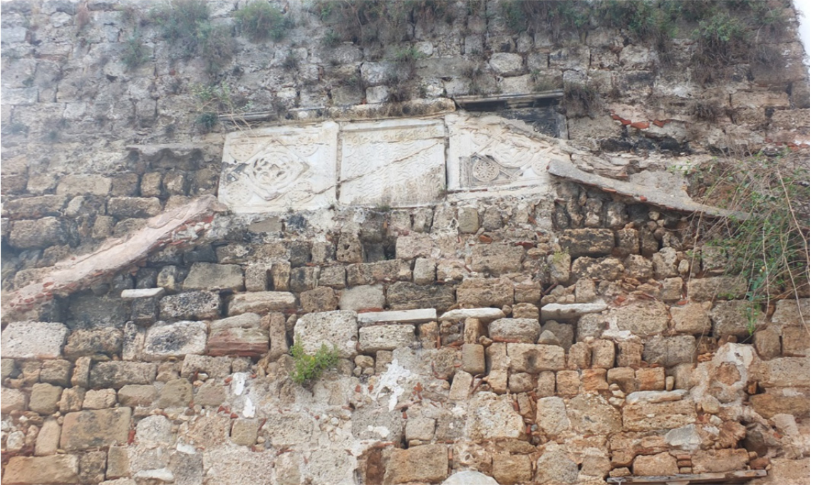
Res. 8: Antalya Kaleiçi'nde I. İzzeddin Keykavus Dönemine Ait Sur Kitabesi Detayı