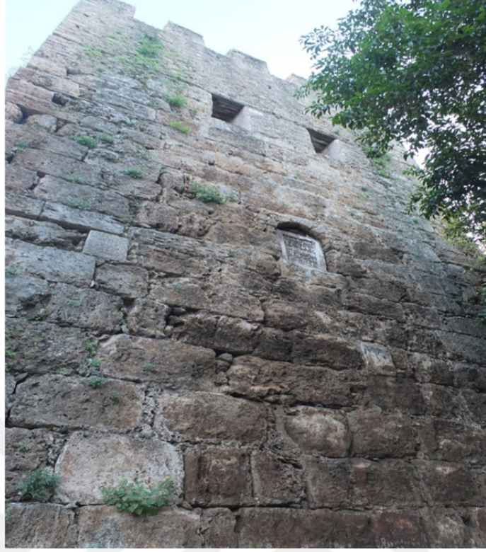
Res. 9: Antalya Surları Burç Detayı