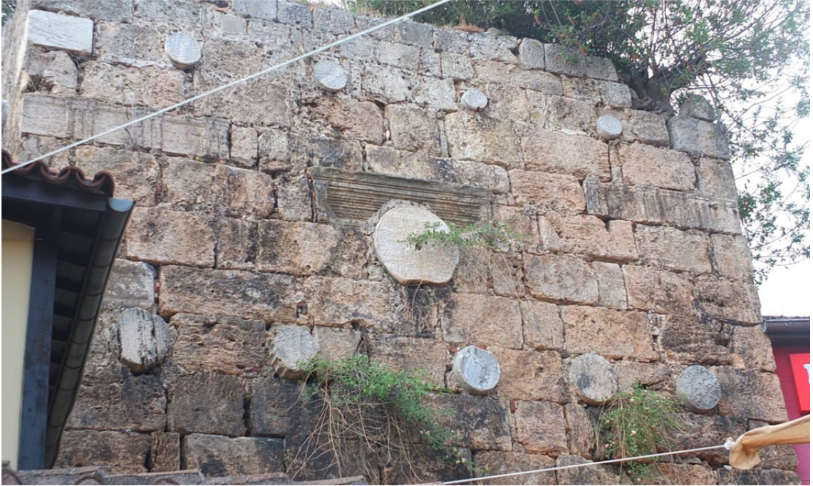
Res. 4: I. İzzeddin Keykavus'un Fetihnâmesi'nin Merkez Kısmı