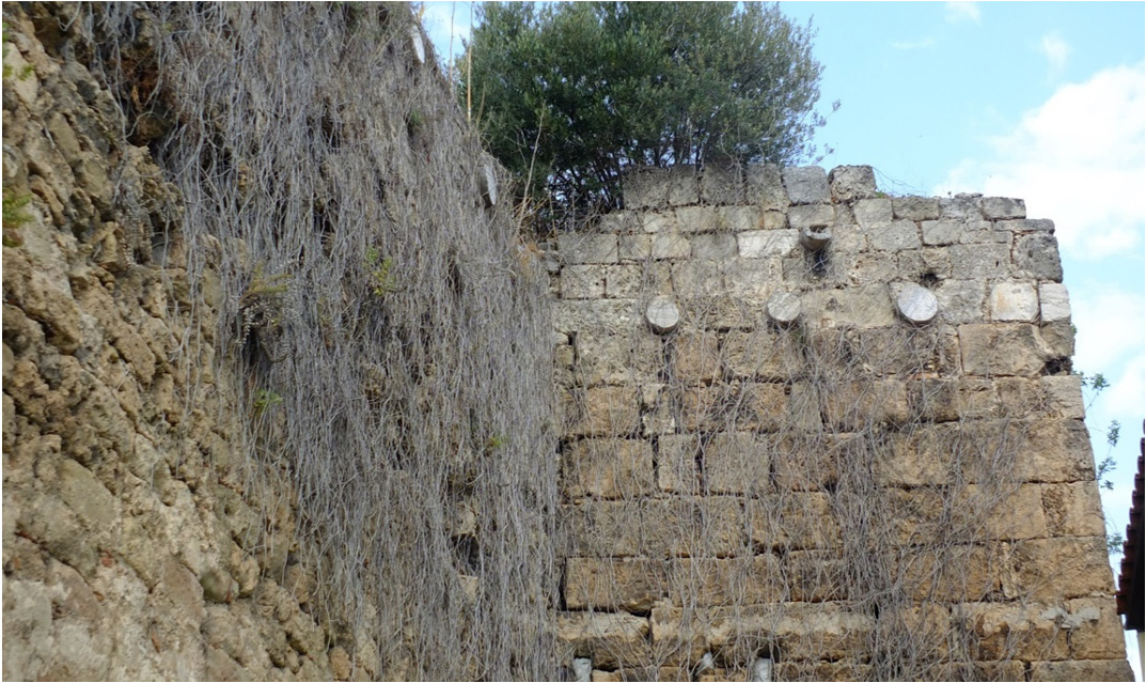
Res. 6: I. İzzeddin Keykavus Fetiĥnâmesi Parçaları