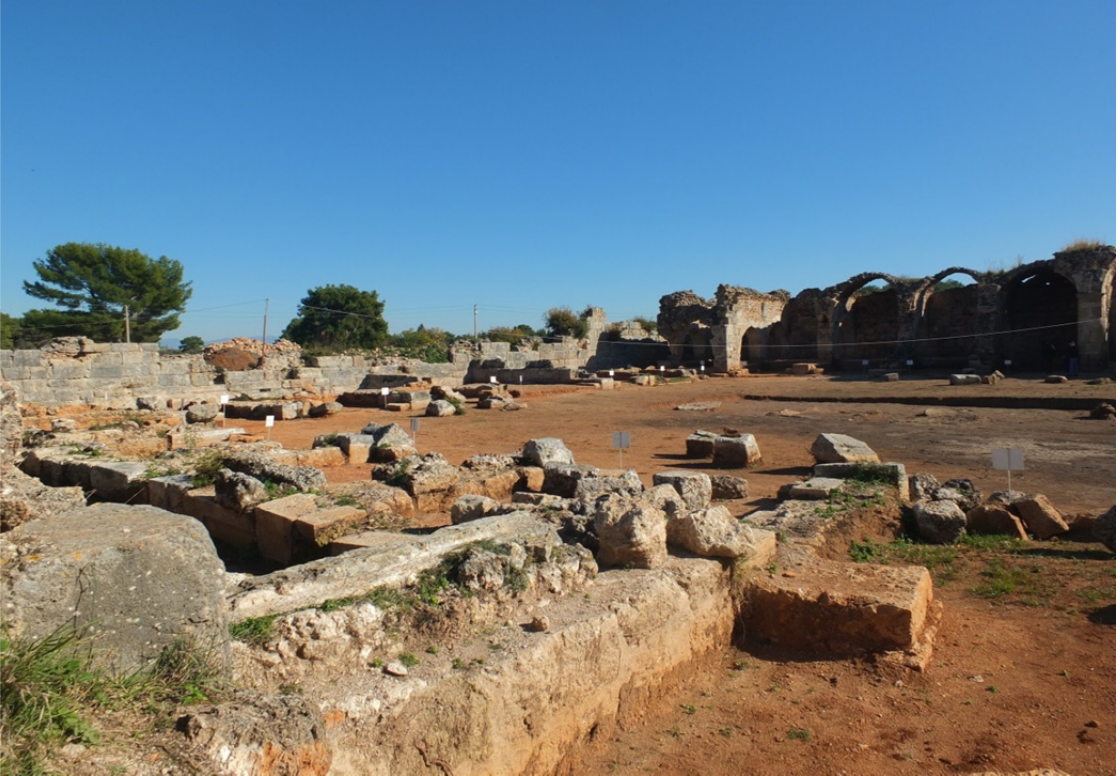
Res. 21: Antalya Evdir Han İç Görünüşü