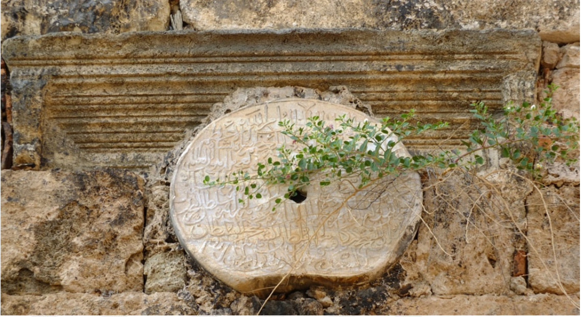
Res. 5: I. İzzeddin Keykavus Fetiĥnâmesi Detayı