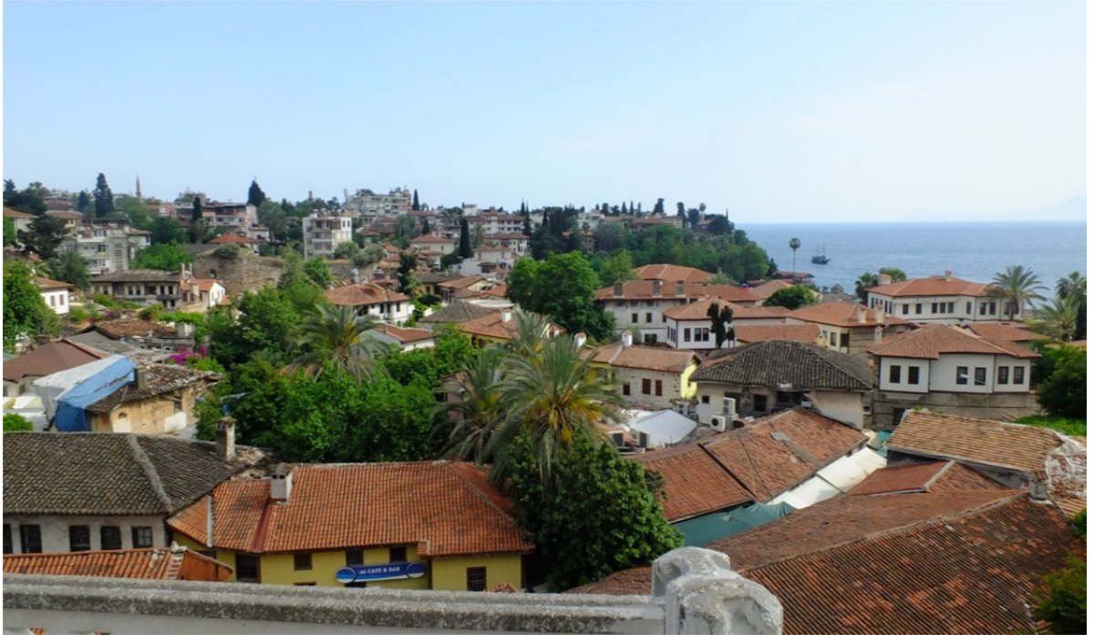
Res. 2: Antalya Kaleiçi Diğer Bir Genel Görünüm