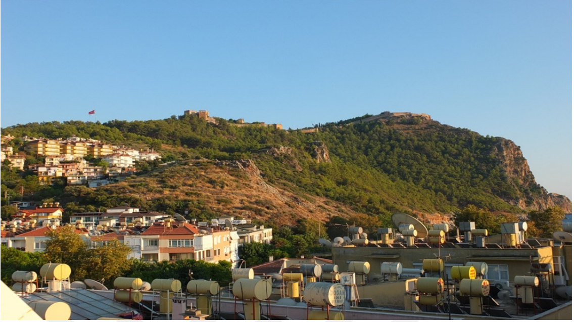
Res. 24: Alanya Kalesi