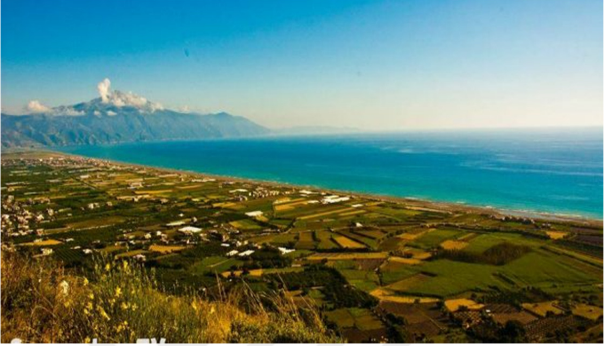
Res. 42: Samandağı (Süveydiye) Sahili