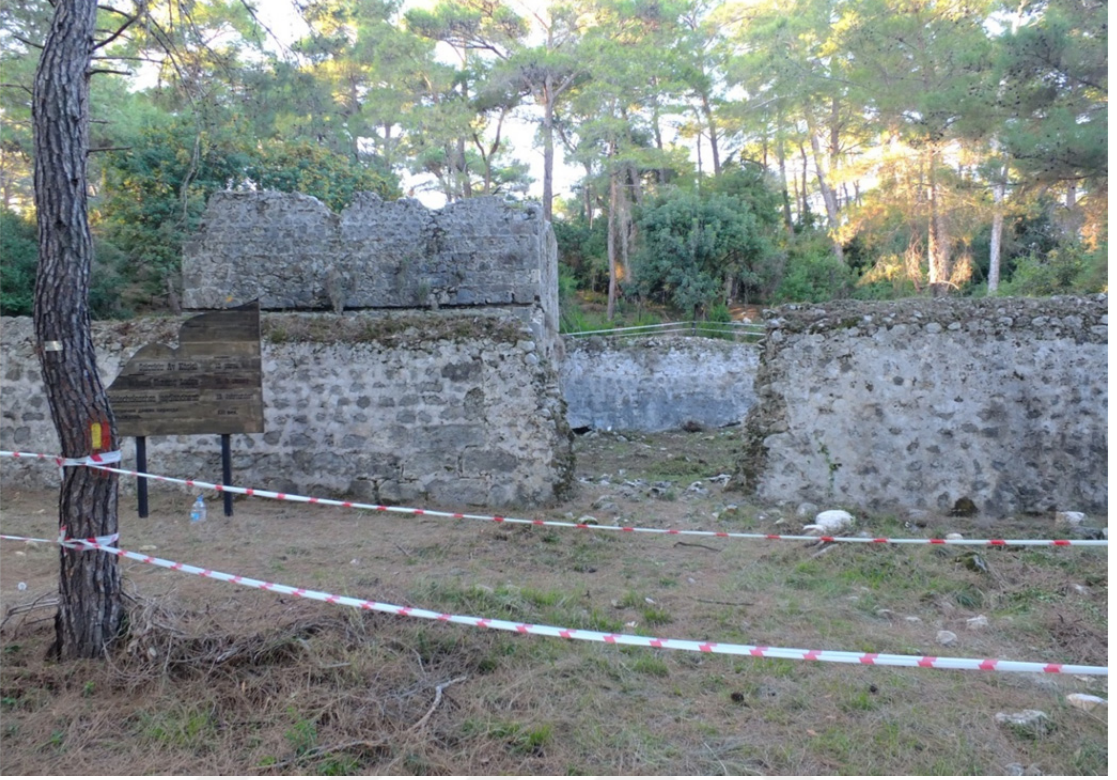
Res. 18: Antalya-Kemer Selçuklu Av Köşkü