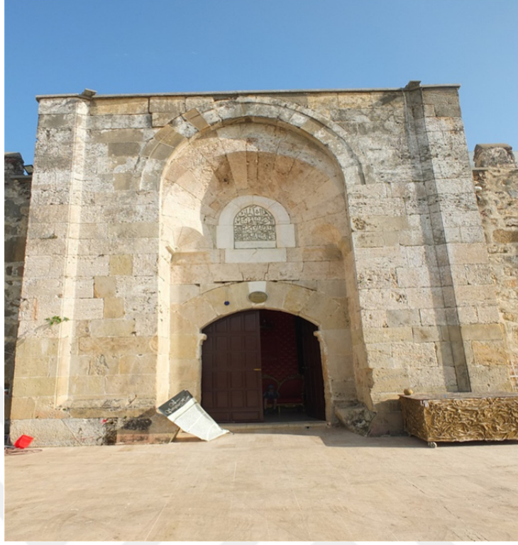
Res. 34: Şarapsa Han Giriş Portalı ve Kitabesi