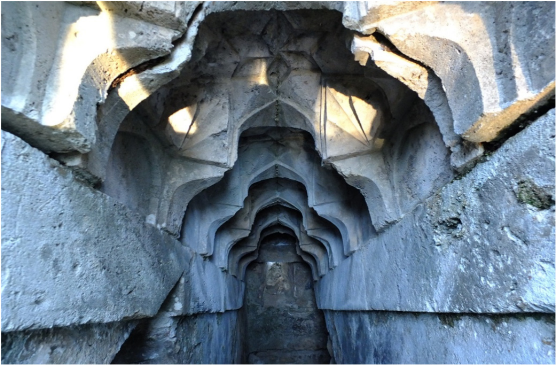
Res. 19: Antalya-Kemer Selçuklu Av Köşkü Merdiven Üstü Detayı