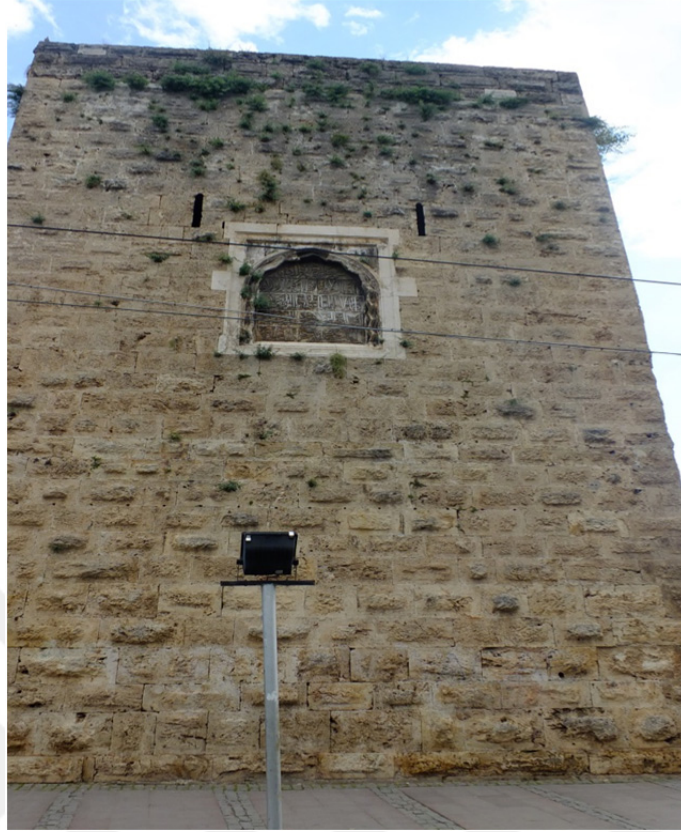
Res. 12: Antalya Surları Burç Detayı