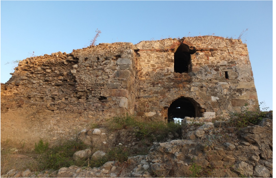
Res. 37: Alanya Sedre Selçuklu Av Köşkü