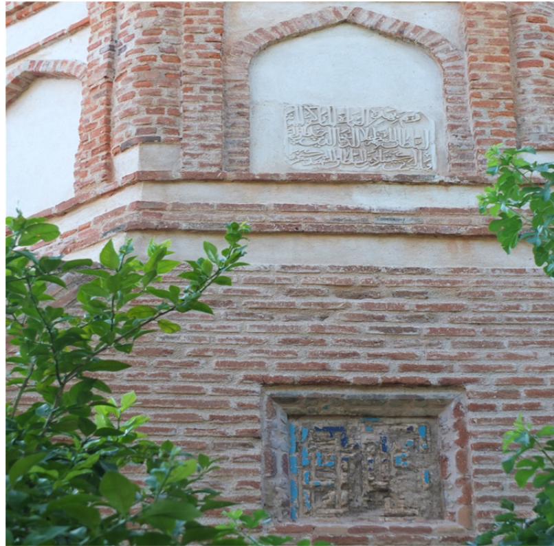
Res. 10: Antalya Yivli Minare Kitabesi