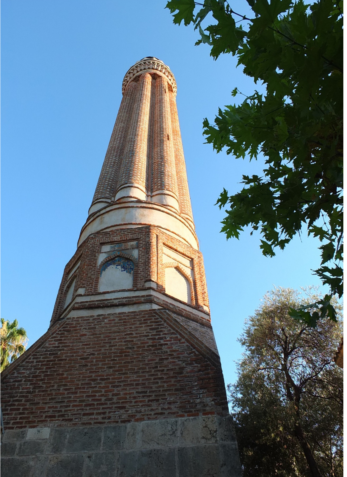
Res. 11: Antalya Yivli Minare Detayı