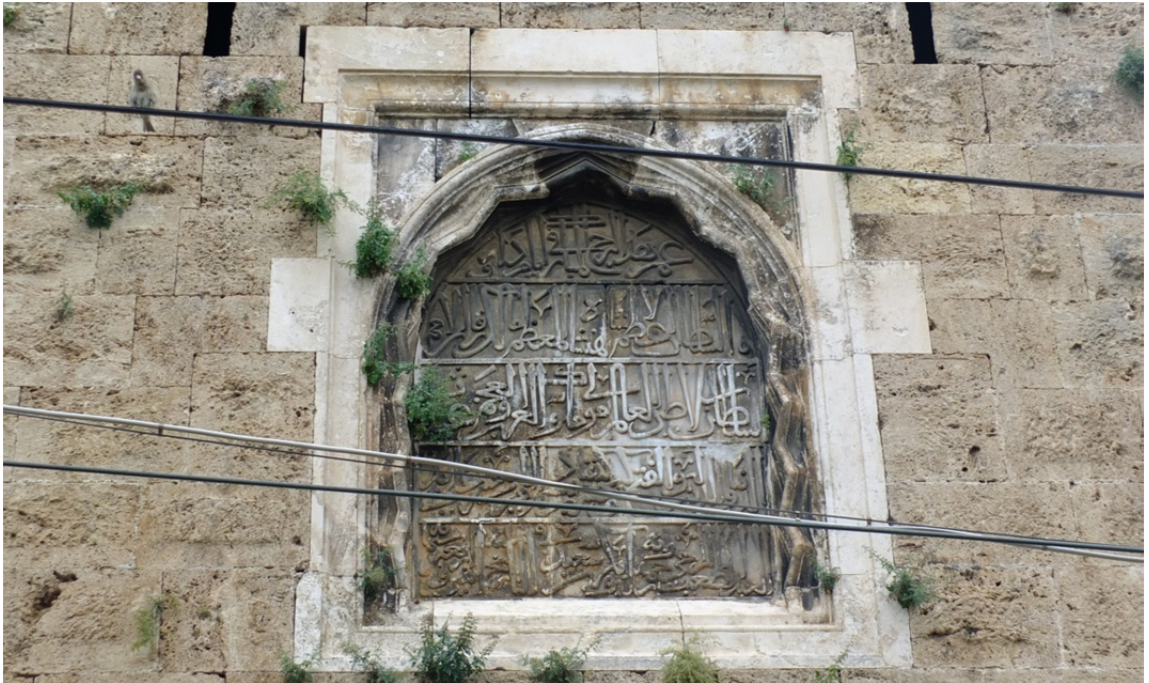
Res. 13: Burç Üzerinde II. Gıyaseddin Keyhüsrev'e Ait Kitabe Detayı