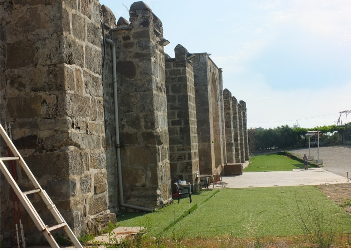
Res. 36: Şarapsa Han Yandan Görünüş