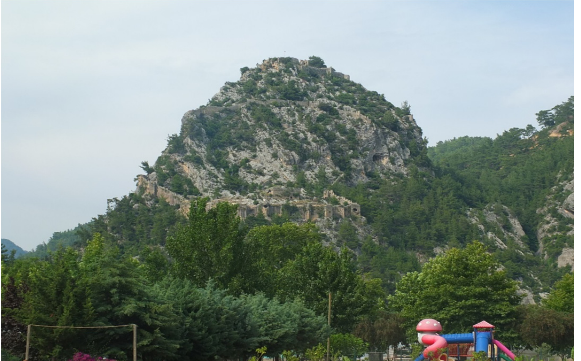
Res. 31: Alara Kalesi Genel Görünüş