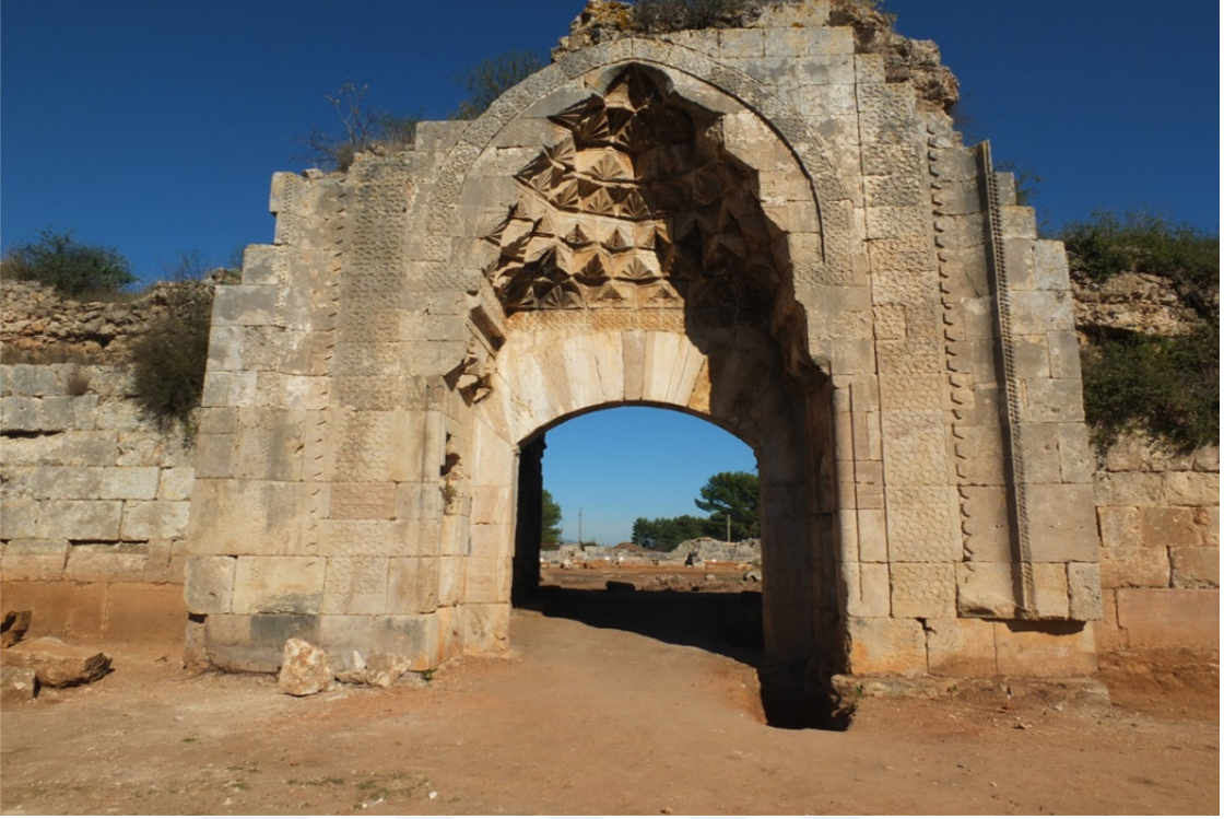
Res. 20: Antalya Evdir Han Giriş Portalı