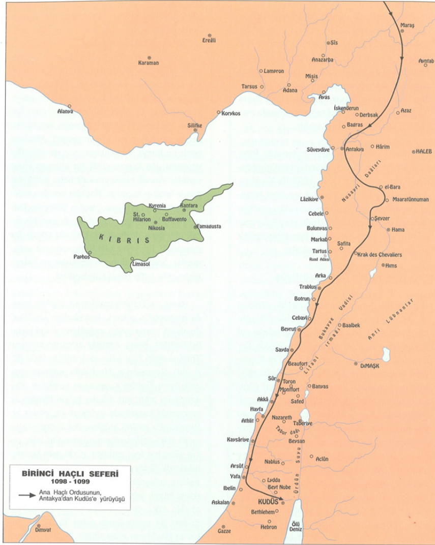
Har. 3: Suriye-Filistin Kıyıları (Demirkent 2004 2 , 48)