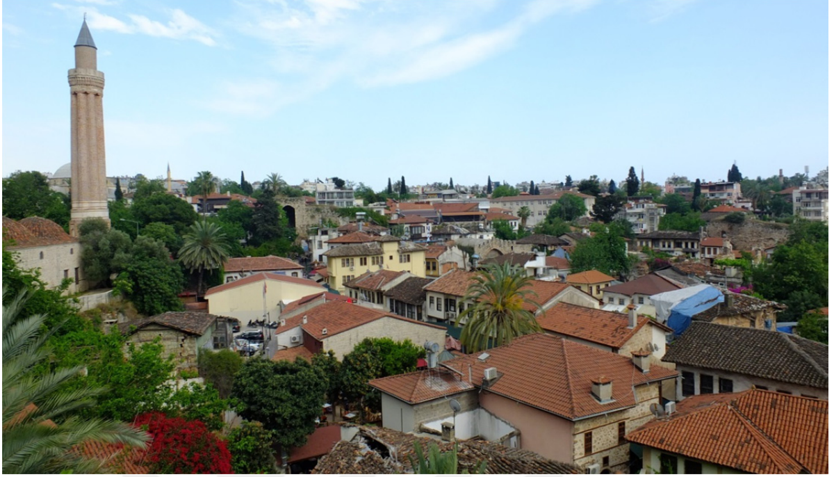
Res.1: Antalya Kaleiçi Genel Görünüm