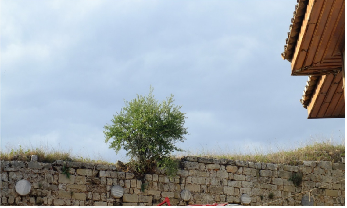
Res. 7: I. İzzeddin Keykavus Fetihnâmesi Parçaları