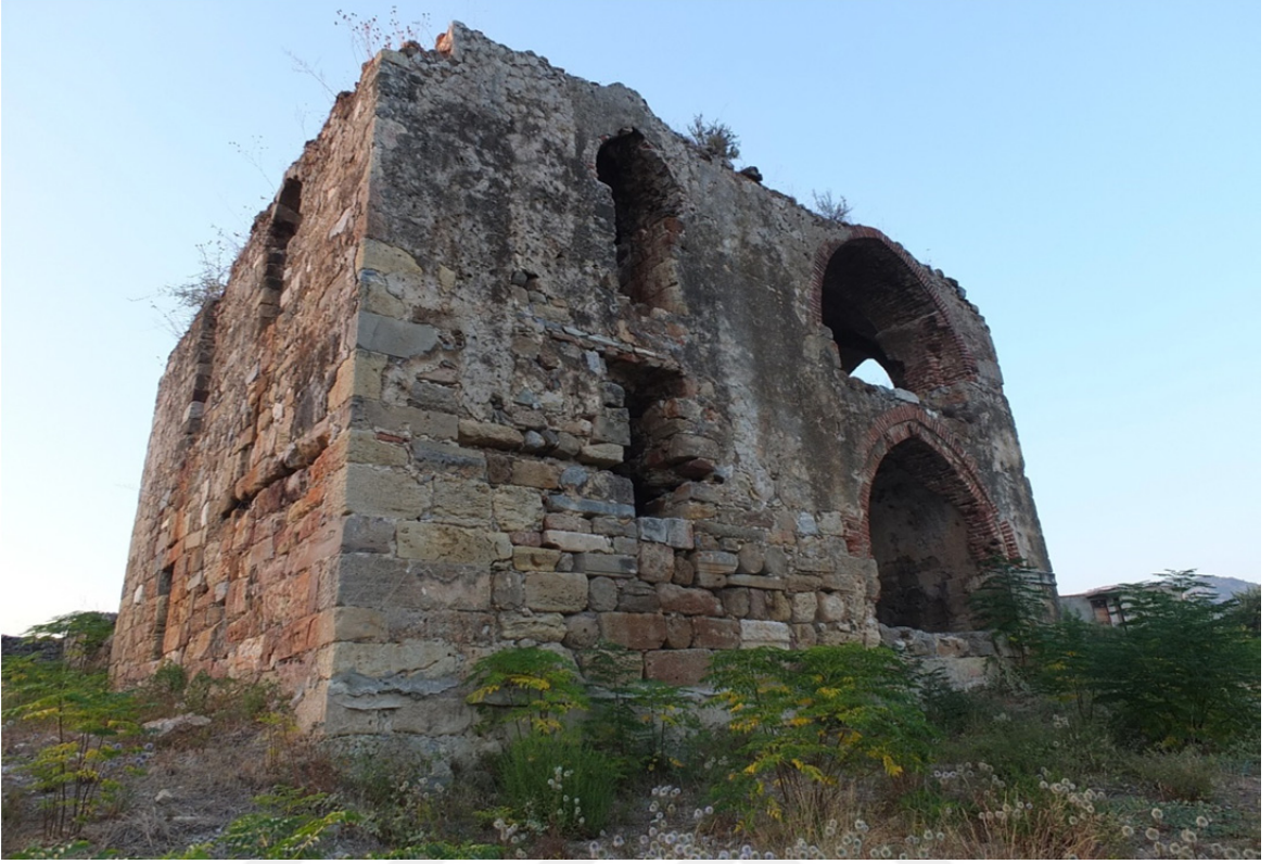
Res. 38: Sedre Köşkü Diğer Bir Görünüş