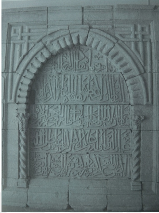
Res. 14: II. Gıyaseddin Keyhüsrev'e Ait Kitabe Detayı (Yılmaz – Tuzcu 2010, 37) Kitabe Antalya Müzesi'nde Env. No: 14 ile sergilenmektedir.