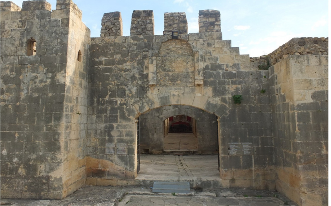
Res. 33: Alara Han Giriş Portalı ve Kitabesi