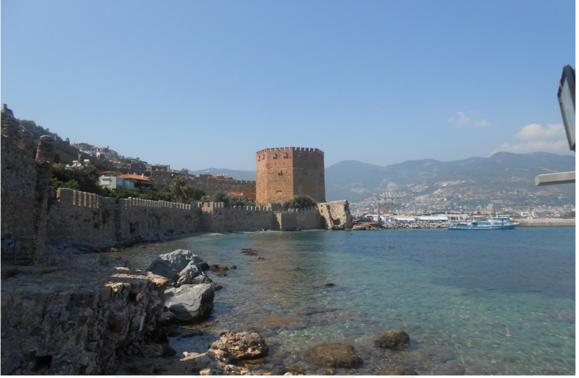
Res. 26: Alanya Tersanesi'nden Kızıl Kule'nin Görünüşü