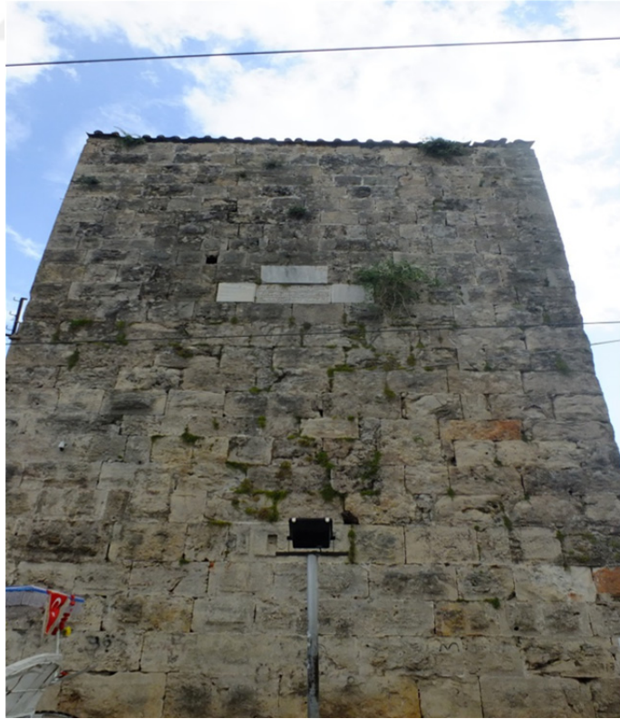
Res. 15: Antalya Surları Burç Detayı