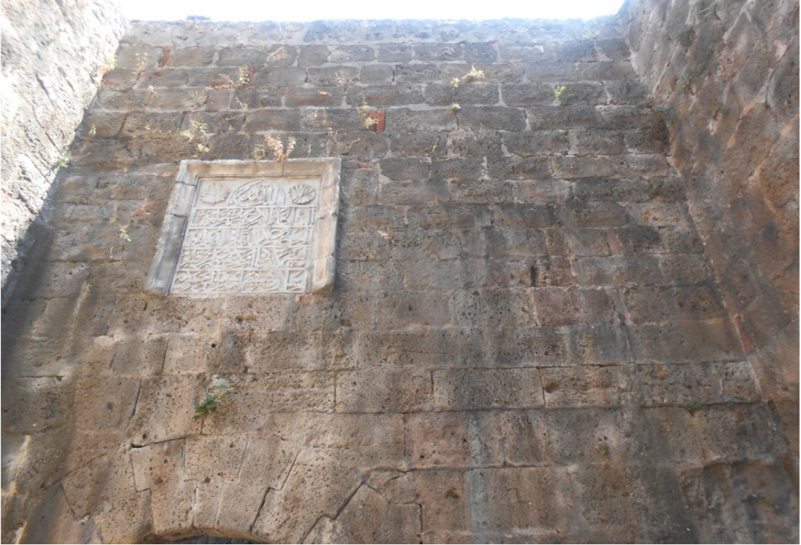
Res. 29: Alanya Tersanesi Kitabesi