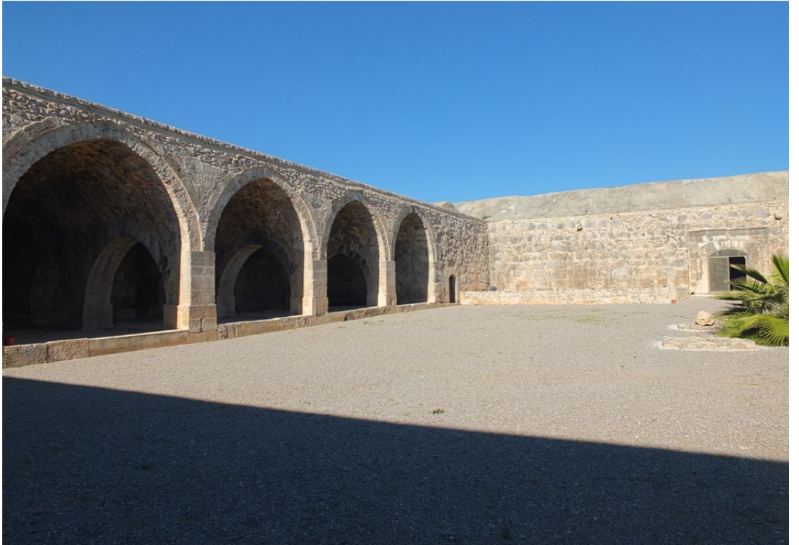
Res. 23: Antalya Kırk Göz Han İç Görünüş