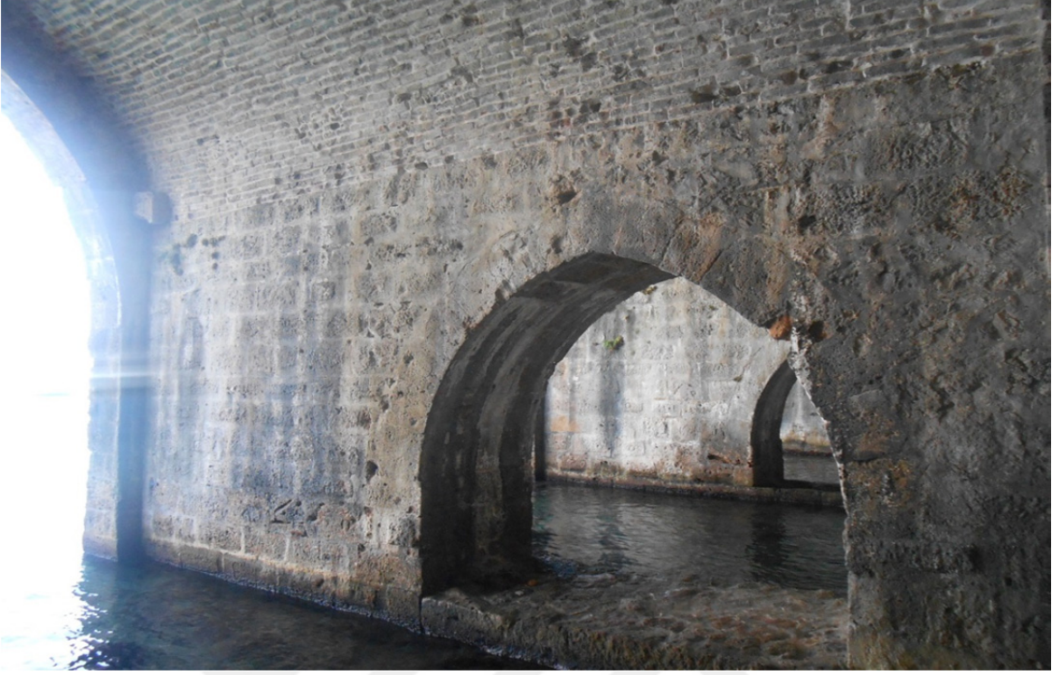
Res. 30: Alanya Tersanesi İç Detayı