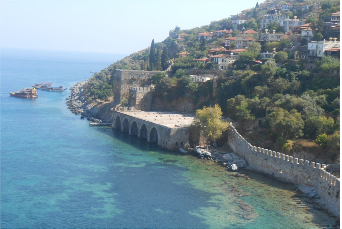
Res. 27: Kızıl Kule'den Alanya Tersanesi'nin Görünüşü