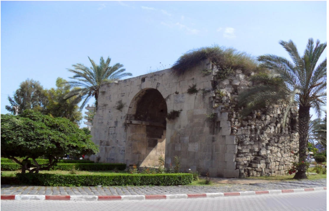
Res. 39: Tarsus Kleopatra Kapısı