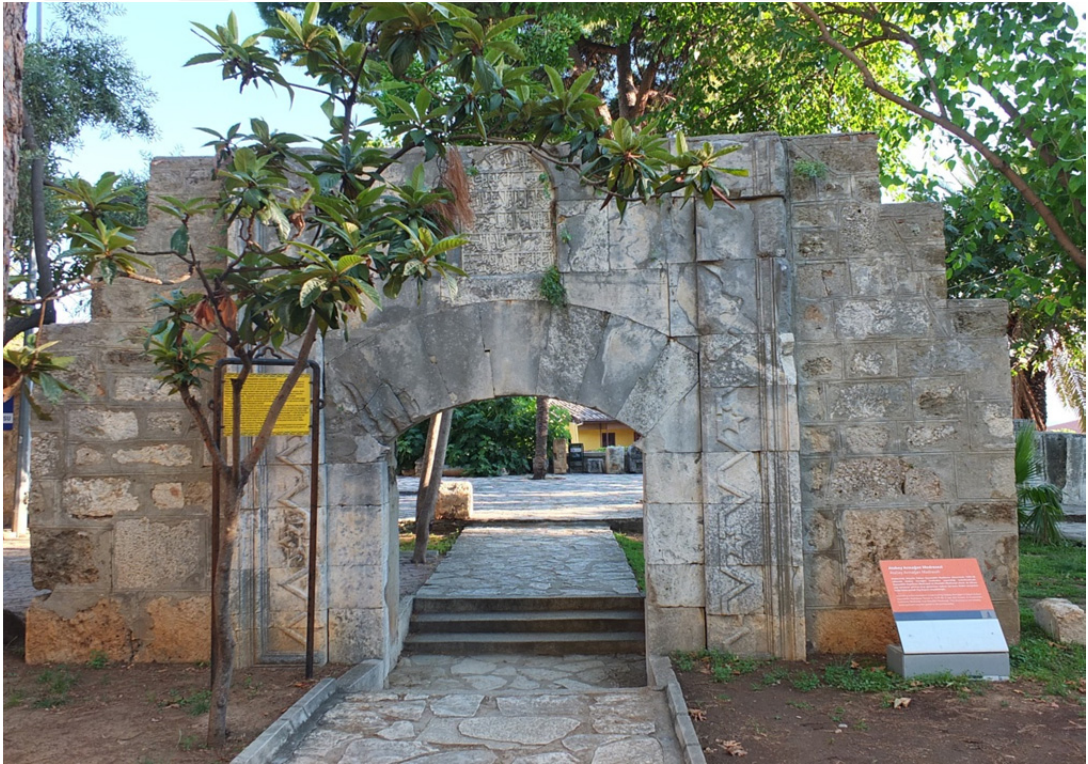
Res. 17: Atabey Armağan Şah Medresesi Portalı