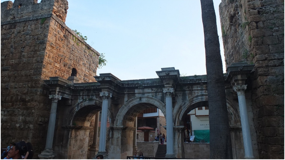
Res. 3: Antalya Hadrianus Kapısı (Üç Kapılar)