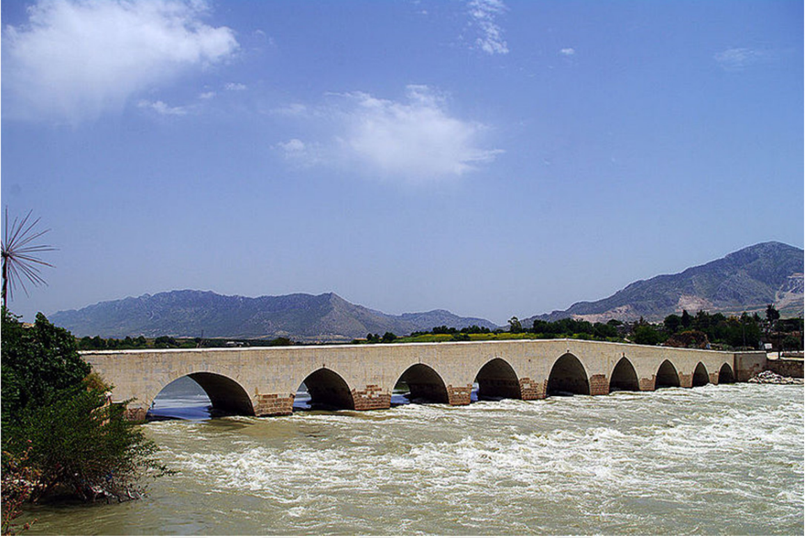
Res. 40: Misis Köprüsü