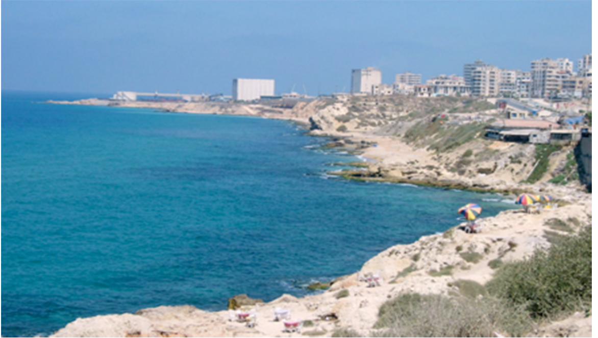
Res. 43: Lazkiye Kıyıları