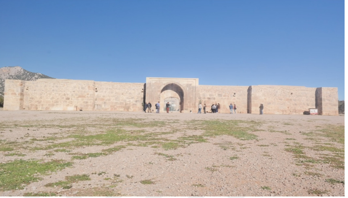
Res. 22: Antalya Kırk Göz Han