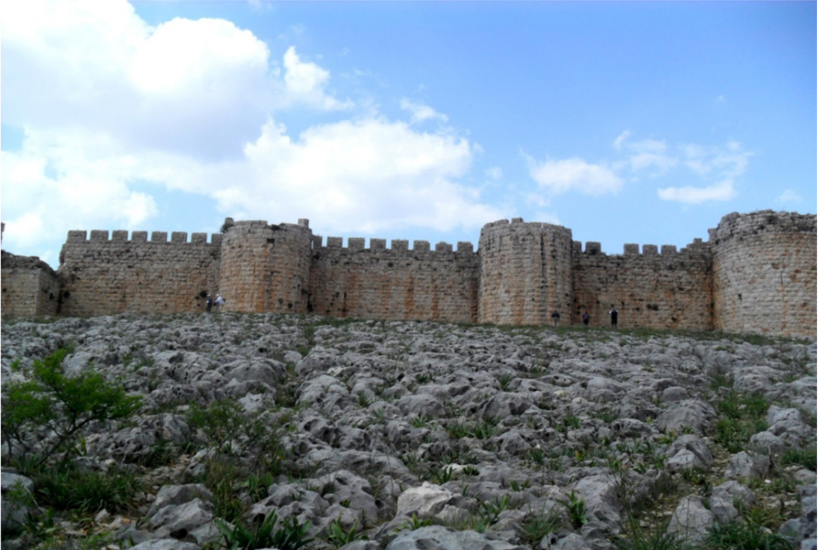
Res. 41: Anazarba Kalesi (Erişim Adresi wikipedia.org 25.05.2017)