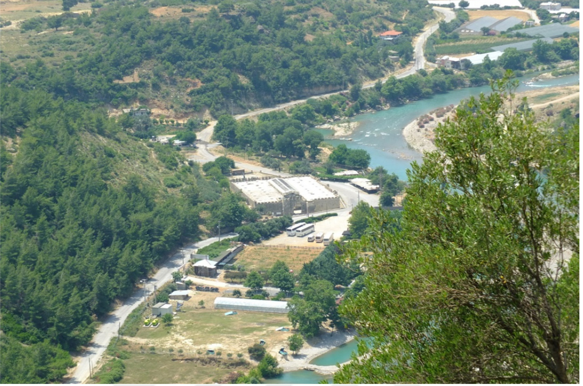
Res. 32: Alara Kalesi'nden Alara Han'ın Görünüşü