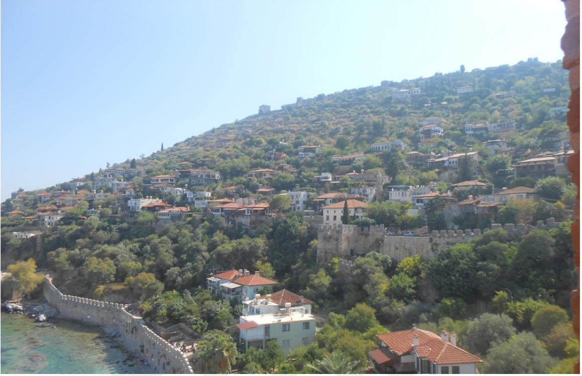
Res. 28: Kızıl Kule'den Alanya Kalesi'nin Görünüşü