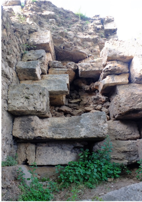
Res. 16: Antalya Surlarından Yapı Detayı