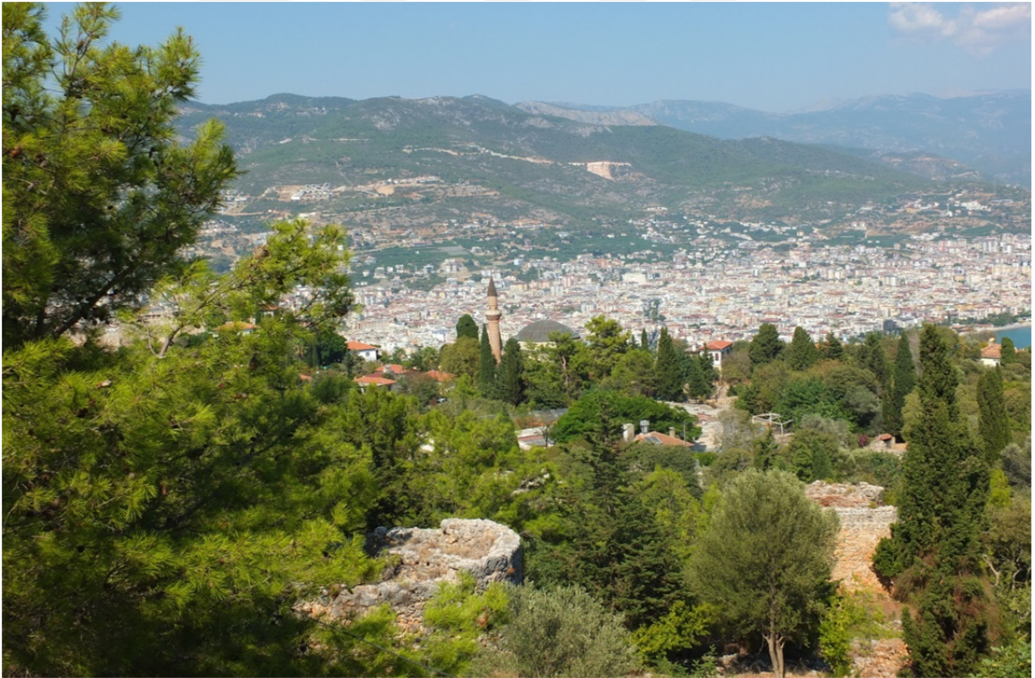
Res. 25: Alanya Kalesi'nden Alanya ve Alaeddin Camii'nin Görünüşü