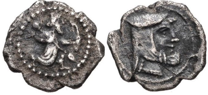
Resim 1: Ön yüzünde Datames portresi (?) bulunan bir obol

Suriyeliler” anlamına gelen bir isimlendirmedir 119 . Zira Herodotos (I. 72. 1) Kappadokialıların Hellenler tarafından Suriyeliler olarak isimlendirildiğini ve Halys’ün sağında kalanların Paphlagonialılar solunda kalanların ise Kappadokialı Suriyeliler olarak isimlendirildiğini belirtirmiştir. Diğer ta-