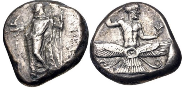
Resim 3: Tiribazos'a (MÖ yak. 440- 370) ait stater

ortalarında bu göreve başladığı düşünülürse II. Artakserkses'in ordusunun başında bizzat katıldığı savaş Kadusialılara karşı olanıdır. Ancak Diodoros ve Plutarkhos'tan öğrendiğimiz kadarıyla kral muhtemelen iki kez Kadusialılar üzerine