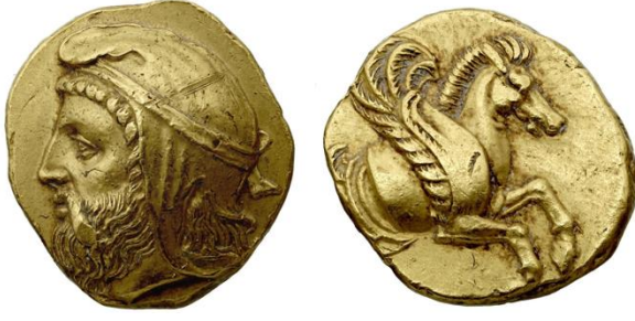
Resim 10: Orontes'e ait altın sikke

Kıbrıs Seferi'nin ardından Doğu Ar- menia satraplığından alınıp Daskyleion sat- raplığına bağlı Mysia'ya (Weiskopf, 1989: 72) satrap yardımcısı ( hyparkhos ) olarak ata- nan Orontes'in Kappadokia satrapı Datames ve Daskyleion satrapı Ariobarzanes'in is- yanlarına yaklaşımı da bilinmezliğini koru-