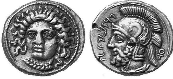
Resim 7: Kilikia Tarsus'tan Pharnabazos'a (MÖ yak. 387-363/362) ait stater