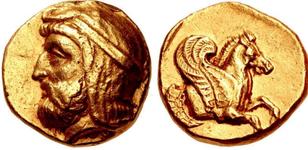
Resim 11: II. Artabazos'a ait stater

talebinin isyanın nedeni mi yoksa sonucu mu olduğu tam olarak anlaşılamamaktadır. Yine de paralı askerlerin, Genç Kyros örneğinde olduğu gibi 198 , Daskyleion satrapı II. Artabazos'u isyan sırasında askeri anlamda rahatlattığı söylenebilir.