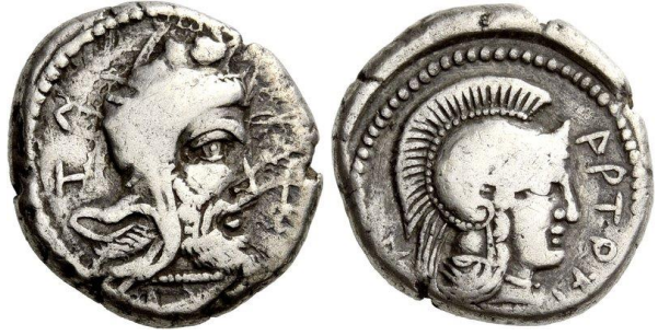
Resim 4: Artumpara'ya (MÖ yak. 400-370) ait sikke

Küçük Asya'nın güney kıyısındaki Lykia, MÖ VI. yüzyılda Pers komutan Harpagos tarafından ele geçirilmesinden (Hdt. I. 171) itibaren -MÖ V. yüzyılın ikinci yarısındaki Attika-Delos Deniz Birliği'ne dahil olmasını 167 çıkartırsak- yaklaşık bir buçuk asır boyunca Pers yanlısı yerel dynastes -