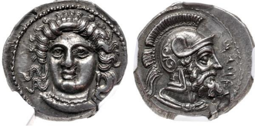
Resim 2: Datames'e ait Kilikia'da ele geçmiş stater (Aramice "TRKMW" lejantlı)

Cornelius Nepos, Datames'in Kadusialılara karşı savaşta kendisini gösterene kadar kralın sarayında muhafız birliği olarak bulunduğunu belirtir. Ne antik metinlerde ne de kraliyet arşivlerinde yeterince veri bulunmadığından dolayı Akhaimenid saray muhafızları üzerine söylenebilecek çok az şey vardır. Ancak muhtemelen Herodotos'un (VII. 83) bahsettiği Ölümsüz Onbinler 123 ordusunun bir kısmı saray muhafızlarına denk geliyor olabilir. Zira onbin kişiden oluşan bu seçkin birlik sefer sırasında kralın yanbaşında ve mızrakları ellerinde durarak kralı korumaktaydılar. Bu birliğe girenler -tıpkı Kamisares gibi- Persler arasındaki en soylu insanların çocuklarıydı 124 . Ölümsüz Onbinler arasından seçilen en iyi askerlerden oluşan bir grubun da Pers kralını korumakla görevli olduğunu düşünebiliriz. Herodotos (III. 139) daha önceden bu gruba Dareios'un da dahil olduğunu bildirmektedir. Eğer gerçekten Datames, Ölümsüz Onbinler birliğine (veya Ölümsüz Onbinler içerisindeki seçkin askerlerden oluşan ve kralı koruyan birliğe 125 ) dahil olduysa eğitimini sarayda tamamladığı, yirmili yaşlarının başında kraliyet muhafızı olduğu ve Kral II. Artakserkses ile birlikte -Kadusialılara karşı düzenlenen de dâhil- seferlere katıldığı söylenebilir.