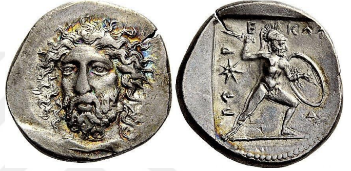
Resim 5: Limyralı Perikle'ye (MÖ yak. 380-360) ait sikke

Bununla birlikte Perikle ile Akhaimenid elitleri arasındaki çatışmanın başka nedenleri de olabilir. Bryce'a (1980: 379 vd.) göre Perikle, MÖ V. yüzyılda yaşamış olan ve Atina'nın altın bir dönem geçirmesini sağlayan ünlü Perikles'i kendisi için rol model almaktaydı. Tıpkı onun Atina'nın tam bağımsızlığını