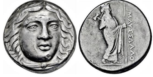
Resim 6: Mausolos'a (MÖ yak. 410-353) ait tetradrahmi

Orontes ile olan yakınlığı bu görevlendirmede önemli rol oynamış olabilir. Çünkü her iki satrapın da II. Artakserkses'in kızıyla evli olduğu bilinmektedir 149 . Bununla birlikte kralın Ariobarzanes'e karşı açıkça tavır aldığına yönelik kaynaklarda herhangi bir iddia yoktur.