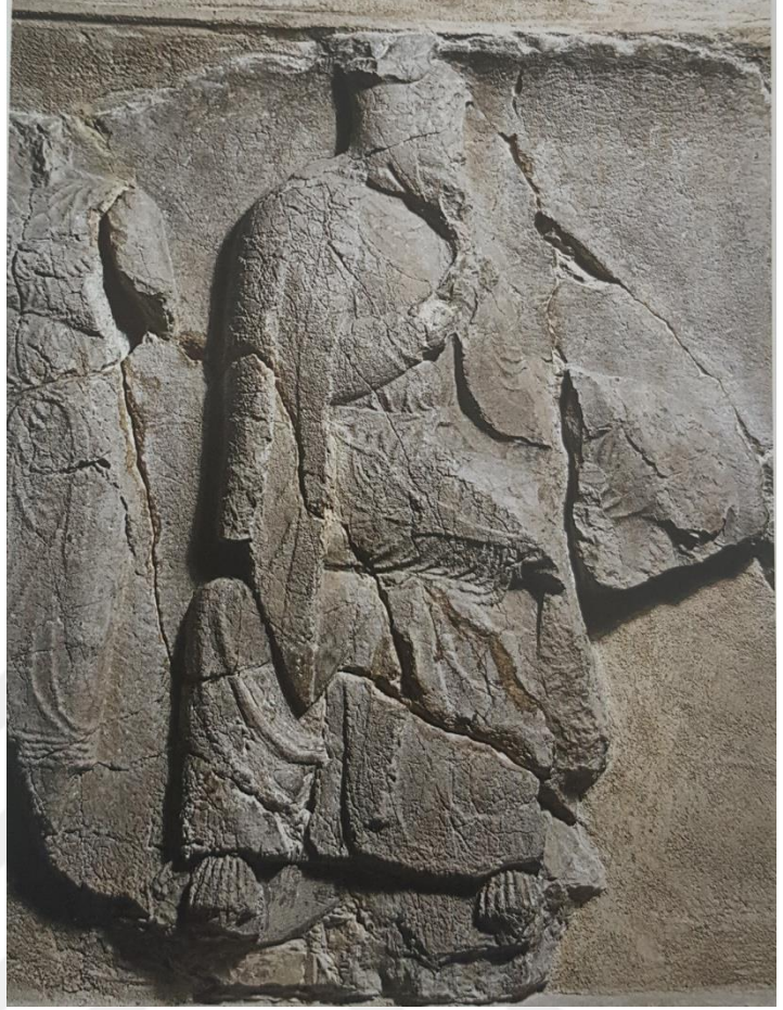
Resim 5: Payava Lahdi'in batı yüzünde oturmuş halde Sardeis Satrapı Autophradates

atanmış (Kuhrt ve Sancisi-Weerdenburg, 2002: 1802) ve babasının yaklaşık yirmi yıldır satraplık yönetiminde izlediği siyaseti devam ettirmeye gayret etmiştir. Ancak Ariobarzanes'in satrap olarak atandığı MÖ 387 yılıyla gerek isyanlarda rol almasıyla gerekse Hellas'ın iç meselelerine karıştığı MÖ 360'lı yıllara kadar satraplık kariyerinin yaklaşık yirmi yıllık bir zaman dilimi üzerine bilinenler oldukça azdır. Satrap isyanları üzerine son dönemlerde yayımlanmış en önemli eserlerden birinin yazarı olan M. Weiskopf (1989: 31-32) bu aşamada Daskyleion satrapının Akhaimenid çıkarlarına ters düşecek herhangi bir faaliyetinin olup olmadığına yö-