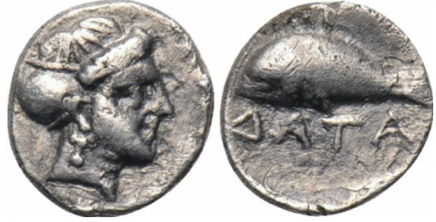
Resim 4: Sinop'ta bulunmuş Datames'e ait Hellence "DATA" lejantlı obol

Polyainos ( strat. XXI. 5) bir başka paragrafında Datames'in Sinop'u ele geçirmeden kralın geri çekilmesine dair verdiği emirle kuşatmayı kaldırdığını belirtmektedir: “ Sinop'u kuşatırken Datames kraldan derhal kuşatmayı kaldırmasının emredildiği bir mektup aldı... Mektubu okur okumaz krala sadakatini bildirdi ve kraldan özel bir