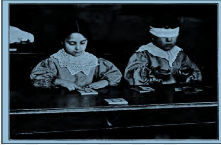
Fotoğraf 1 : Çocukların dokunsal ve stereognostik duyuları ile deney