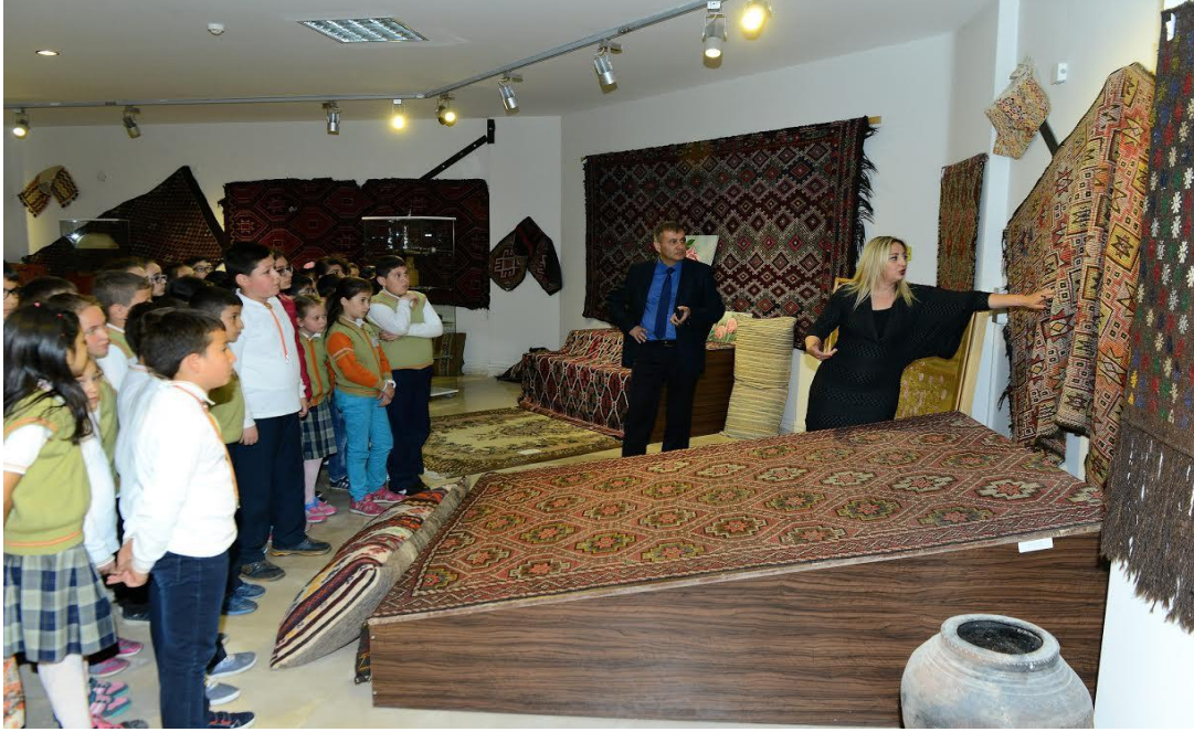
Resim 6. Sosyal Bilgiler Dersinde Müze Ziyareti

Öğrenciler Başkan Yardımcısı Recep Erdem'den aldıkları bilgilerin ardından Belediye Meclisi Salonu'na geçerek, meclis çalışmalarıyla ilgili de burada bilgiler aldı. Öğrenciler Meclis sıralarını doldururken, öğrenciler arasından Meclis Başkanı, katipler yerlerini aldı. Burada meclis üyesi öğrenciler, meclis başkanından Isparta ve okulları için yapılmasını istediklerini aktarırken, konu meclis başkanı tarafından da cevaplandırılırken, meclis toplantılarının işleyiş şekilleri hakkında bilgiler aldılar.