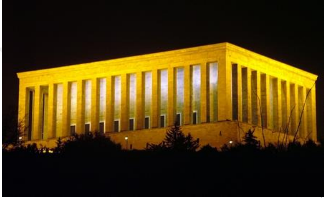
Resim 8. Anıtkabir

Özellikle Türkiye Cumhuriyeti'nin kurucusu Mustafa Kemal Atatürk'ün siyasi yaşamının daha iyi anlaşılmasında onun yaşamıyla ilgili mekânların kullanımı Atatürkçülük konularının öğretimi açısından da çok önemli bir yere sahiptir. Anıtkabir, Atatürk evleri, yaşadığı köşk ve saraylar, Atatürk'ün hayatının anlaşılmasında inceleme gezisi yapılacak mekânlar arasında yer alır.