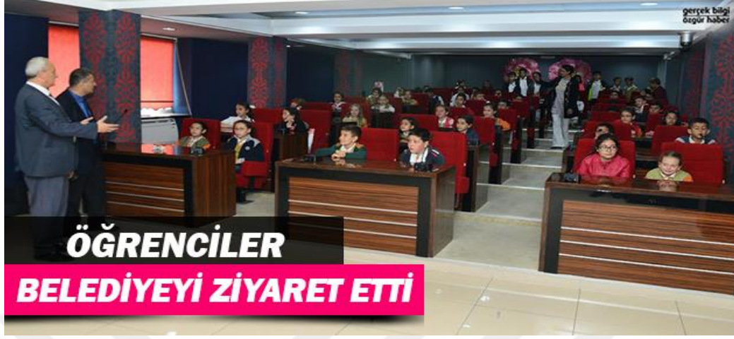
Resim 5. Belediye 'de Sosyal Bilgiler Dersi

(...) İlkokulu 4.sınıf öğrencileri, Isparta Belediyesi'ni ziyaret etti.