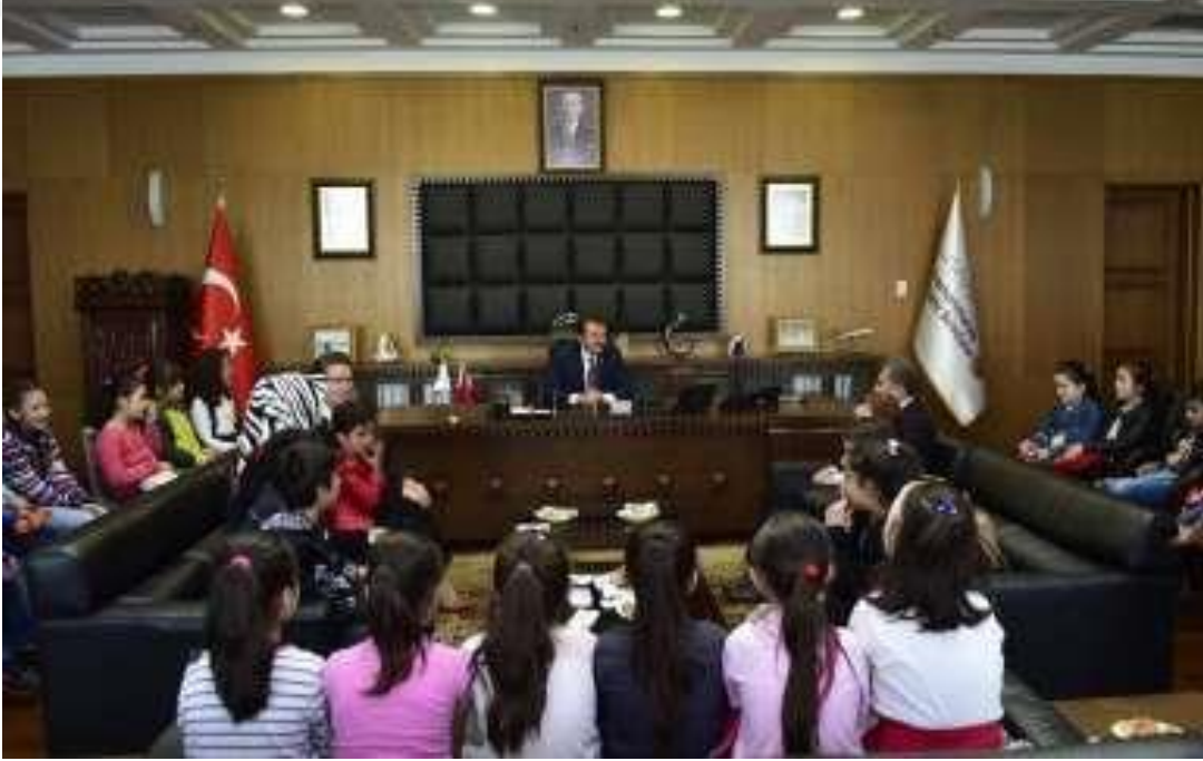
Resim 2. Öğrenciler Başkan'ın Makamında