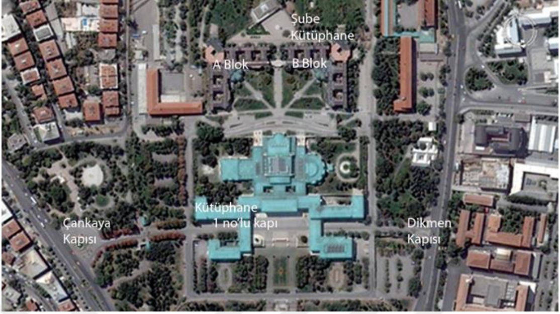
Resim 1. TBMM Krokisi