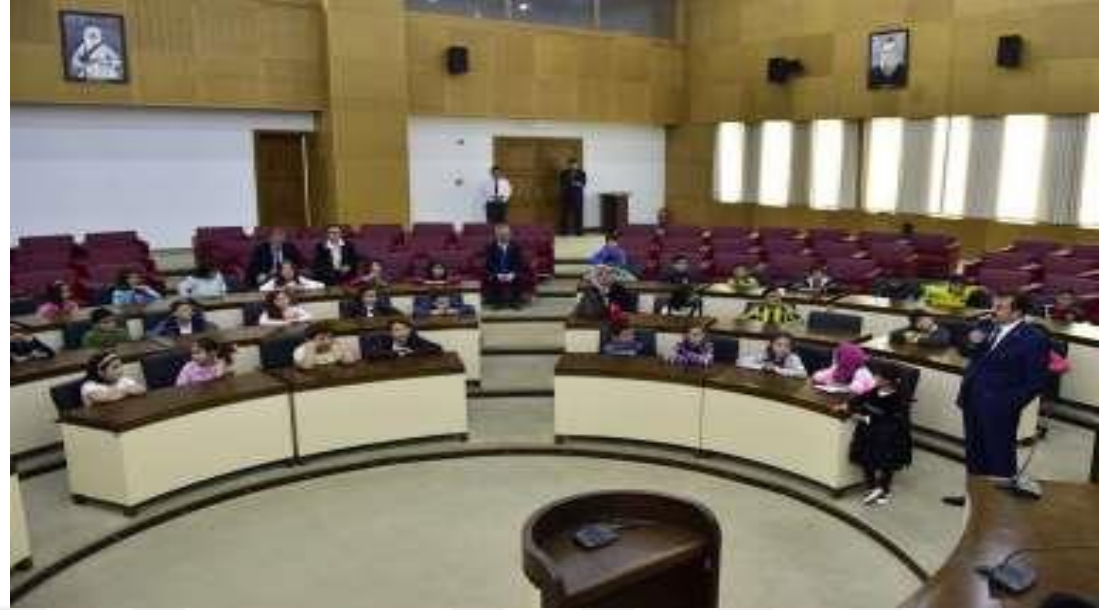
Resim 3. Öğrenciler Meclis Salonunda

(...) İlkokulu 4/İ ve 4/B sınıfı öğrencileri Sosyal Bilgiler Dersi Yerel Yönetimler konusunu Büyükşehir Belediye Meclis Salonunda işlediler.