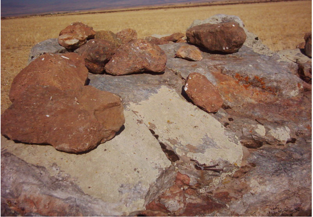
Fotoğraf -5: Afakan Taşı Üzerine Çakılan Çiviler