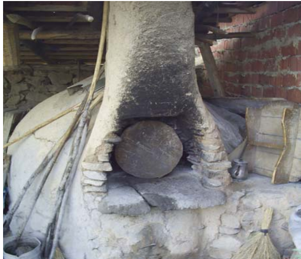
Foroğraf -20: Yumruca Köyü Ocak