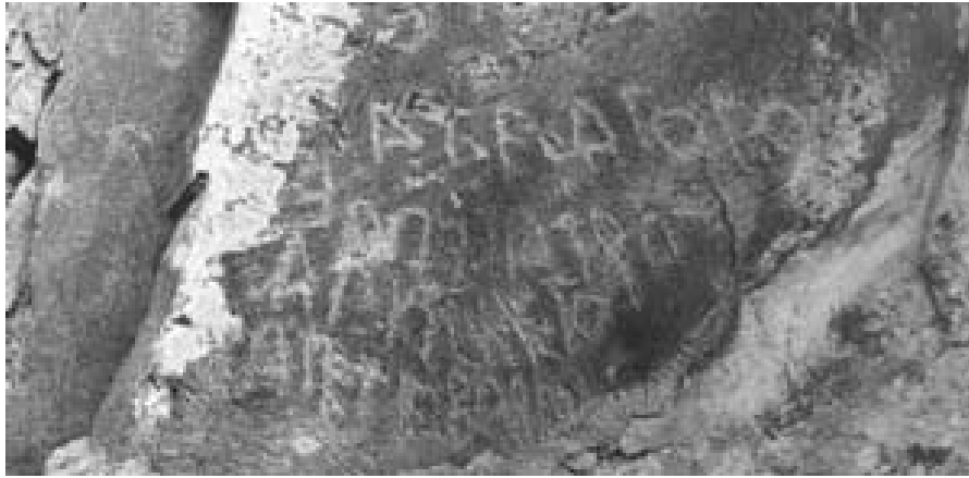
Fotoğraf -9: Gelincik Kayası