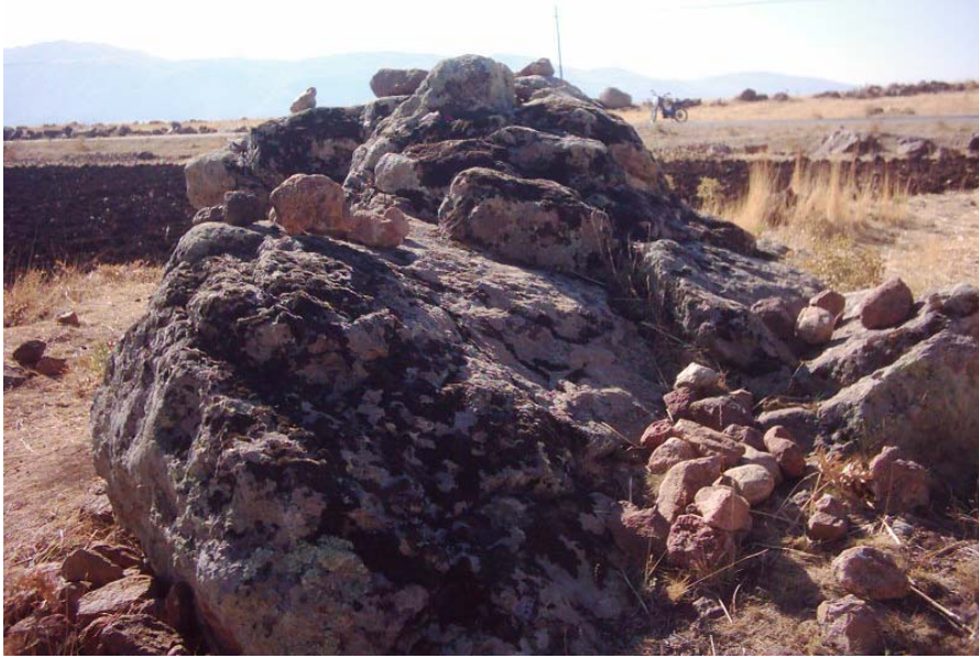
Fotoğraf -7: Afakan Taşı Üzerine Bırakılan/Yapıştırılan Taşlar