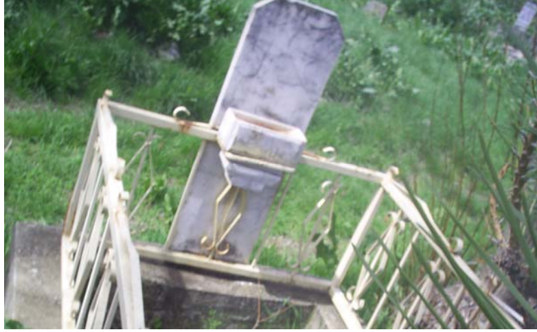
Fotoğraf -18: Alamescit köy mezarlığında kabir üzerinde bulunan su sunağı.