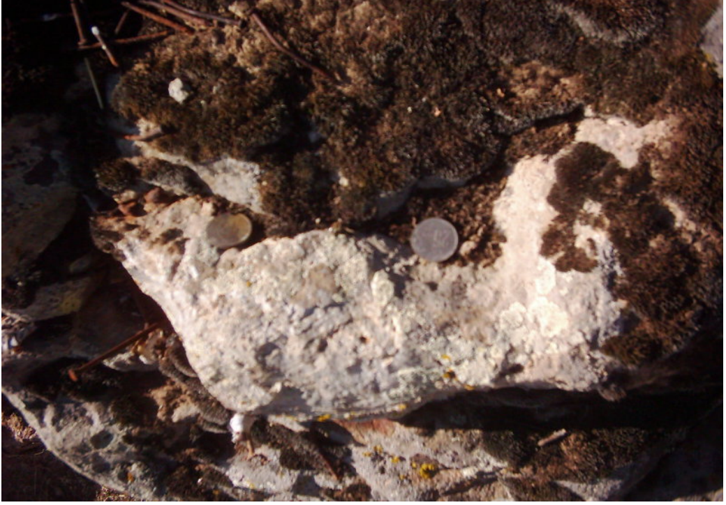
Fotoğraf -4: Afakan Taşı Üzerinde Bozuk Paralar