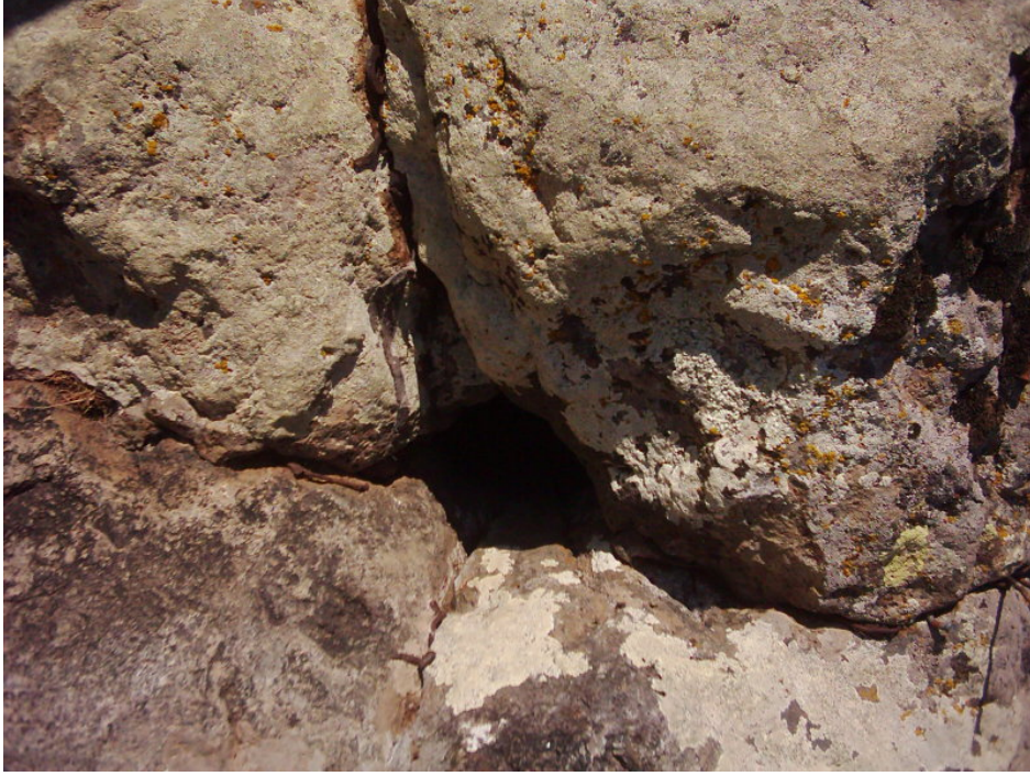
Fotoğraf -8: Afakan Kayasında Yer Alan Delikli Taş