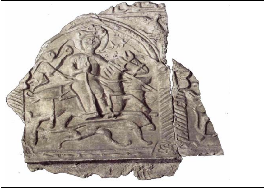
Resim 3: Av Sahneli Alçı Pano