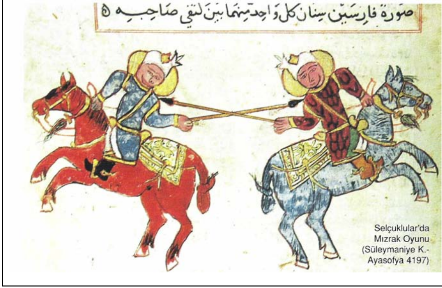
Resim 9: Selçuklularda Mızrak Oyunu,