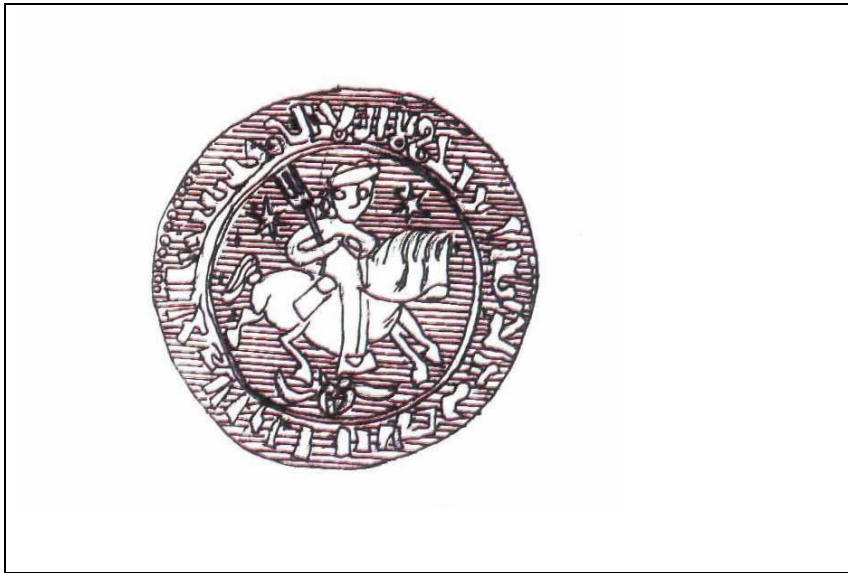
Resim6: II. Süleyman Şah Dönemine Ait Para Çizimi