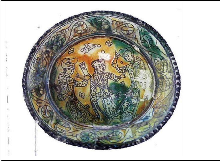
Resim 10: 13.yüzyıla Ait Rakkase Figürlü Seramik Tabak,