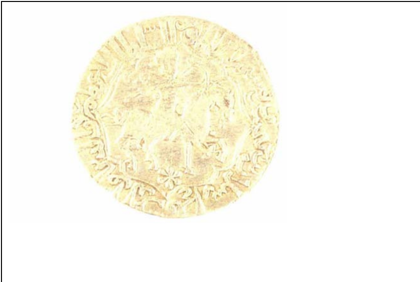
Resim 4: IV. Kılıç Arslan Dönemine ait, ok ve yay figürlü sikke