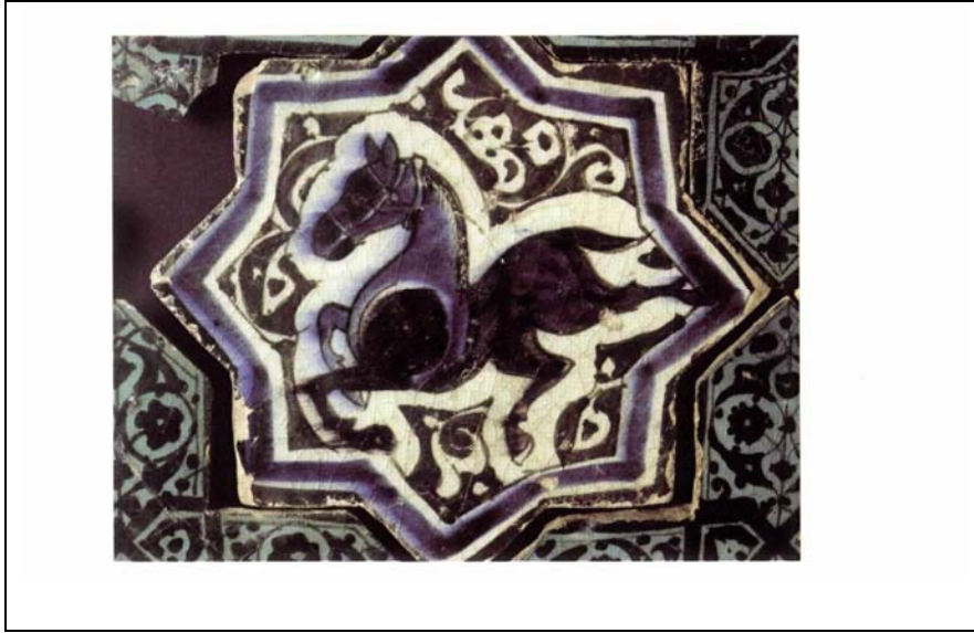
Resim 5: At Figürlü Çini