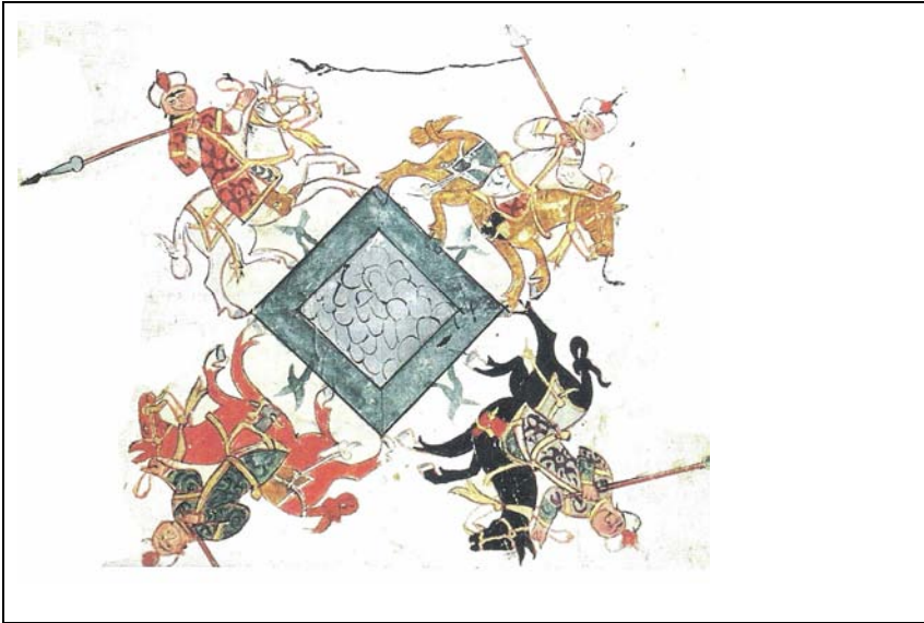
Resim 8: Selçuklularda Bir Cirit Oyunu