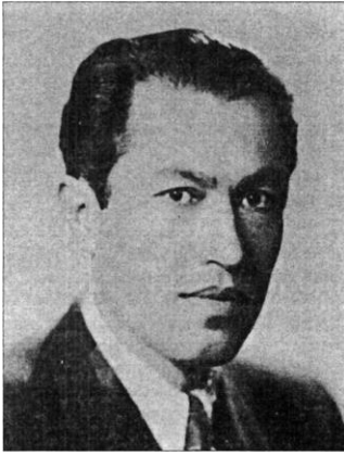
Ömer Lütfi Ülkümen