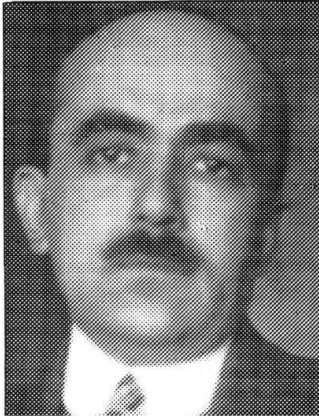
Y. Kadri Karaosmanoğlu