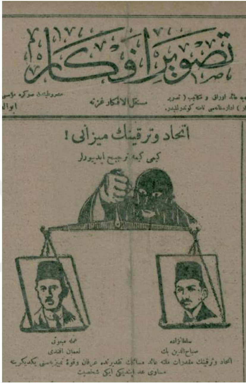
Ek 9. Tasvir-i Efkâr'dan bir karikatür örneği.