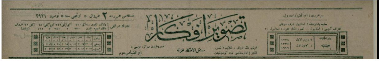
Ek 1: Tasvir-i Efkar'ın Başlık Klişesi