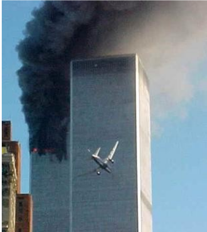
Fotoğraf 1. People Dergisinin 24 Eylül Tarihli Baskında kullanılan Fotoğraf

sürecin ilginç bir yönünü belirtmişlerdir: 11 Eylül gözler önüne serildikçe ulusal haber dergileri terörist saldırıların özetini açıklayan özel konuları bir araya getirmeye çalışmıştır. Bir araya gelen editörlerin endişeleri arasında günün anlam ve önemini özetleyecek haber fotoğraflarının seçimi vardı. People‘ın 24 Eylül tarihli baskısı ise ilk kule alevler içindeyken Dünya Ticaret Merkezi’ne çarpmak üzere olan siyah tonlu ikinci uçağın ve kapkara bir duman içinde kalan Manhattan semalarının görüntüsünü yayınlamıştır (fotoğraf 1) . Newsweek özel baskısı ilk uçağın etkisiyle oluşan patlamayı göstermiştir (fotoğraf 2). Her biri terörist eylemlerin kendisine odaklanmıştır. Tekrarlanan olaylarla canlanan hafızalardan okuyucular devamında neyin geleceğini tahmin etmişlerdir. Fakat ilerleyen günlerde ve haftalarda tekrarlayan fotoğraf bunlardan biri değildi. Bunun yerine, 24 Eylül tarihli Newsweek kapağına taşınan bir çekimdi (fotoğraf 3). Burada 3 itfaiyeci bozulmadan kalmış Amerika bayrağını Dünya Ticaret Merkezi’nin enkazından korumaya çalışıyor. Bu da Joe Rosenthal’ın 2. Dünya Savaşı’nda Pulitzer ödülü kazanan Şubat 1945’te Suribachi Dağı’nın tepesine bayrağı taşıdığı fotoğrafını (fotoğraf 4) anımsatmaktadır (Griffin, 2004:384).