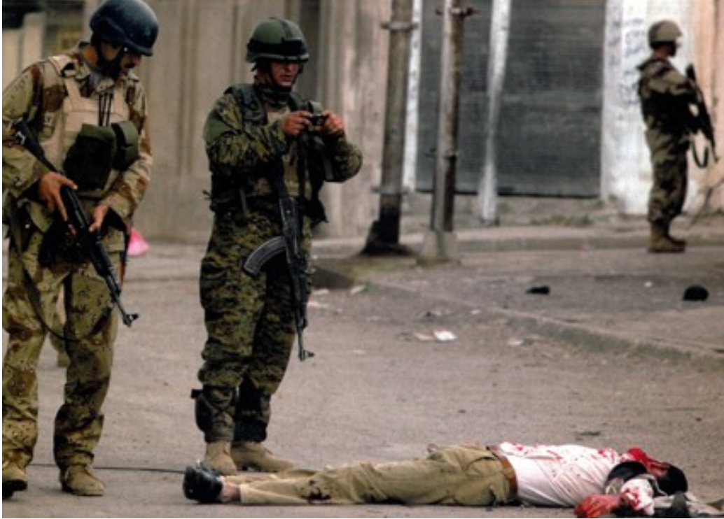
Fotoğraf 15. Blgede yařanan gerginliđi net bir Őekilde anlatan bir fotoğraf.

metinsel gnlklerin grevlerine gre arkadařlarına ve ailelerine hayatlarına dair grsel bilgiler verebilmek, moral depolayabilmek ve savař üzerine kurulu grsel haberler ekleyebilmek iin fotoğraf eker ve internette yayınlılar. Fakat fotoğraflar metinsel gnlkler veya diğeri metinsel aıklamalardan daha grsel fotoğraflamalardır. Pek ok durumda fotoğraflara metin eřlik etmez, grsel gnlklerin evrimii olarak sunulması iin tasarlanan foto gnlklerde paylařılır. Savař deneyimlerinin bu Őekilde grselleřtirilmesi derin “gereklik etkisi”ne sahip olan bir belgeleme ve ifade Őekli yaratarak askeri gnlklere yeni bir boyut kazandırmaktadır. Grntlerin sunumunda askerlerinin perspektifinin gerekliğinin altı izilmektedir.