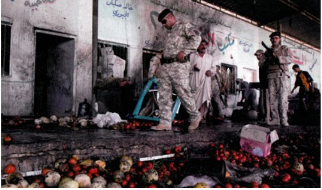
Fotoğraf 18. Irak askerlerinin bölgede yaşanan olayları incelerken çekilen fotoğrafları.

boşaltmasıyla birlikte oluşan istikrarsız düzenin oluşumunda siviller ön plandadır. Amerikan askeri sürekli yerel halkı gözetim altında tutma eğilimindedir. Bunun en açık kanıtı olarak toplama kamplarında tutulan binlerce suçlu suçsuz ve çoğunluğunu Irak halkının oluşturduğu esirlerdir.