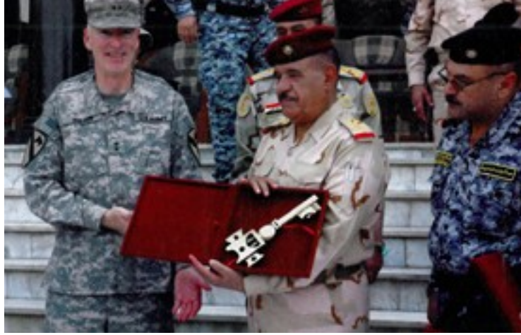
Fotoğraf 12. Amerikanın Irak'tan geri çekilme sürecinde meydana gelen olaylardan görüntüler.

Amerika'nın Iraktan çekilme süreci sonrasında kentte yaşanan kutlamalara yer verilen fotoğraflarda zırhlı araçlar dikkat çekmektedir. Kutlamalar çerçevesinde Irak askerlerini taşıyan araçların süslenmesi de bu bağlamda farklılık yaratmıştır. Araştırma kapsamında incelenen fotoğraflar arasında tek askeri lider görüntüsü yukarıdaki fotoğrafta yer almaktadır. Amerikan askerleri bölgeyi terk ederken Irak askeri birliklerine verilen şehrin anahtarı görüntülenmiştir. Amerika'nın bölgeden çekilmesini temsili olarak sunulan fotoğrafta ABD askerinin yönetimi Irak askerine devrettiği görülmektedir.