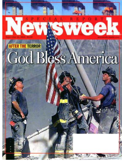
Fotoğraf 3. Newsweek Dergisinin 24 Eylül tarihli baskısında kullanılan kapak fotoğrafı