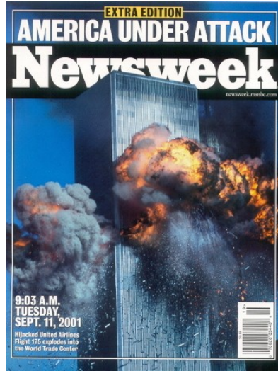
Fotoğraf 2. Dünya Ticaret Merkezine yapılan saldırının Newsweek kapağına taşınması.

Şaşırtıcı olmayan şekilde, ‘Terörizme Savaş’ haberi Birleşik Devletler deki yaşam ve olaylara önemli bir odaklanmayı içermektedir. 11 Eylül saldırı haberlerinde, kurban, hayatta kalan ve ailelerinin çok sayıdaki fotoğrafları kadar terörizmin Birleşik Devletlerde günlük hayata etkisi ile ilgili resimler de yer almaktadır. Bununla birlikte, bu konuda ilginç bir model ortaya çıktı. Ekim 2001 ortasıyla birlikte, 11 Eylül ile direkt ilişkili resimler patlama yıkımı fotoğrafları, kurbanların ve ailelerinin fotoğrafları, kurtarma ve temizleme eylemlerinin resimleri yerini artan şekilde Afganistan’daki askeri eylemlerin fotoğrafları ve şarbon korkusuyla ilgili resimlere bıraktı. Aralık’ın ortaları itibariyle Afganistan fotoğraflarının Ekim-Kasım aylarındaki dalgalanması azalıyordu ve Dünya Ticaret Merkezi’nin çöküş anı ve diğer 11 Eylül konularına ait fotoğraflara bir dönüş söz konusuydu. Sanki Afganistan savaşla ilgili fotoğrafların bir kaynağı gibiydi ve editörler 11 Eylül saldırıları fotoğraflarına dönme ihtiyacı hissettiler.