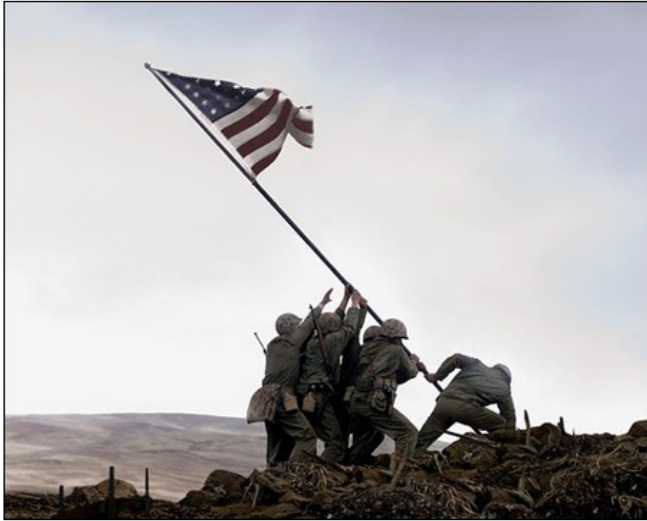
Fotoğraf 4. Joe Rosenthal'ın 2. Dünya Savaşı'nda Pulitzer ödülü kazanan Şubat 1945'te Suribachi Dağı'nın tepesine bayrağı taşıdığı fotoğraf

Dergi fotoğrafçıların fotoğraf koleksiyonlarından da anlaşılacağı üzere resimler genellikle sonraki baskılarda tekrar yayınlanır 'The Year in Pictures', veya The War in Iraq: A Photo History (Life Takımı ve Editörleri, 2003) ya da 21 Days to Baghdad (Time Editorleri, 2003) gibi... İşte bu; sosyal ve politik olayların, ABD ve askeriyesinin rolü açısından baskın ve temsili bir paradigmasını destekleyen daimi ve