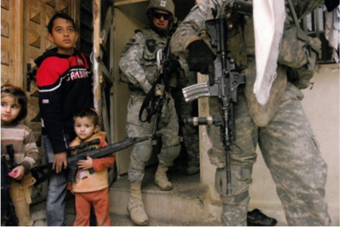
Fotoğraf 6. Amerika'nın Irak'tan geri çekilme sürecinde bazı bölgelerde halen askeri hakimiyetini sürdürmesinin göstergesi olarak gösterebileceğimiz bu fotoğrafta; Amerikan askerlerinin Kerkük ve Musul'da aramalar yapmaktadır.

yoluna gittikleridir. Öyle ki bölgede yaşayan çocukların ellerinde bile silah oyuncak bulunmaktadır.