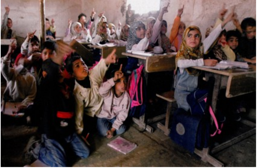
Fotoğraf 13. Irak'ta her gün meydana gelen patlamalarla iç içe yaşanan Iraklı çocuklar.

Amerikanın Irak'tan çekilmesiyle başlayan süreçle ilgili olan yapılan haberde, bu çekilmeyle başlayan süreçte Irak'taki durum hakkında bilgi veren fotoğraflar yayınlanmıştır. Haberin ilk başlığı beyaz alan üzerinde görülmektedir. Iraklıların savaş ile iç içe yaşadıklarını gösteren fotoğrafların ilkinde bölgede yaşayan çocukların görüntüsü sunulmuştur. Okul ortamından çok harabeye benzeyen bir sınıf içerisindeki çocukların durumu gözler önündedir.