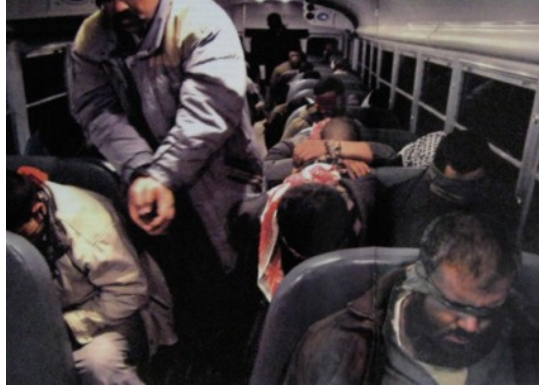
Fotoğraf 21. Musul'da tutuklanıp yargılanmayı beklemek için cezaevlerine götürülen şüpheli ve suçlular.

Amerikan askerinin kapalı bir bayanı incelerken görüntülediği bu fotoğrafta konu başlığı fotoğrafın hemen altında yer almaktadır. İntihar bombacısı olarak devşirilen bir grup kadının bu işten vazgeçmesiyle başlayan süreçte diğer kadınlarında canlı bomba olabileceği düşüncesiyle arama yapan Amerikan askerleri fotoğrafın asıl konusunu oluşturmaktadırlar.