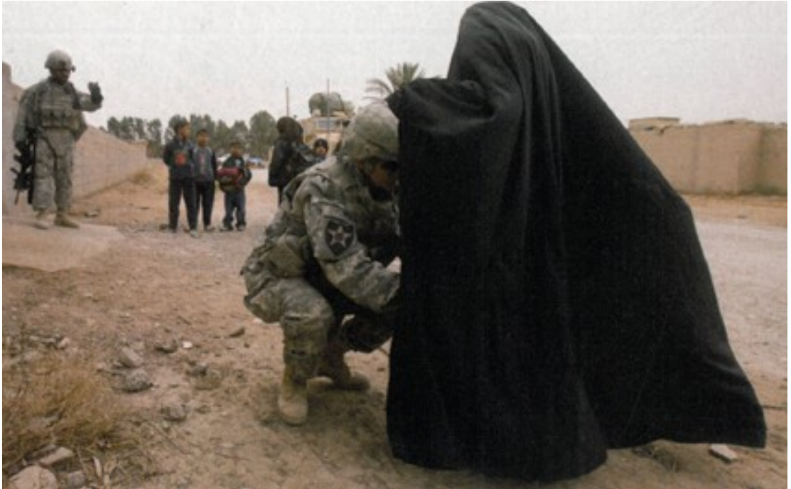
Fotoğraf 22. Bölgedeki gerginliği yansıtan canlı bombalar ile ilgili fotoğraf.

Amerikan askerinin kapalı bir bayanı incelerken görüntülediği bu fotoğrafta konu başlığı fotoğrafın hemen altında yer almaktadır. İntihar bombacısı olarak devşirilen bir grup kadının bu işten vazgeçmesiyle başlayan süreçte diğer kadınlarında canlı bomba olabileceği düşüncesiyle arama yapan Amerikan askerleri fotoğrafın asıl konusunu oluşturmaktadırlar.