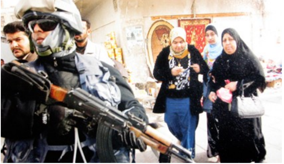
Fotoğraf 17. Amerikanın bölgede halen etkin bir güç durumda olduğunu gösteren bir fotoğraf.

Bölgede yaşanan gerilim ve istikrarsızlığın sonucunda ortaya çıkan görüntülerde şehrin alt yapısı tamamen bozulmuştur. Bununla paralel olarak şehirde yaşayan sivil halkında yaşayış tarzları değişmiştir. Sürekli patlayan bombalar, çatışmalar Amerikan askerinin gereksiz ve dengesiz güç kullanımı bölgeye istikrarın gelebilmesi için daha çok zaman geçmesi anlamına gelmektedir.