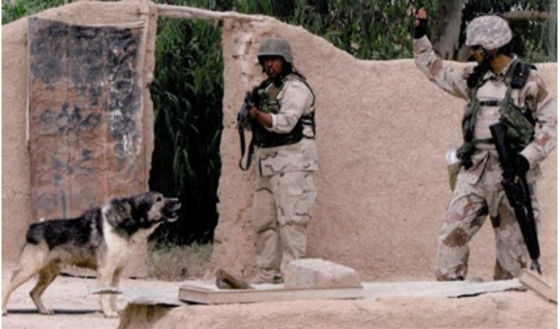
Fotoğraf 19. Amerikan askerlerinin halen bölgede etkin bir rolü olduğunu ve yaşanan olayların merkezi konumunda bulunduğunu gösteren bir fotoğraf.