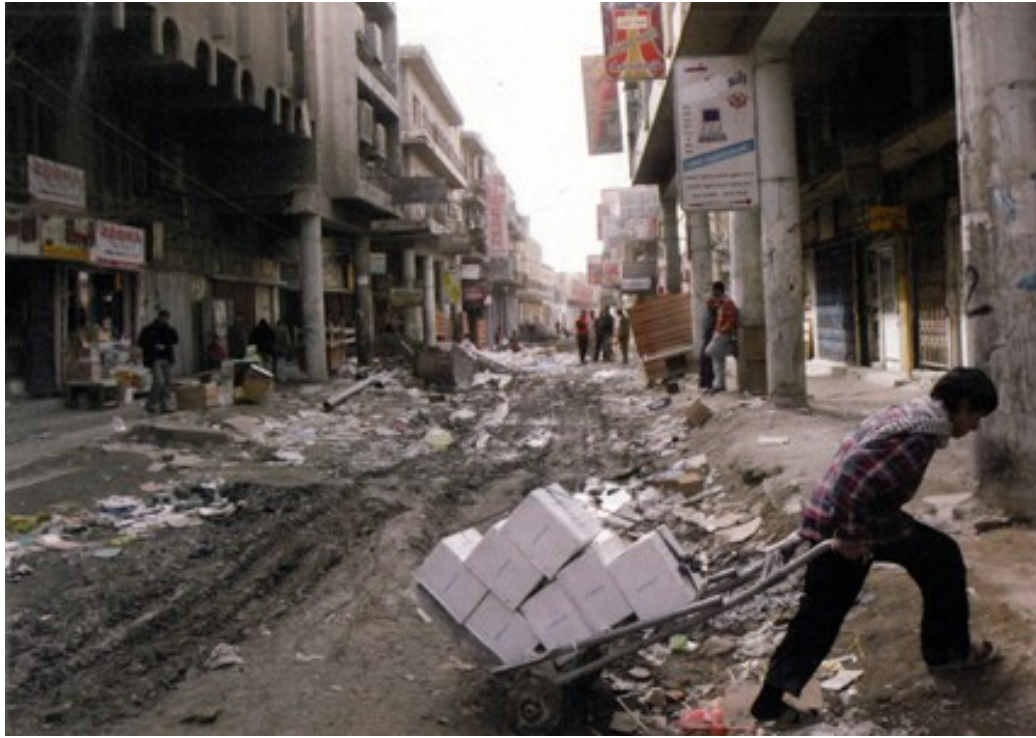
Fotoğraf 16. Günlük yaşamını patlamalar ile iç içe yaşayan Irak halkı.

Irak'ta yaşanan işgalin izlerini dünya ile paylaşmak için ABD askerinin kullandığı görüntü, kendi propagandası çerçevesinde şu şekilde kullanılabilir; "kendi etti kendi buldu". Bölgeye istikrar sağlamak amacıyla gelen Amerikan askerine yönelik saldırılar haksız olarak gösterilmekle birlikte Amerikan askerinin güvenliğini tehdit edecek herhangi bir olaya karşı sivil halkı ya da bölgedeki direnişçilere uygulamış olduğu gereksiz güç haklı olarak gösterilmektedir.