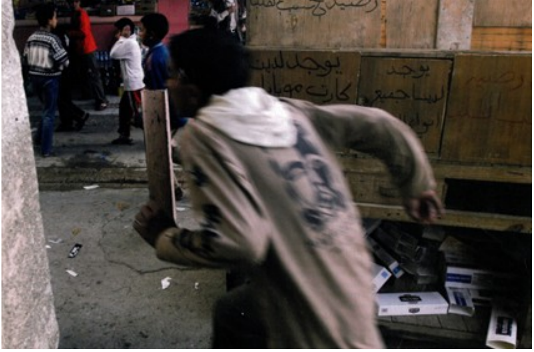
Fotoğraf 14. Tansiyonun her geçen gün yükseldiği Irak'tan bir görüntü.

Hemen hemen her köşe başında patlayan bombalarla birlikte yaşayan çocukların sokaklarda ki görüntülerinin verildiği diğer bir fotoğrafta hareket halindeki çocuklar görülmektedir. Düşük enstantane ile çekilen fotoğrafta hareket etkisi görülmektedir. Bombaların ard arda patladığı bölgede hareketin her zaman üst seviyede olması kaçınılmazdır.