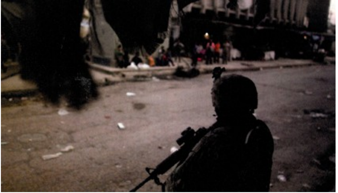
Fotoğraf 23. Bölgeyi tahrip eden Amerikan askerinin aynı anda yapıcı özelliklerinin olduğunu göstermeye çalışılan bir kare.

Amerika sanki Irak'ın gerçek sahibi gibi gösterilmektedir. Irak'ın yönetimini askeri güç ile elinde bulunduran Amerika, bölgede kendi çıkarlarına ters düşebilecek her olaya ve duruma müdahale etme hakkına sahiptir. Bu bağlamda Amerika işgal ettiği Irak'ı istediği yönde kontrol edebilmekte ve istediği gibi yönetebilmektedir. Bölgede yaşayan sivil halkı bile suçlu ya da suçsuz infaz etme yetkisine sahiptir. Elbette bu gücü elinde bulundurmasının tek nedeni istikrar sağlamak için geldiği bu topraklarda zengin gelir kaynaklarını elinde bulundurmaktır.