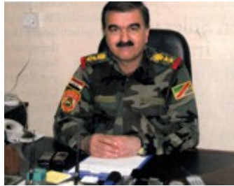
Fotoğraf 20. Irak ordusu ve Musul'da tutulan şüphelilerin görüntüleri. Irak ordusunun istihbarat servisi G2'nin başındaki Albay Yusuf Ahmet Kader.