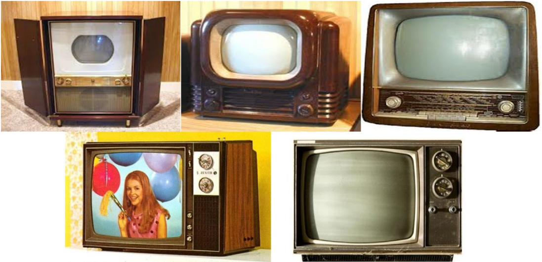
Resim 3. Birbirinden Farklı Televizyon Görselleri (Google, 2018)

İstanbul Teknik Üniversitesi'nin 1952 yılında kendi bünyesinde yaptığı televizyon yayını Türkiye'deki ilk televizyon yayını olarak tarihe geçmiştir (Şeker, 2016: 38).