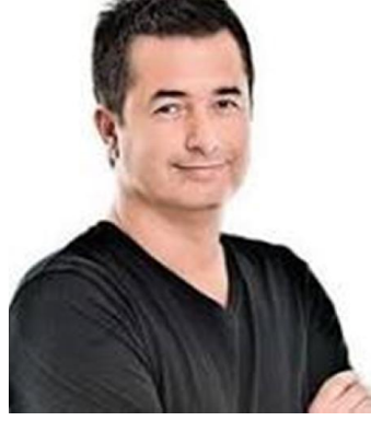
Resim 18. Acun Ilıcalı

Acun Ilıcalı, 29 Mayıs 1969 tarihinde, Edirne’de, Ergün ve İlknur Ilıcalı çiftinin ikinci çocuğu olarak dünyaya gelmiştir. Türk televizyonculuğunun önemli programlarının başarılı bir yapımcısıdır. Babası müteahhit, annesi ise üniversite eğitimi almış bir müdire olan Acun Ilıcalı’nın Ömer Cenker Ilıcalı adında bir abisi vardır. 5 yaşında başladığı Edirne İstiklâl İlköğretim Okulu’nda ilk ve orta öğrenimini tamamladıktan sonra İstanbul Kadıköy Maarif Koleji ve Kadıköy Anadolu Lisesi’nde lise eğitimini almış, 7 yıl devam ettiği İstanbul Üniversitesi İngilizce Öğretmenliği Bölümünden diploma almadan ayrılmak zorunda kalmıştır. Kendisi için çok değerli olan hemen her fırsatta bahsettiği dedesini ve babaannesini trafik kazasında kaybetmesi onu çok üzmüştür (Biyografi, 2016).