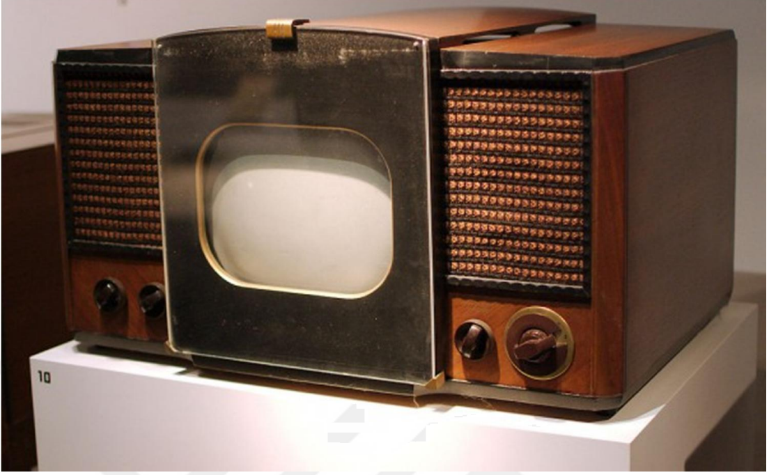
Resim 4. İlk Seri Üretim Televizyon (CNNTürk, 27.05.2017)