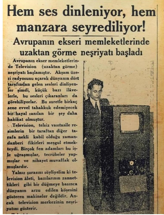
Resim 6. İlk Televizyonun Ulusal Gazetelerdeki Manşeti (Avcı, Öz, t.y.)

Yunanca uzak anlamına gelen “tele ” ile Latince “görme ” anlamındaki “Visio ” sözcüklerinin birleşmesiyle oluşan “Televizyon ” kelimesinin anlamını, “uzaktakini görme ” olarak değerlendirmek mümkündür (Tekiner, 2016: 7).