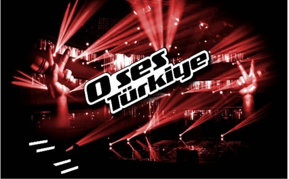
Resim 9. O Ses Türkiye Logosu (O Ses Türkiye, 12 Mart 2016).

2011 yılında yayın hayatına başlayan “O Ses Türkiye ”, bu çalışmaya başladığımız döneme kadar, yedi sezon olarak yayınlanmış, sekizinci sezon ise devam etmekteydi. Çalışmamızın bitimine doğru yarışmanın sekizinci bölümü de sonuçlanmıştır. Sunucusu hiç değişmeyen yarışma programının jüri üyeleri ise hemen her dönem bir- iki değişiklikle de olsa toplam olarak 13 jüri üyesi ve 8 finalistle tüm sezonları tamamlamıştır.