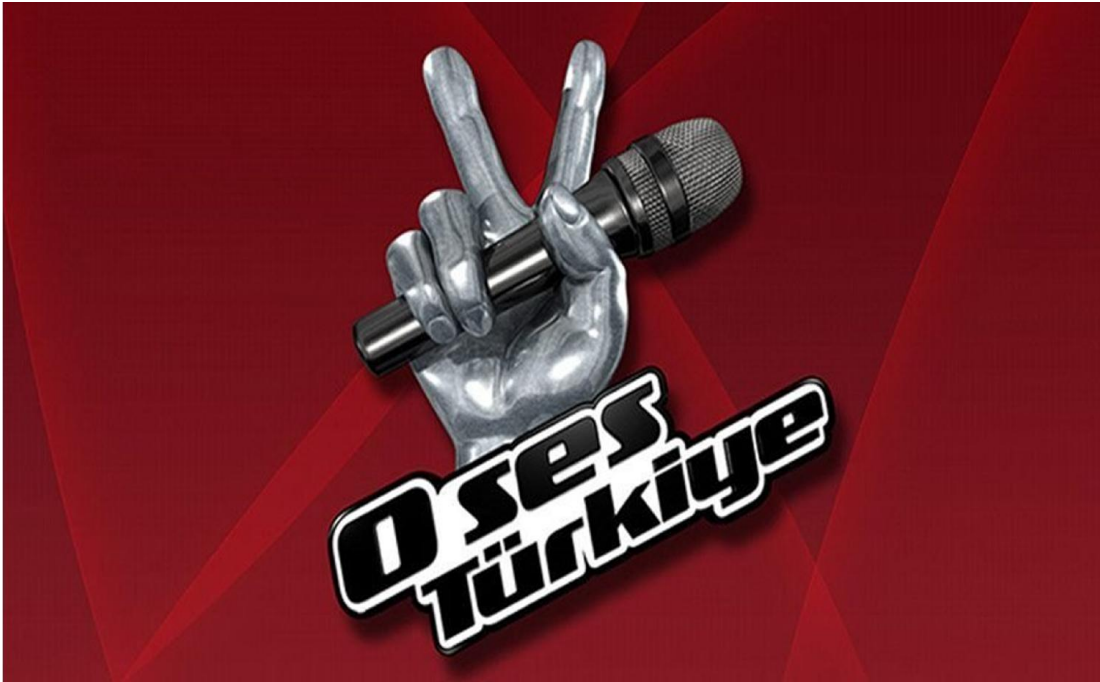
Resim 8. O Ses Türkiye Logosu (O Ses Türkiye Logosu, t.y.)

Pek çok ülkede “The Voice ” adı ile ekranlarda yer alan program, yayınlandığı her ülkede beğeniyle izlenmiştir. Yarışma, Türkiye’de ilk defa 10 Ekim 2011 tarihinde “O Ses Türkiye ” adı ile Show TV’de yayınlanmıştır. Daha sonra ise Star TV (2012-2014) ve son olarak TV8 (2014-2019) ekranlarında 8 yıldır yayın hayatına devam etmektedir. Ayrıca çocuk adayların katıldığı ve “O Ses Çocuklar ” olarak adlandırılan çocuklara yönelik programlar da yapılmıştır (Acun Medya, 2017).