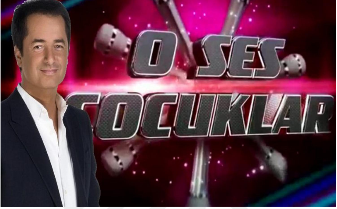
Resim 19. Acun Ilıcalı O Ses Çocuklar (Sözcü, 12 Mayıs 2016)

katılabildiği “O Ses Çocuklar ”, yayınlandığı ülkelerde “The Voice Kids ” adıyla bilinir.