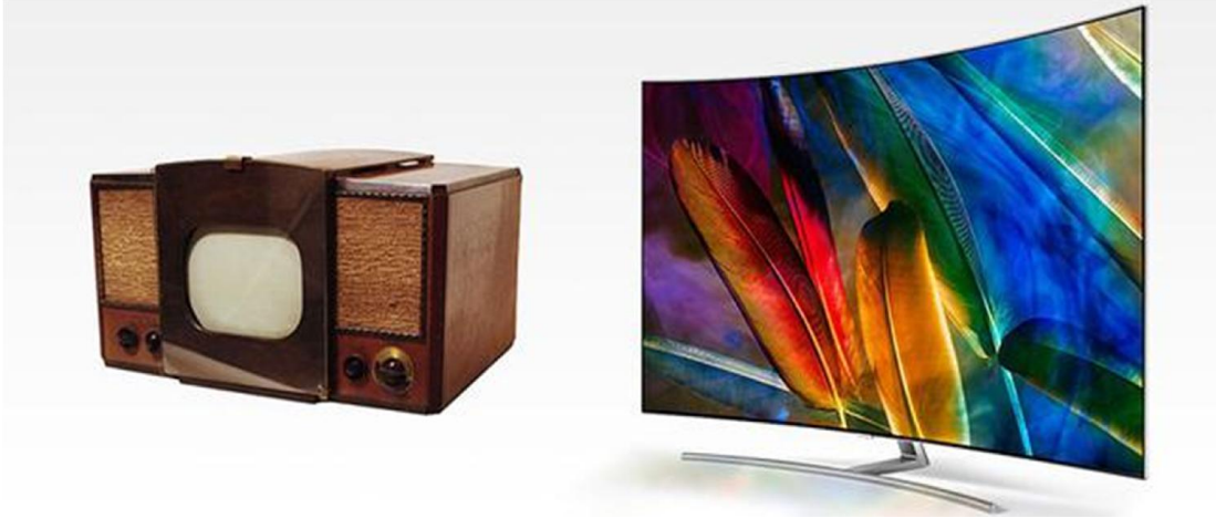
Resim 7. İlk Dönem Televizyonu ile Son Dönem Televizyon Görselleri

Televizyon hakkındaki bu bilgilerden sonra, ilk seri televizyon ile en son televizyon modellerinden biri yan yana getirildiğinde teknolojideki değişim, gelişim rahatlıkla görülebilmektedir: