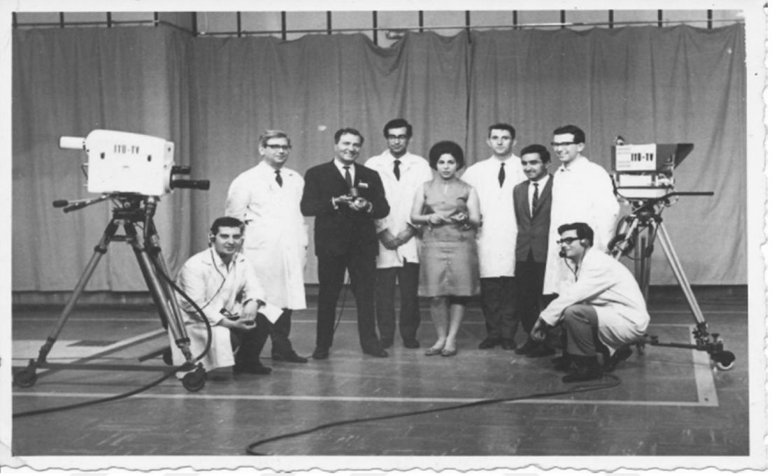
Resim 2. İTÜ Televizyon Stüdyosu (Google, 2018)

kurulmuştur 1971 yılında İstanbul Teknik Üniversitesi yayın hayatına son vermiş ve TRT bünyesinde yayımlara başlanmıştır. 1974'te önceleri haftanın 5 günü 20 saat yayın yapılırken, mart ayında haftanın 6 günü, nisan ayında ise haftanın 7 günü yayın yapılmaya başlanmıştır (Öksüz, 2009: 9).