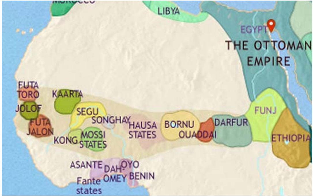
Harita 1. 1789 yılında Biladü's-Sudan denilen bölgede bulunan devletler.

( http://www.timemaps.com/history/africa-1789ad )