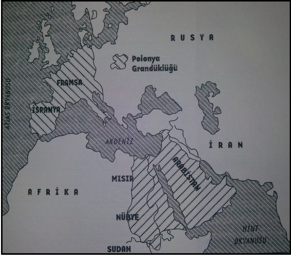
Harita 2. Mehmet Ali Paşa'nın 1839'daki sınırları ile Napolyon'un 1811 Sınırları (Sinoue, a.g.e. , s.157.)