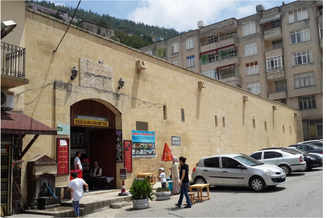
EK.1. Kanuni Sultan Süleyman'ın Belen'de hac yolcuları için yaptırdığı hanın ön cepheden görüntüsü.