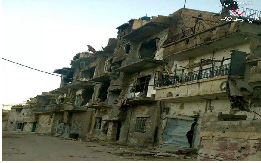
Şekil 1.1. Göçe Neden Olan Bir Suriye Mahallesi

Politik nedenler; yönetimlerin politik faaliyetleri sırasında kendilerine zıt görüşe sahip olan halka yaptıkları baskı ve dayatmayla ortaya çıkmaktadır. Hükümetin politika kararları yüzünden temel görevlerini halkına karşı yerine getirmemesi durumunda, halk son çare olarak vatanını terk etme kararı alabilir. 47