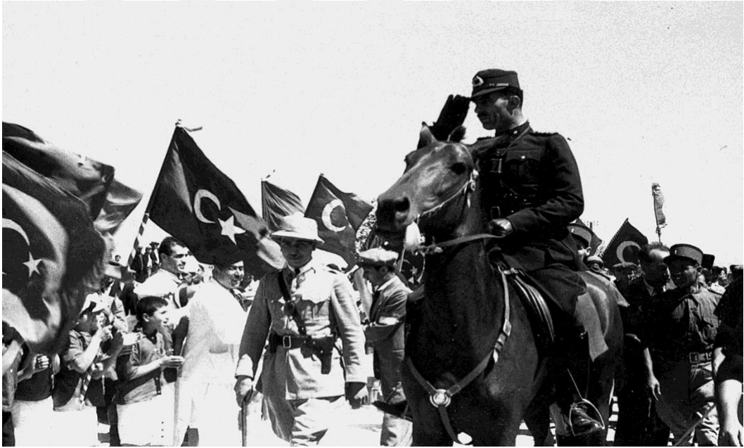
Kaynak: http://www.antakyatso.org.tr/index.php?sayfa=anavatana_katilisi&dil=tr , (11.04.2019).