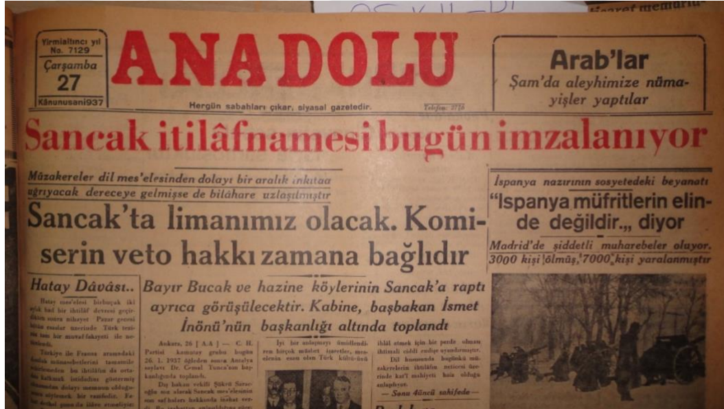
Kaynak: Anadolu Gazetesi- 27 Ocak 1937, s.1.

EK-6: MC'de imzalanan Sancak Antlaşması haberi Anadolu gazetesinde haber oluyor.