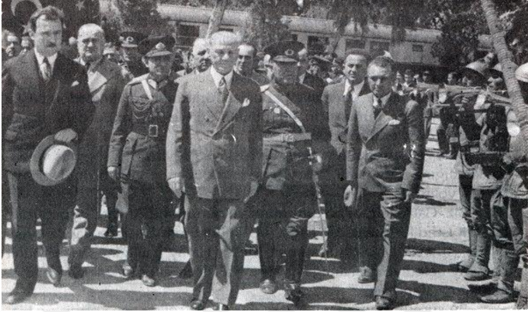
Kaynak: Selim Çelenk. Hatay'ın Kurtuluş Mücadelesi Anıları, Zirem Basımevi, Antakya, 1997, s.96.