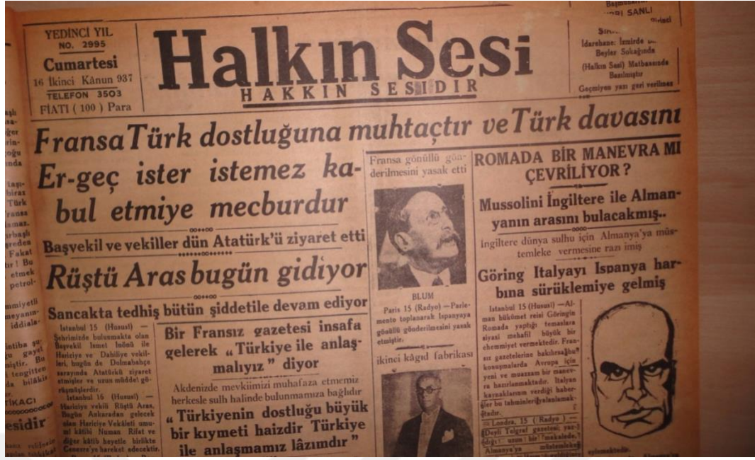
Kaynak: Halkın Sesi Gazetesi- 16 Ocak 1937, s.1.

EK-8: Yeni Asır gazetesi Fransa'yı manşet haberiyle uyarıyor.