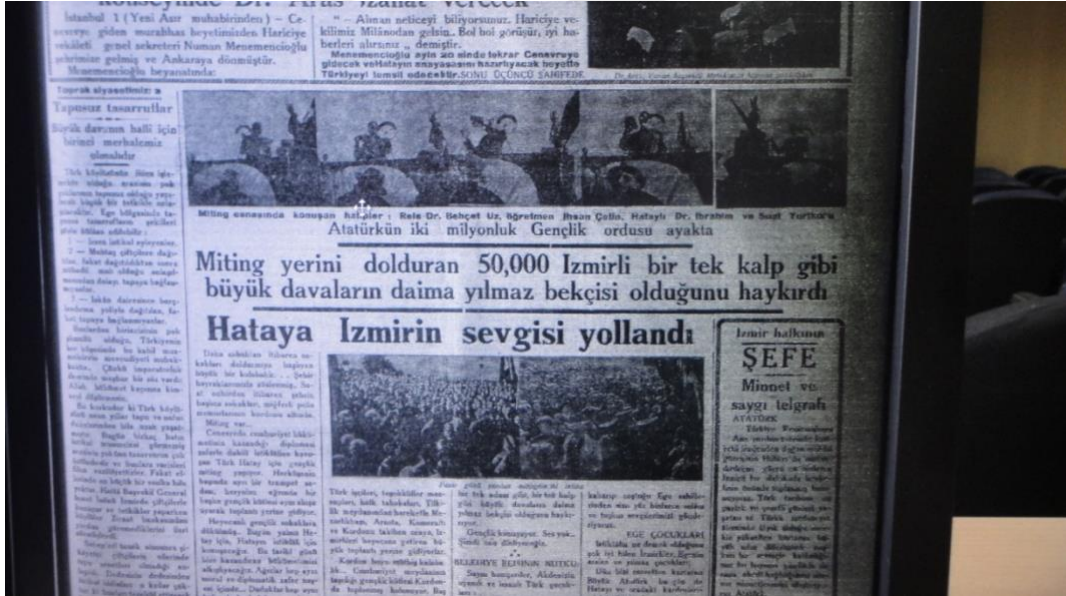
Kaynak: Yeni Asır Gazetesi- 2 Şubat 1937, s.1.

EK-4: Hatay'ın Suriye'den ayrılması yönündeki Cenevre kararını İzmirliiler kutluyor.