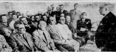
Demokrat Parti delegeleri kongre esnasında partinin kuruluşuna ilişkin konuşmalarını yapıyorlar

Ankara, 7 (Teflis) — Demokrat Parti Başkanı Celâl Bayar, partinin ilk büyük kongresinde açılış nutku söyledi. Demokrat Parti büyük kongresi, Ankara'da dün öğleden sonra saat 14.30'ta başladı. Celâl Bayar, kongreye katılan üyelerle konuşmuş ve partinin ilk büyük kongresinin önemini vurgulamıştı. Bayar, kongrenin başarılı geçmesini ve partiye yeni bir enerji kazandırmasını umut ettiğini söyledi. (Devamı 5. s. 2. B. 1. sat.)