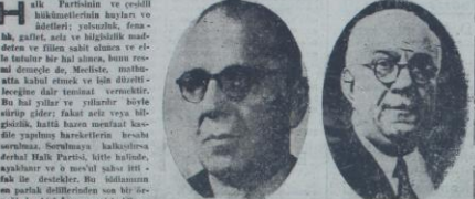
Genel Başkan Celal Bayar, Eskişehir Demokrat Parti Kongresi'nde konuşuyor.

D. Parti Başkanı Amerikan kredisi hakkında iktidara şiddetle hücum etti “Bugünkü durum hükümet mekanizmasının yanlış hareketlerinden doğmuştur, eğer hakiki vaziyet anlatılsaydı müsaîd şartlar elde ederdik, “Antidemokratik Kanunların değiştirilmesinin arefesinde bulunuyoruz, yarın hep birlikte bayram yapacağız...”