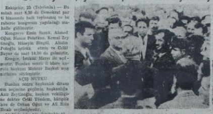
Eskişehir Demokrat Parti kongresinde konuşan Celal Bayar.