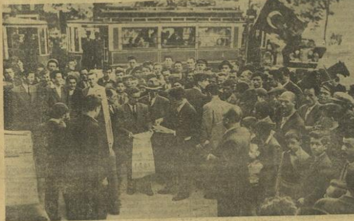
Fatihle oylar, halkın gücünü önünde tanımlıyor.

Demokrat Partinin İstanbul, Bursa, Kocaeli, Kırklareli, Çiğir, Amasya, Afyon, Bolu, Manisa, Rize, Zonguldak, Konya, Çörne ve Eskişehir vilâyetlerinde seçimleri kazandığı anlaşıyor