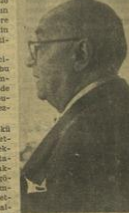
D. Parti Başkanı Celâl Bayar'ın basın beyanattaki konuşması.

Ankara 15 - D. P. Başkanı Celâl Bayar dün akşam saat 20 de parti merkezinde bir basın toplantısı yaparak seçimlerin etmiş olduğunu ve seçimin serceyan tarahı hakkında iştiraklerini bildirdi. Bayar, yabancılara teminlerinin de buhar bulundukları ve iştiraklerini tahmin ettiğini söyledi. Seçimlerin intizam ve sükun içinde serceyan etmiş olduğunu bildirdi. İhtisatî Filen idare etmiş olduğunu söyledi. «Eğer seçimler bir buğünkü durum arasında memnuniyetle başta yerinde iştirak etmiş olsaydı, İhtisatî Filen idaresinin memnuniyetle başta yerinde iştirak etmiş olduğunu bildirdi. İhtisatî Filen idaresinin memnuniyetle başta yerinde iştirak etmiş olduğunu bildirdi. İhtisatî Filen idaresinin memnuniyetle başta yerinde iştirak etmiş olduğunu bildirdi.»