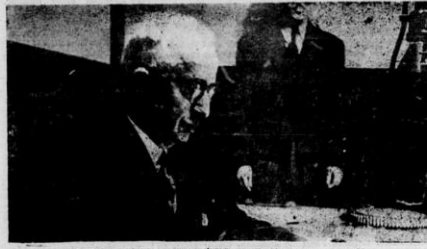
Dün tarihî tebliğini yayınlayan İsmet İnönü'nün konuşma esnasında

Peker - Bayar arasındaki görüşmeleri açıklayan İnönü " Ben Devlet Reisi olarak, kendimi her iki partiye karşı müsavî derecede vazifeli görürüm ,, diyor