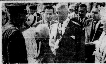
İsmet İnönü ve Recep Peker'in dün 41'inci görüşmesi

Avrupalıların Paris'te, en az garbî kadar, belli de daha fazla tedavîye mühter. Oyle olduğu takdirde İsmet İnönü'nün konferansa katılması, Türkiye'nin dış politikasındaki önemli bir gelişmedir.