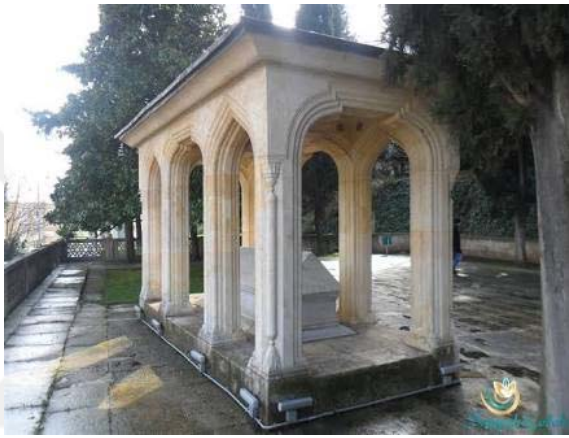
Süleyman Çelebi'nin Kabri Yoğurtlu Baba Zaviyesi 19

Hakkında sınırlı ve güvenilmeyen rivayetler bulunan Süleyman Çelebi, 825/1422'de Bursa'da vefat etmiş ve Çekirge semtindeki Eski Kaplıca civarında Yoğurtlu Baba Zaviyesi haziresine defnedilmiştir. 18