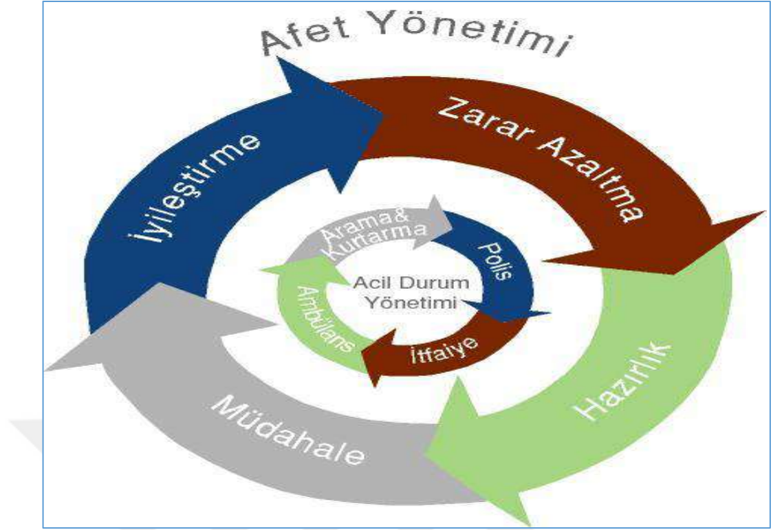
Şekil 2: Afet Yönetiminin Evreleri (Kadıoğlu, 2008: 3).