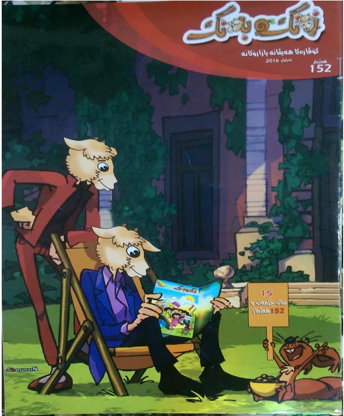
KOVARA (ZENG Û BENG)